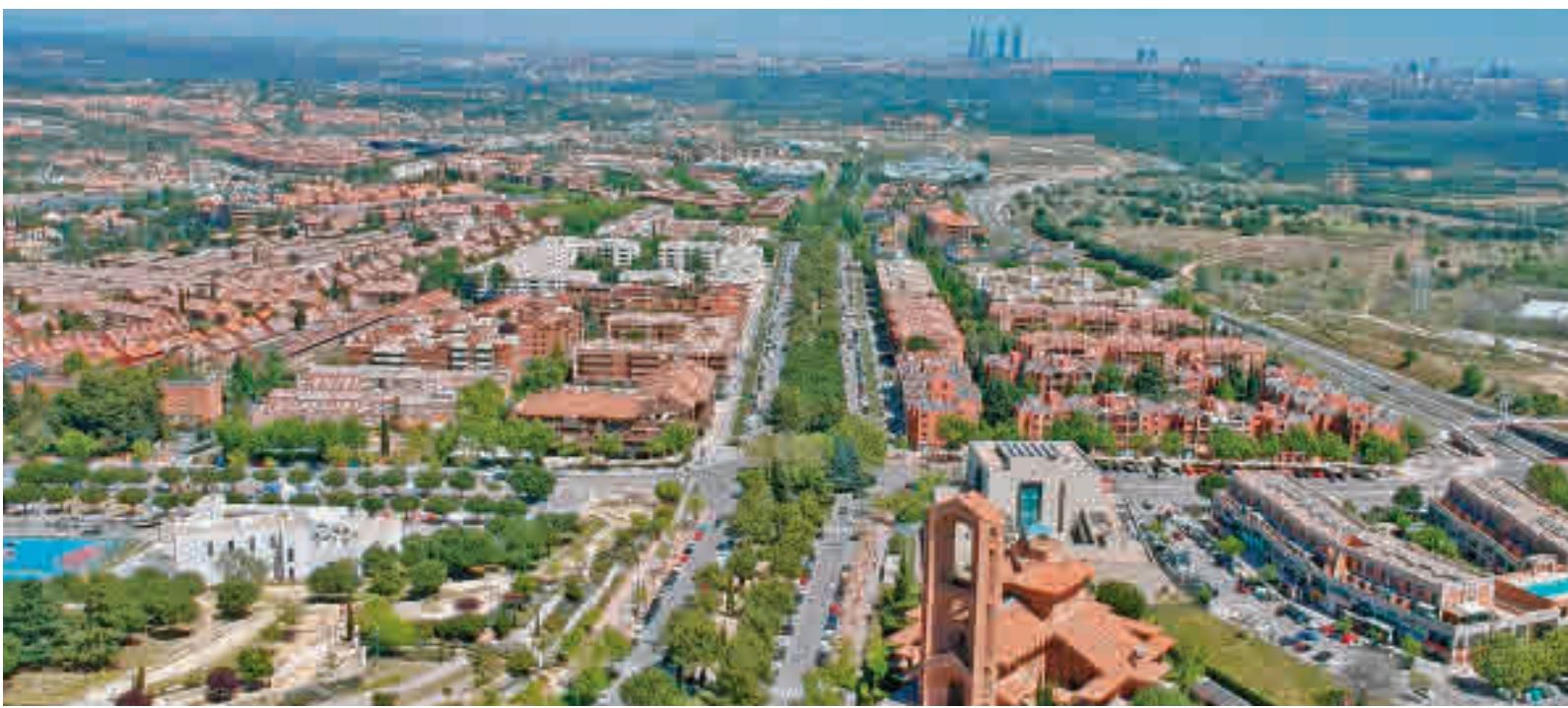
Las renta media más alta de España sigue estando en Pozuelo