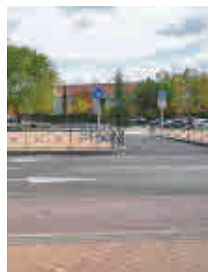
Aspecto de la zona

Según señaló el Consistorio boadillense, con esta actua-