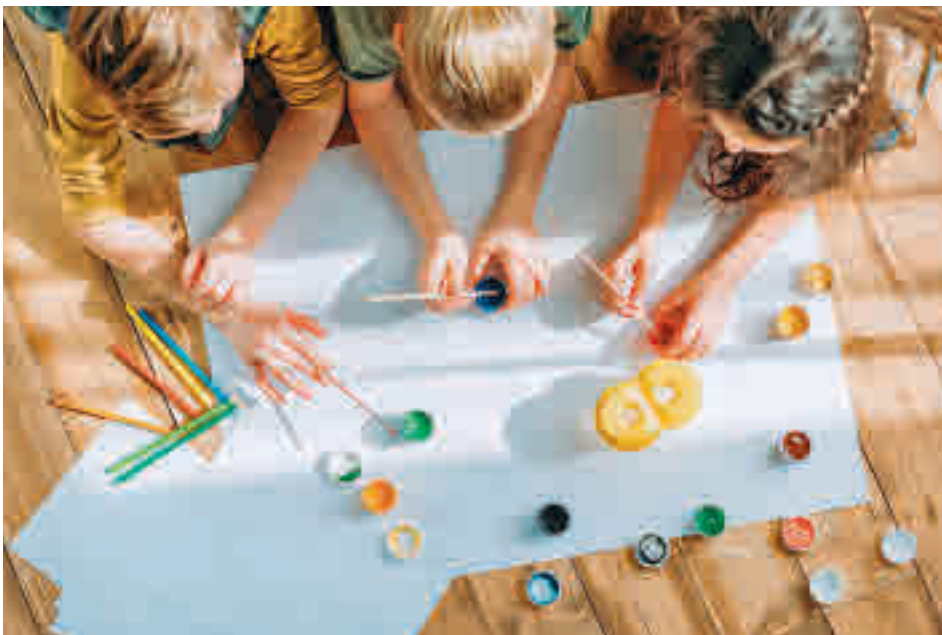
Las dos mejores obras pictóricas recibirán una camiseta firmada por los jugadores de 'la Roja'

La actualidad de los municipios del Noroeste, en nuestra web