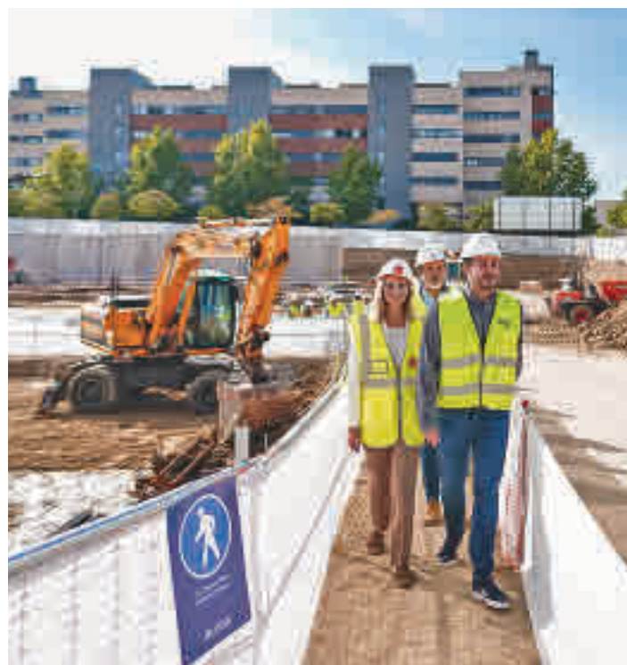
Visita de la consejera de Vivienda a Alcorcón

SE TRATA DE PISOS DE DOS Y TRES DORMITORIOS CON GARAJE