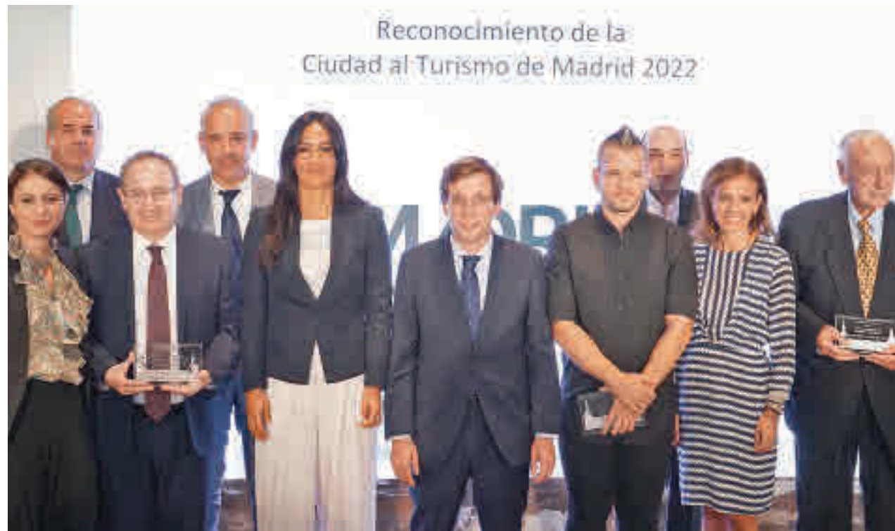
Foto de familia de las autoridades junto a los galardonados de 2022

El alcalde de Madrid, José Luis Martínez-Almeida, se comprometió a correr en la tarde del próximo 31 de diciembre la San Silvestre Vallecana, lo que le convertiría en el primer regidor en hacerlo. El primer edil destacó el "homenaje, reconocimiento y admiración" que ha querido trasladar el Ayuntamiento con esta distinción a la "carrera popular más querida de la capital".