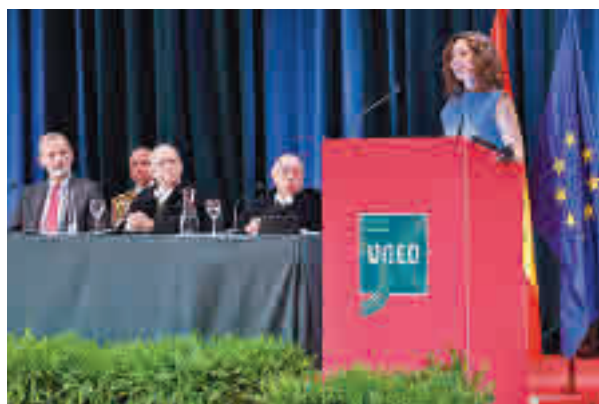
Díaz Ayuso, durante su intervención

evitar un riesgo: las carencias de quien sabe mucho de una cosa e ignora de raíz todos los demás. El profesionalismo y el especialismo al no ser debidamente compensado ha roto en pedazos al hombre europeo", señaló Díaz Ayuso.