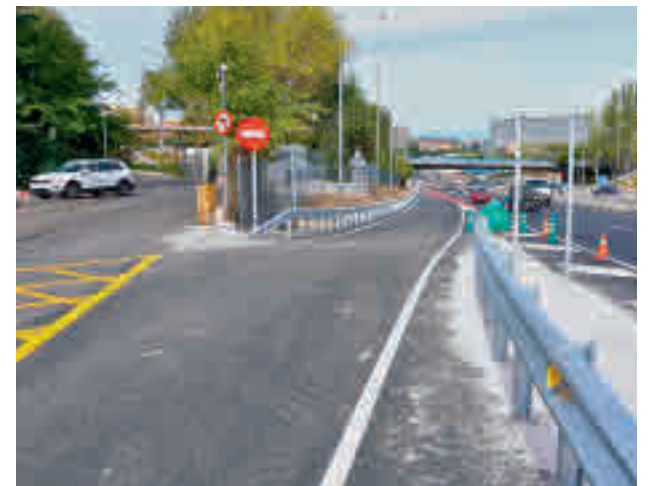
El nuevo ramal de conexión

La obra se ha ejecutado en el tramo de la M-30 comprendido entre el punto kilométrico 30.9 hasta el 31.1 y en la propia conexión del hospital universitario. El ramal tiene una longitud de 180 metros, con un ancho de carril de 4 metros, un arcén interior de 0,5 metros, y exterior de 1 metro. El delegado de Medio Ambiente y Movilidad, Borja Carabante, visitó el nuevo tramo el 28 de septiembre.