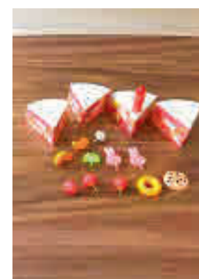
Un juego de montaje

Un equipo de investigación de la Universidad de Almería (UAL) ha desarrollado un estudio que muestra los beneficios de la realización de juegos de montaje dirigidos en la enfermedad de Alzheimer. Los expertos han confirmado