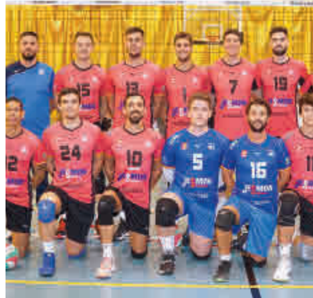
Un poco más de espera: La Superliga Masculina 2, por su parte, no arrancará hasta el sábado 8. En el Grupo A están encuadrados los equipos madrileños: Grupo Egido Pinto, VP Madrid, cvleganes.com, CUV Alcorcón y CV Collado Villalba.