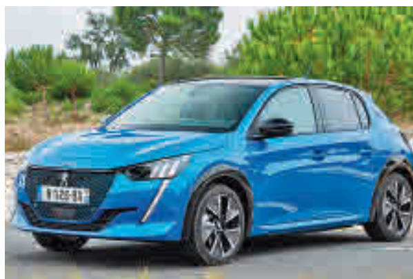
Imagen promocional del Peugeot e-208 PEUGEOT

Uno de los mayores inconvenientes es su precio, ya que la mayoría supera los 30.000 euros. Es por ello que la Organización de Consumidores y