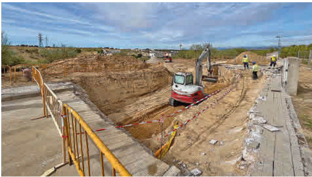
Trabajadores y excavadoras, en el ámbito de actuación