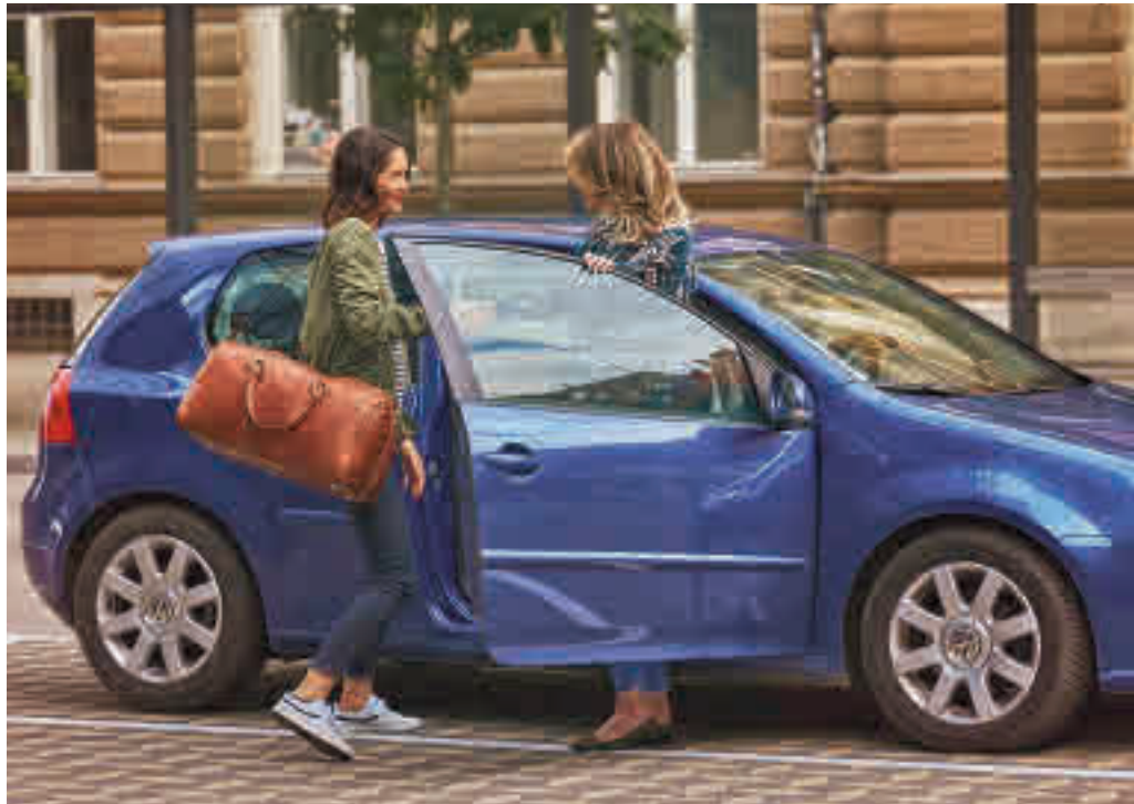
El coche compartido es una opción de transporte alternativo

El objetivo es reducir el número de vehículos en circulación y fomentar el hábito de compartir coche entre personas que hacen los mismos trayectos aprovechando los asientos libres de sus vehículos. Para conseguirlo, Las Rozas Innova ha vuelto a aliarse con HOOP Carpool, una aplicación para móvil y PC, que permite poner en contacto a personas que realizan similares trayectos a la misma hora. Para beneficiarse de las ayudas es necesario registrarse en la app, introducir el código promocional de Las Rozas Innova LASROZAS22S en 'Mi perfil' y publi-