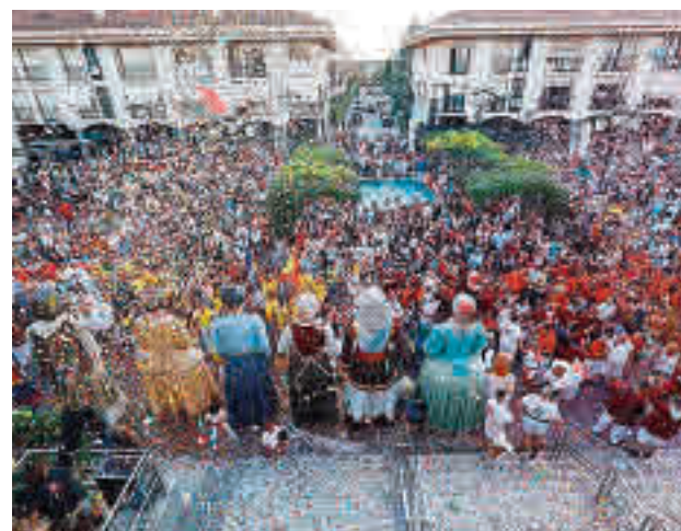
Pozuelo celebró sus fiestas la semana pasada

Este dispositivo especial de seguridad incluyó, entre otros,