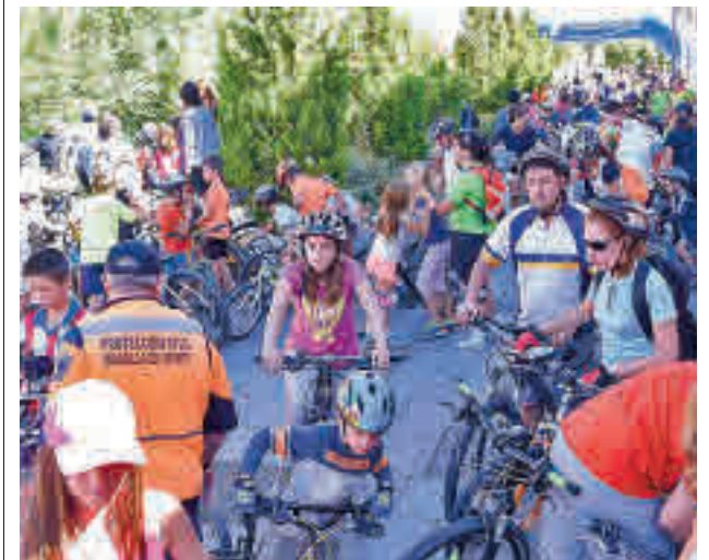
Los boadillenses podrán vivir un día en familia

Por otro lado, durante toda esa semana, el alta para el uso del servicio de alquiler de bicicletas eléctricas BIBO será gratuita y el domingo 16 se podrá utilizar sin pagar el servicio de alquiler.