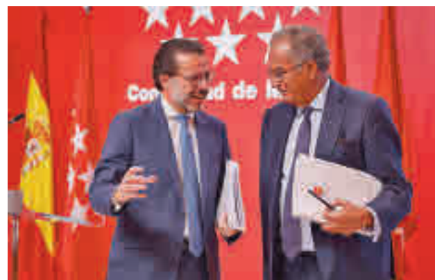
Consejo de Gobierno

La Comunidad ha dado luz verde a la convocatoria de las ayudas del bono del alquiler joven con 250 euros mensuales del Gobierno central dirigidas a menores de 35 años que arrienden un inmueble o una habitación en la región.