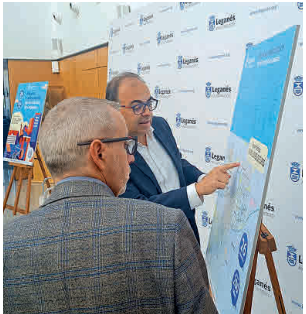
Presentación de las obras en las calles de Leganés

El alcalde aprovechó la comparecencia ante los medios de comunicación de esta semana para adelantar que, en las próximas semanas, comenzarán obras por unos 40 millones de euros. Entre ellas, ya están adjudicadas y con previsión de inicio los traba-