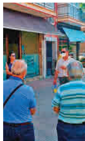
Viajes de mayores

Las solicitudes ya se pueden recoger en cualquiera de los cinco centros de mayores: Gregorio Marañón, Juan Muñoz, El Carrascal, Miguel de Cervantes de Vereda de los Estudiantes o Tierno Galván de La Fortuna.