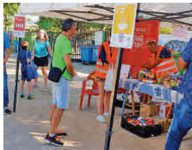
Parte de los alimentos donados

El evento, que se suspendió a principios del pasado