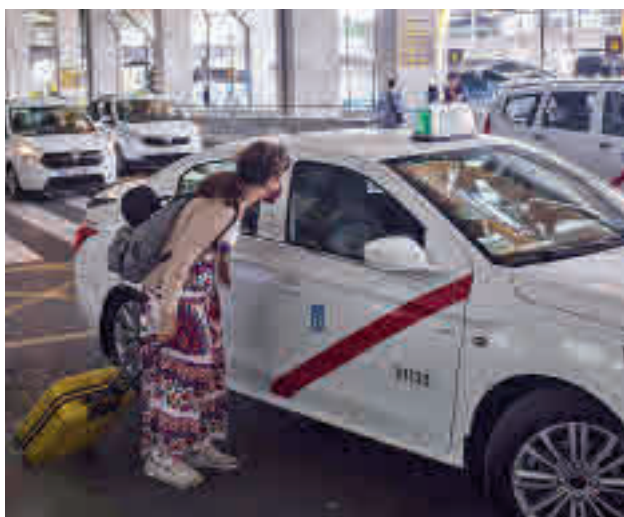
Taxis en Madrid