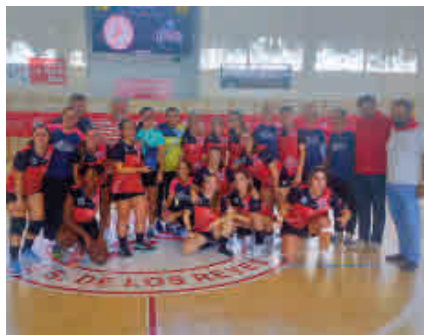
El Getasur disputó un amistoso en la pista del Sanse

Para abrir boca, el Polideportivo Alhóndiga acoge este sábado 17 (20 horas) el derbi entre el Getasur y el Balonmano Leganés. El encuentro, de rivalidad vecinal, servirá para ver cómo se presentan ambos conjuntos de cara a esta