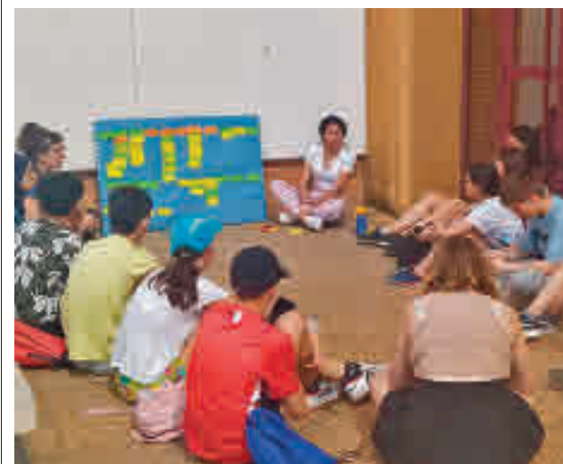
Talleres para jóvenes en Leganés

gentedigital.es Toda la actualidad de Leganés, en nuestra página web