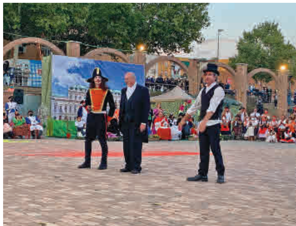
Recreación del último duelo a pistola del pasado año