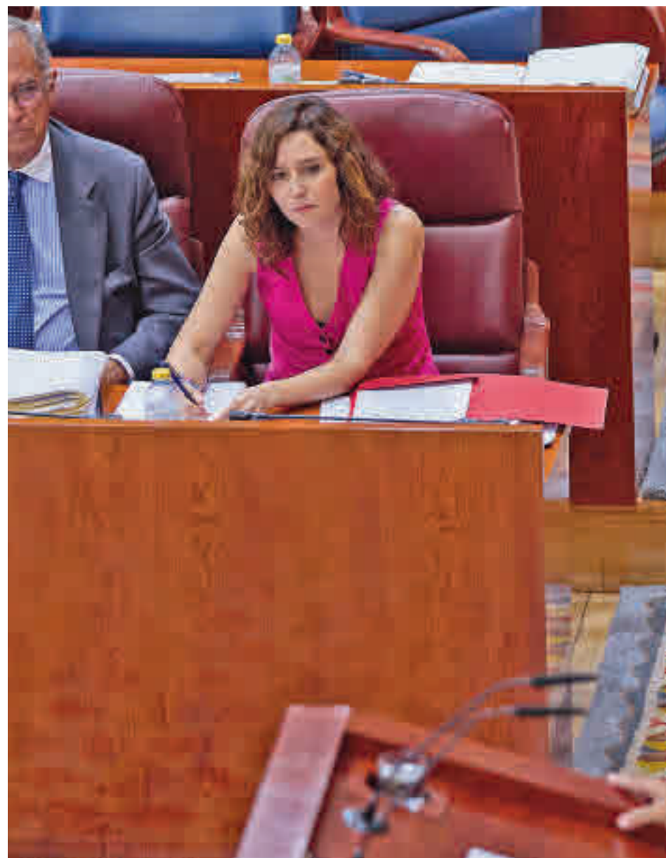
Isabel Díaz Ayuso, durante el Debate sobre el Estado de la Región

Ayuso mostró su preocupación por las adicciones de los más jóvenes y el aumento de delitos entre ellos y se comprometió a actuar es ese sen-