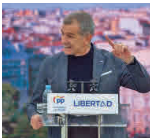
Toni Cantó emprende una nueva etapa

EL PERIÓDICO GENTE NO SE RESPONSABILIZA NI SE IDENTIFICA CON LAS OPINIONES QUE SUS LECTORES Y COLABORADORES EXPONGAN EN SUS CARTAS Y ARTÍCULOS