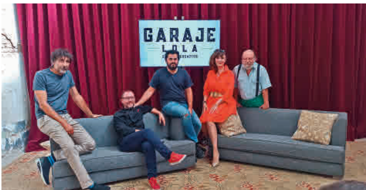
Presentación de la programación en el local ubicado en el número 53 de la calle Sorgo GENTE

» Teatro Municipal. Domingo 18, 19 horas. Precio: 5 euros.