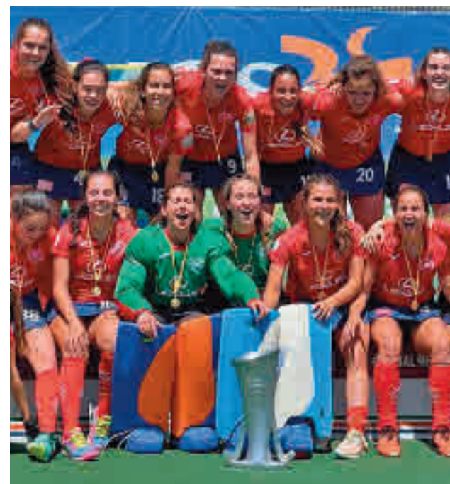
El Sanse Complutense, con el título de campeón RFEH

Después de tres jornadas, los campeones de cada grupo accederán directamente a las semifinales, programadas para el sábado 8 de octubre en Espartales (Alcalá de Henares), sede también de la final del domingo 9. Con estos encuentros, el Memorial Juan Caño contará en total con 27 partidos, una cifra récord desde que se viene celebrando el torneo.