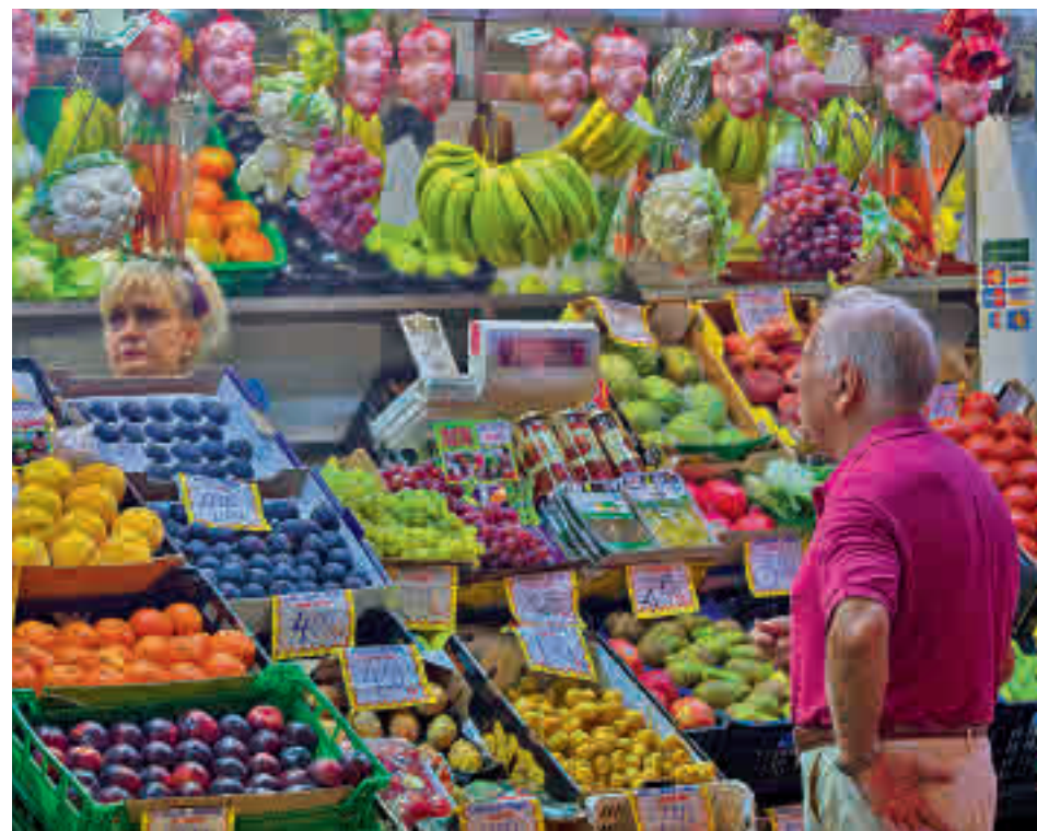
Los productos básicos se han encarecido

Un madrileño ha iniciado una recogida de firmas en la plataforma Change.org para rebajar el coste de los productos básicos • Hasta el momento ha recibido 35.000 apoyos