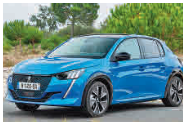
Imagen promocional del Peugeot e-208 PEUGEOT

Uno de los mayores inconvenientes es su precio, ya que la mayoría supera los 30.000 euros. Es por ello que la Organización de Consumidores y