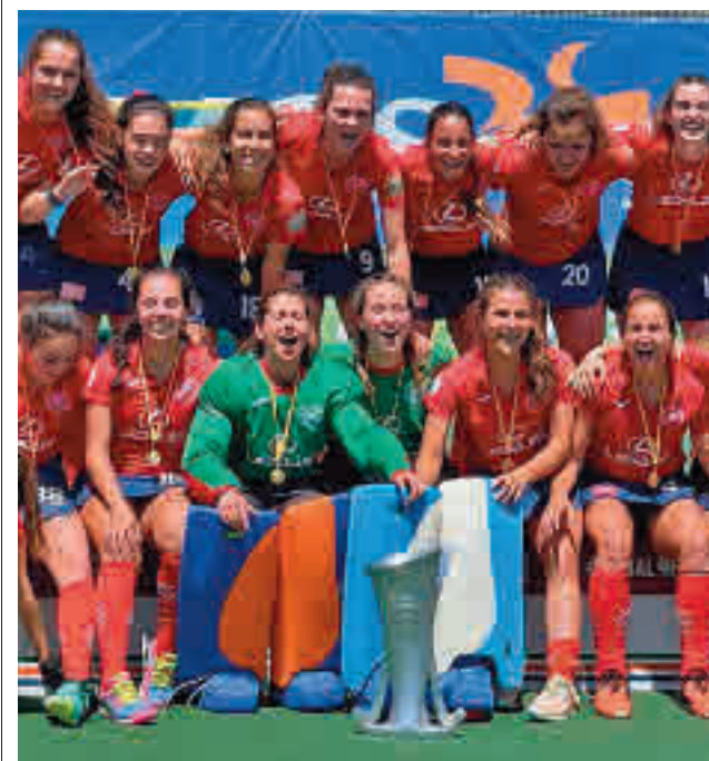
El Sanse Complutense, con el título de campeón RFEH

Después de tres jornadas, los campeones de cada grupo accederán directamente a las semifinales, programadas para el sábado 8 de octubre en Espartales (Alcalá de Henares), sede también de la final del domingo 9. Con estos encuentros, el Memorial Juan Caño contará en total con 27 partidos, una cifra récord desde que se viene celebrando el torneo.