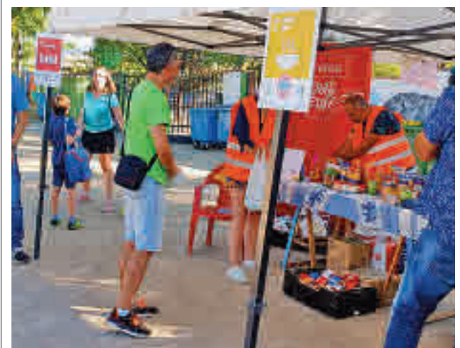
Parte de los alimentos recogidos

Así, ha estimado el recurso contra la sentencia del Juzgado de lo Penal nº 35 de Madrid que condenó al hombre a 6 meses de cárcel como autor de un delito de maltrato en el ámbito familiar, por lo que revoca esta resolución al considerar que se trata de un delito leve de maltrato con una pena de un mes de multa con cuota diaria de seis euros. La relación entre ambos es clave para que los hechos sean o no delito.