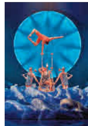
Imagen del espectáculo

Este espectáculo, una "explosión de luz y lluvia" imaginada por el director de escena Daniele Finzi Pasca, ha sido la producción con la que el Circo del Sol ha regresado este 2022 y podrá verse a partir del 5 de noviembre y hasta el 8 de enero de 2023 en el Escenario Puerta del Ángel.