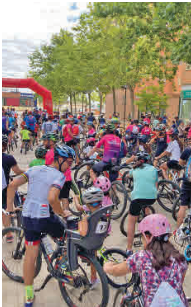
Ruta ciclista en Getafe

Las jornadas comenzarán el viernes 16 de septiembre a las 18 horas, con una charla sobre las Zonas de Bajas Emisiones en la Sala de conferencias de la Fábrica de Harinas. El domingo 18 a las 10 horas comenzará el día con una ruta en bicicleta que saldrá del Centro Social de Los Molinos. A partir de las 10:30 horas, se instalará el tradicional circuito infantil en la plaza General Palacio. En esta