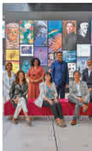
Presentación del curso

La primera de ellas es la de ‘Momias de Egipto’, que estará en el Paseo del Prado hasta el 26 de octubre. En septiembre se inaugura una muestra sobre Nikola Tesla,