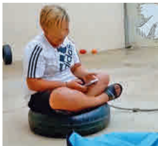
El menor que sufrió acoso en Baleares

EL PERIÓDICO GENTE NO SE RESPONSABILIZA NI SE IDENTIFICA CON LAS OPINIONES QUE SUS LECTORES Y COLABORADORES EXPONGAN EN SUS CARTAS Y ARTÍCULOS