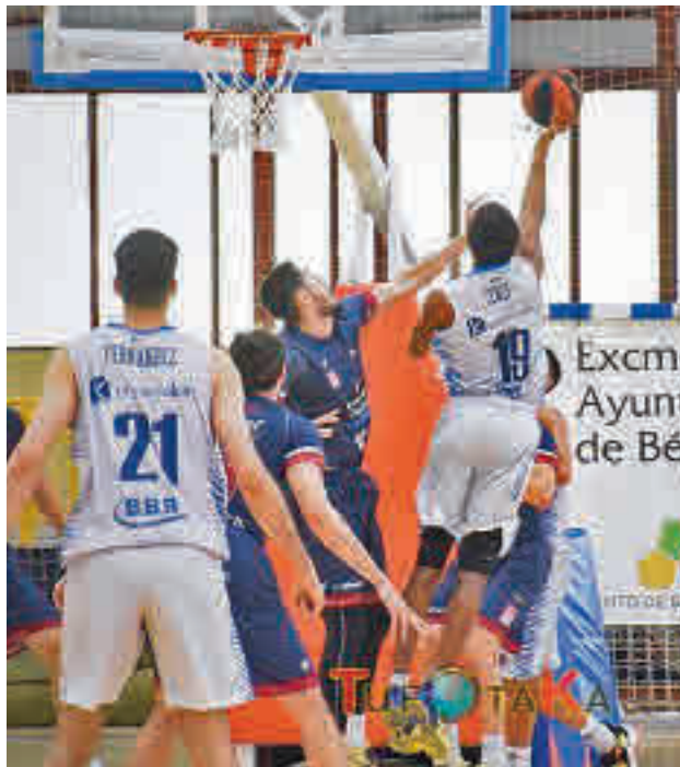
El Carplus Fuenlabrada derrotó al Monbus Obradoiro

Aunque buena parte de la atención la copa el Eurobasket que se está celebrando estas semanas en Georgia, Alemania, Italia y República Checa, los equipos nacionales continúan adelante con su pretemporada, un periodo del año en el que los entrenamientos se compaginan con partidos de preparación. Toca ir afinando la