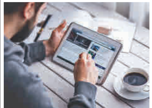
Los interesados podrán participar en un máximo de 3 cursos

El 21 de septiembre se publicarán las listas provisionales y se abrirá el plazo de subsanación de posibles errores hasta el 23 de septiembre. El curso dará comienzo el 4 de octubre.