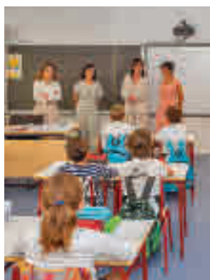
Visita a un colegio

Se incluyen los gastos realizados entre el 1 de julio y el 30 de septiembre en papelería, libros de texto, lecturas recomendadas, diccionarios, material informático fungi-