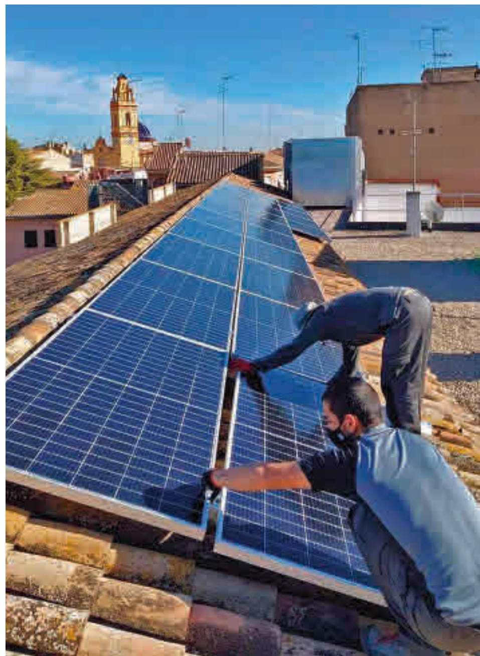
Instalación de paneles solares sobre una vivienda

bo energético. La comprobación del excedente se realiza mediante una lectura de contadores de la distribuidora que, tras este paso, informa a la comercializadora de la cantidad de electricidad producida sin consumir para que