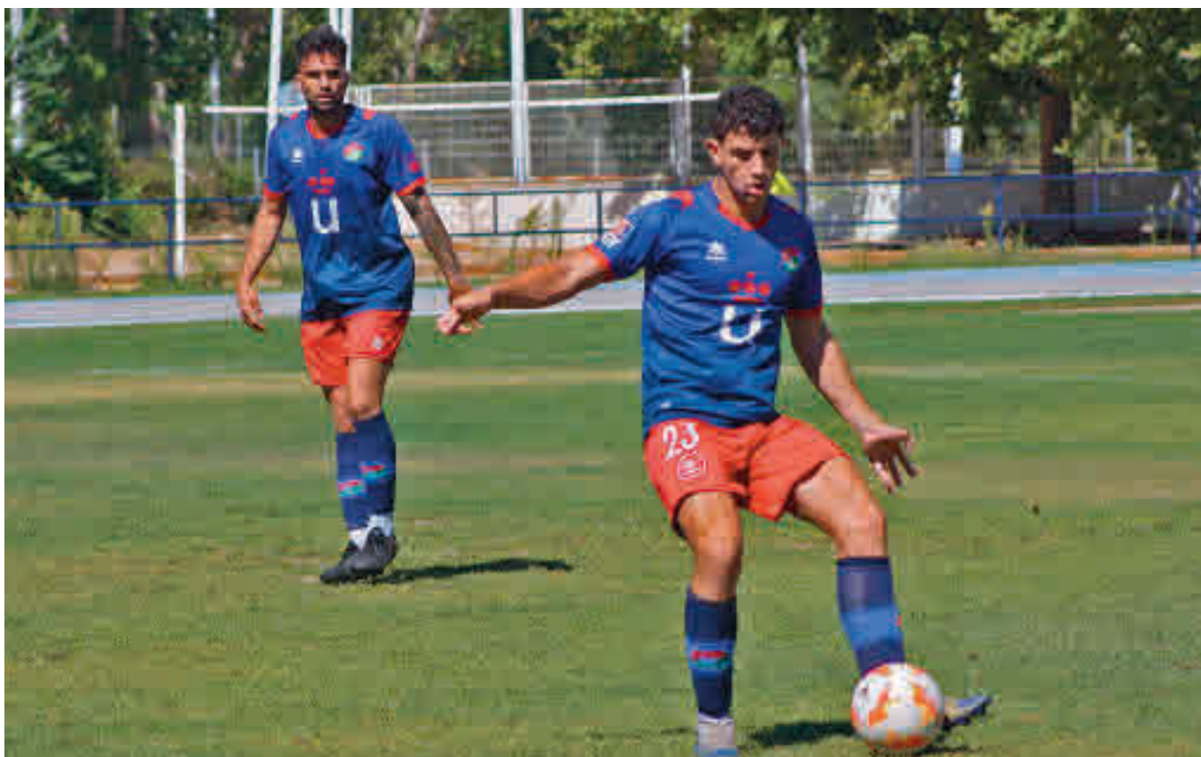
El CD Móstoles URJC, protagonista en los prolegómenos del campeonato CD MÓSTOLES