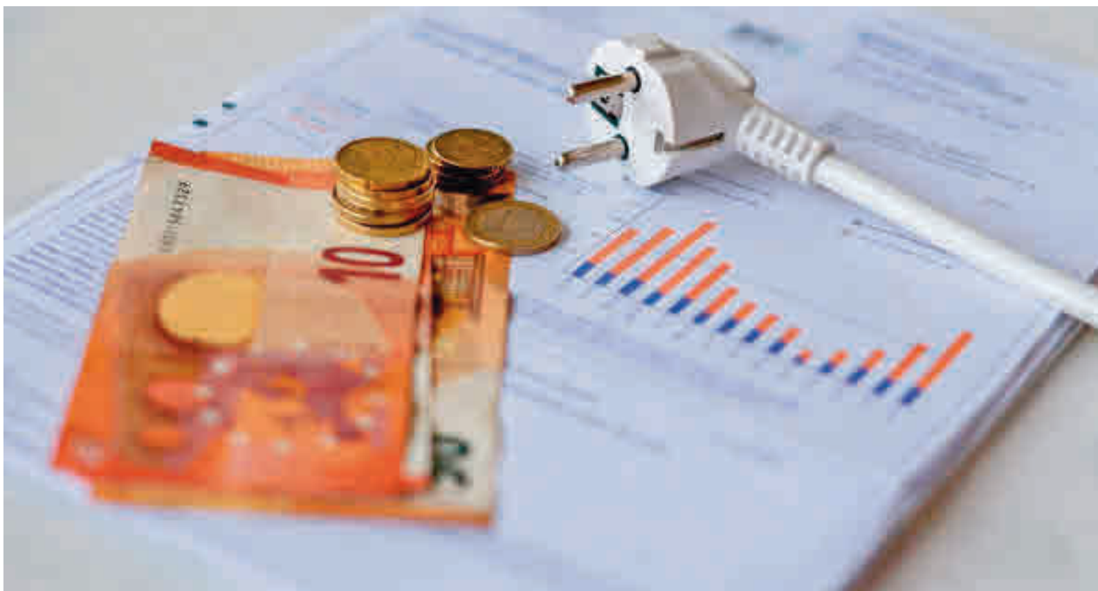
Las familias se preparan para un otoño que se prevé delicado en lo económico