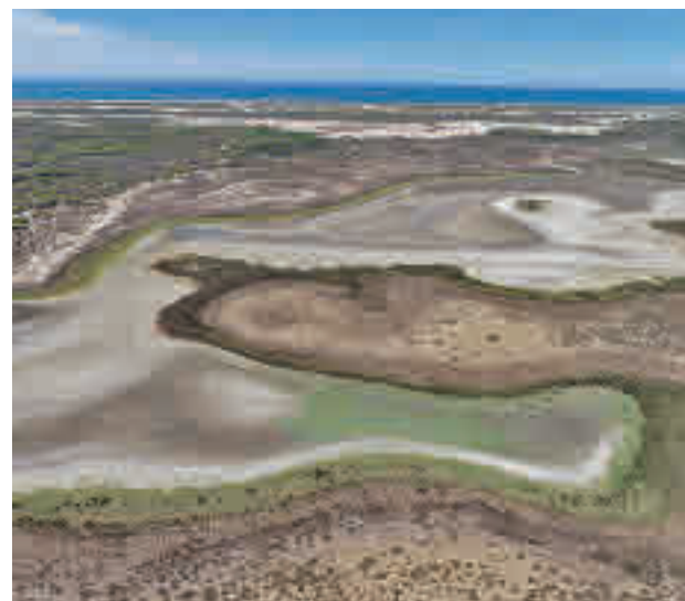
Vista aérea de la laguna seca de Santa Olalla CSIC

mente intensa" en la Península Ibérica, "está haciendo estragos en el espacio natural", pero avisan de que "lo más preocupante es que esto viene de lejos". "Hace ya años que no llueve de manera normal. Doñana lleva diez años consecutivos con niveles de precipitación inferiores a la media", comenta el director de la Estación Biológica de Doñana-CSIC, Eloy Revilla. Las zonas húmedas y las especies que dependen de ellas, como las aves acuáticas, se ven "especialmente afectadas" y se ven "obligadas a desplazarse en busca de las áreas que mantienen agua disponi-