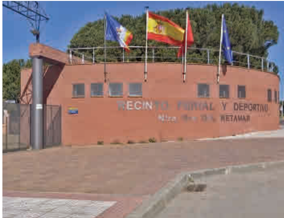
El Recinto Ferial albergará el Festibike

La última etapa de La Vuelta realizará este domingo 11 la primera parte de su recorrido por diferentes zonas de Las Rozas antes de encarar Maja-