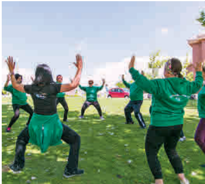
Una de las actividades de años anteriores

Desde el Consistorio explican que, finalizado el plazo para antiguos alumnos, aún quedan algunas plazas disponibles en distintos horarios en las actividades de zumba, gimnasia aeróbica,