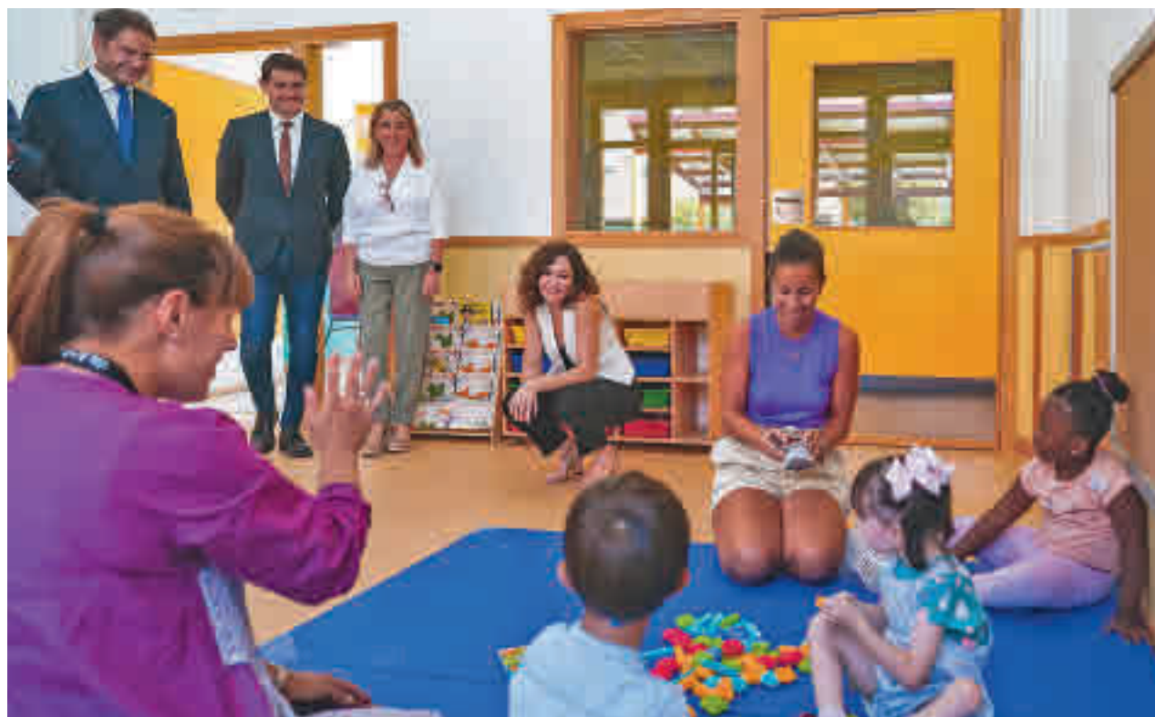
Apertura del curso escolar en la Comunidad de Madrid

La presidenta de la Comunidad se mostró abierta a debatir un posible adelanto del inicio de las clases al 1 de septiembre, como piden algunos padres. “Las familias necesitan colaboración teniendo en cuenta que las más afortunadas llegan a tener 20 días de vacaciones”, señaló Ayuso, que pidió que este asunto se trate “de manera pausada”.