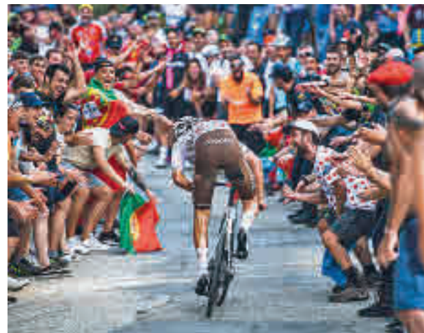
La Vuelta está teniendo una gran afluencia de público

Sin embargo, esta no será la única etapa de la que podrá disfrutar el público madrileño. En la jornada anterior, la del sábado 10, se vivirá una etapa de montaña que promete regalar grandes emo-