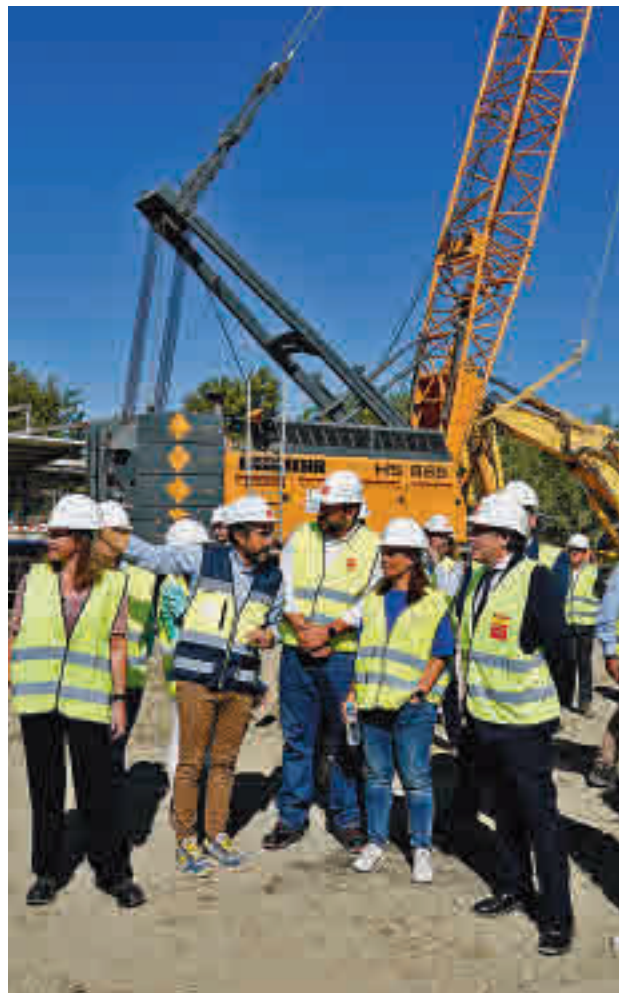
Visita a las obras de ampliación de la Línea 3

Pérez visitó el estado de las obras que supondrán la conexión de la Línea 3 con la Línea 12 de MetroSur a través de El Casar, "lo que permitirá que todos los vecinos de la zona sur de Madrid puedan acceder no solo por Alcorcón, como hasta ahora, sino