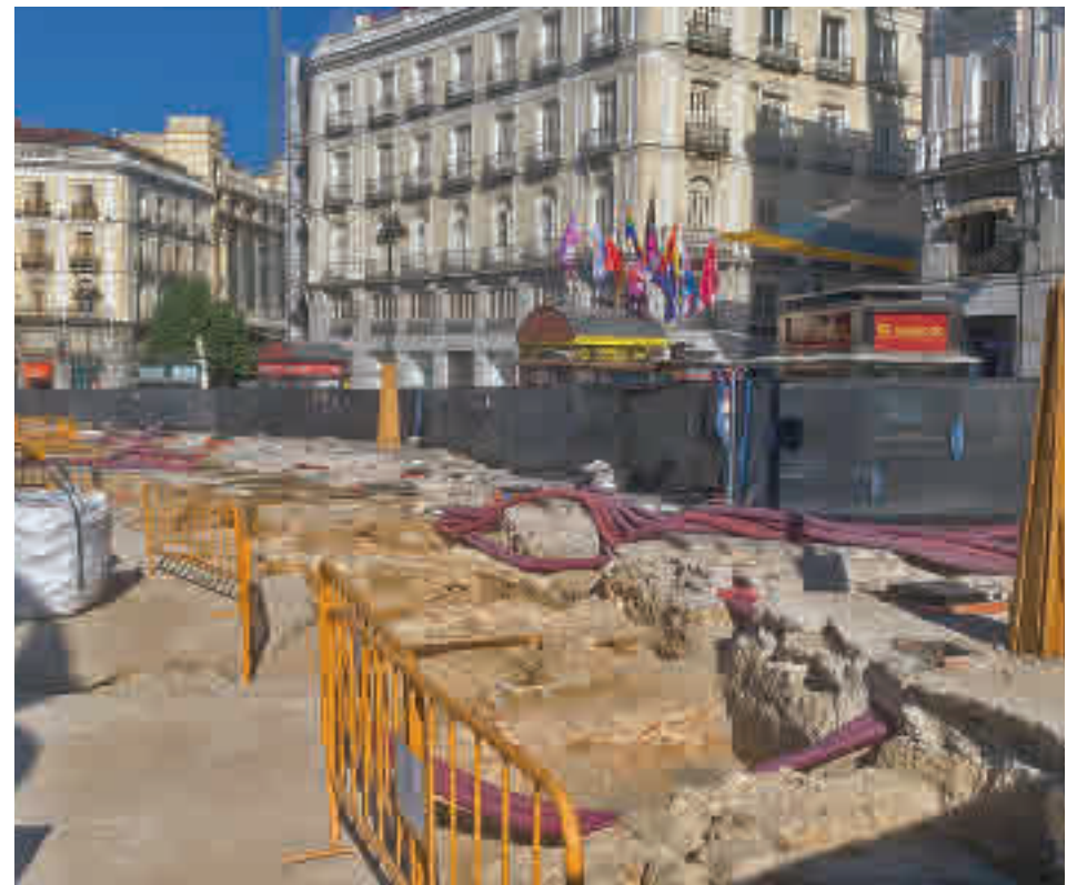
Los trabajos de remodelación de la Puerta del Sol @MADRID_SECRETO

Por otro lado, está muy avanzado el adoquinado en la calle del Carmen en su intersección con Tetuán y tam-