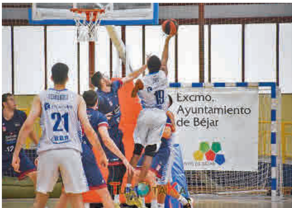
El Carplus Fuenlabrada derrotó al Monbus Obradoiro el pasado fin de semana