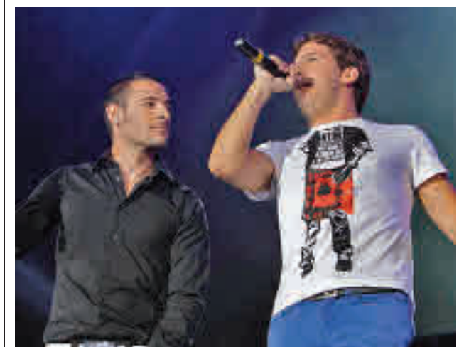
Andy y Lucas actuarán en Valdemoro

La Policía Local de Valdemoro ha detenido a un individuo que estaba robando los cables eléctricos de una instalación deportiva.