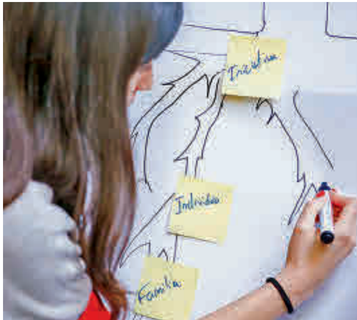
Una de las participantes en la edición del año pasado

Fuentes municipales explican que esta iniciativa no