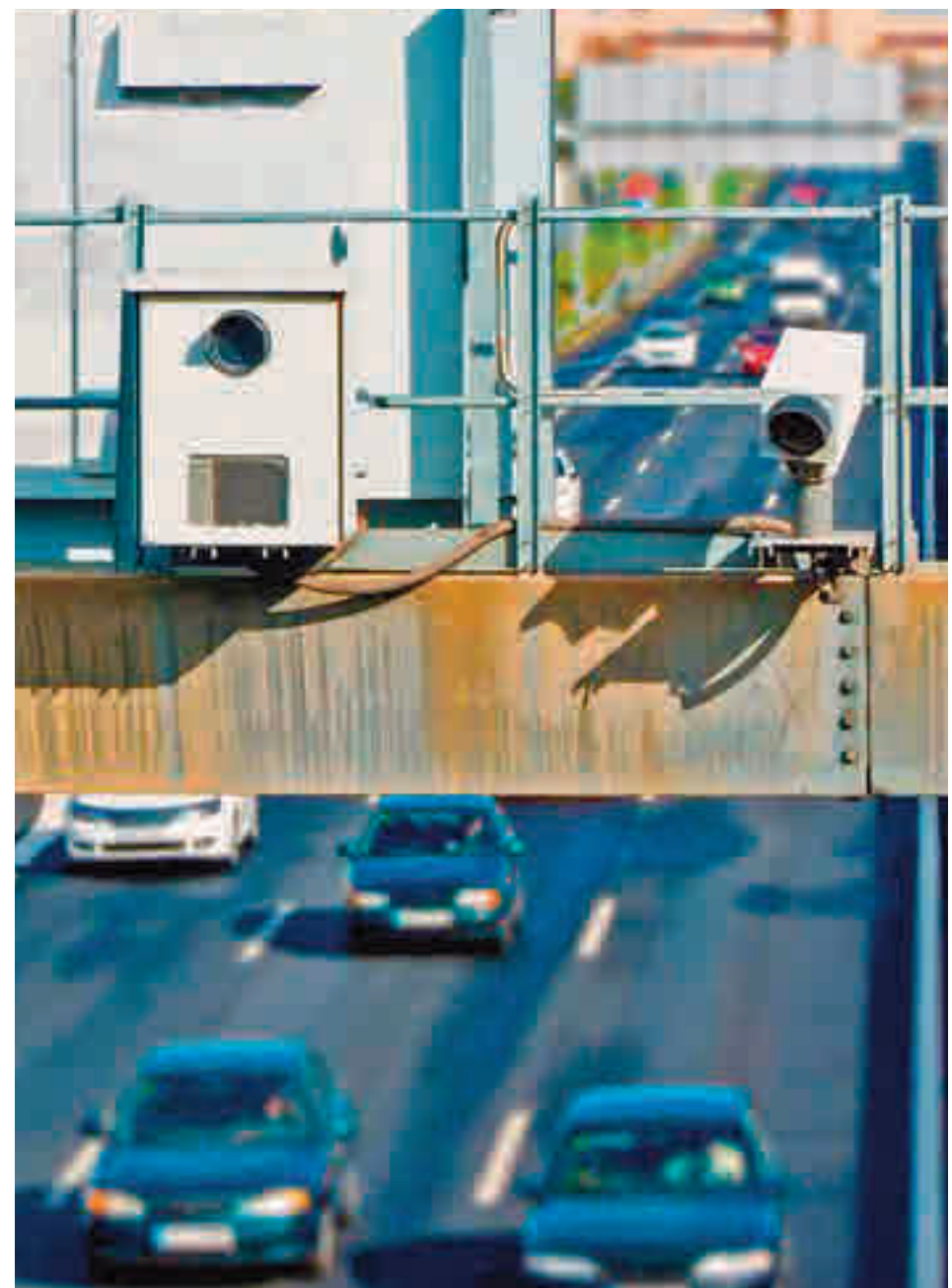
Un radar controla la velocidad de los vehículos

desconocimiento de los límites es mayoritario, ya que tan sólo el 6% de los encuestados afirma conocerlos.