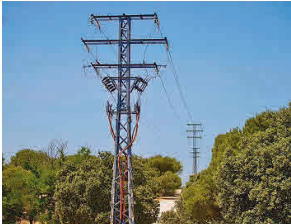
Tendido eléctrico en la Dehesa de Navalcarbón

El objetivo de la intervención es reducir de forma radical el impacto ambiental de la instalación, ubicada en una zona natural, al tiempo que se minimiza la peligrosidad de la actual línea expuesta, tanto desde el punto de vista de seguridad frente a incendios como desde el impacto sobre la fauna del entorno natural e incluso para las personas. Además, se aprovechará la realización de la nueva canalización para extender fibra