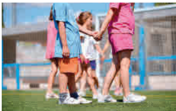
Colonias deportivas de Boadilla

Las colonias deportivas se pueden disfrutar hasta la primera semana de septiembre.