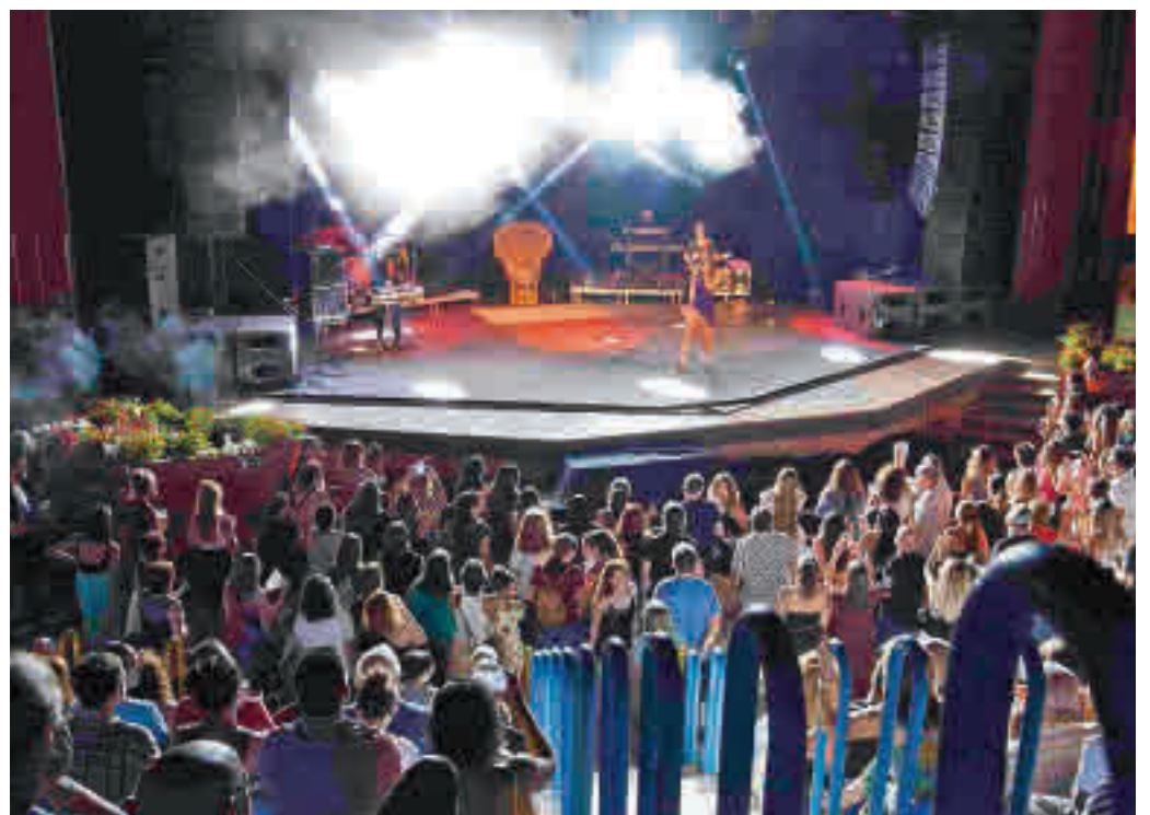
Teatro Egaleo de Leganés

ha decidido suspender el ciclo y ha manifestado su intención de que se pueda celebrar en septiembre. Para este fin de semana estaban previstas las actuaciones de Danza Invisible y Tennessee (viernes 15) y el Tributo a El