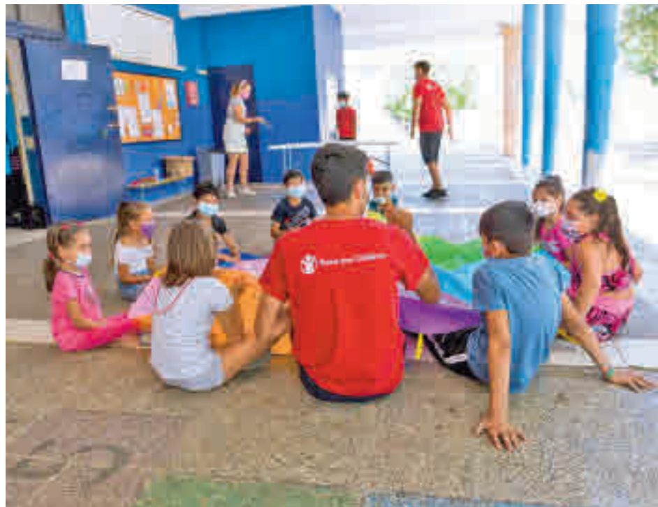
Campamentos de verano de Save the Children

“Nuestros programas de verano dirigidos a los niños y niñas con menos recursos cuentan con actividades de todo tipo: salidas culturales,