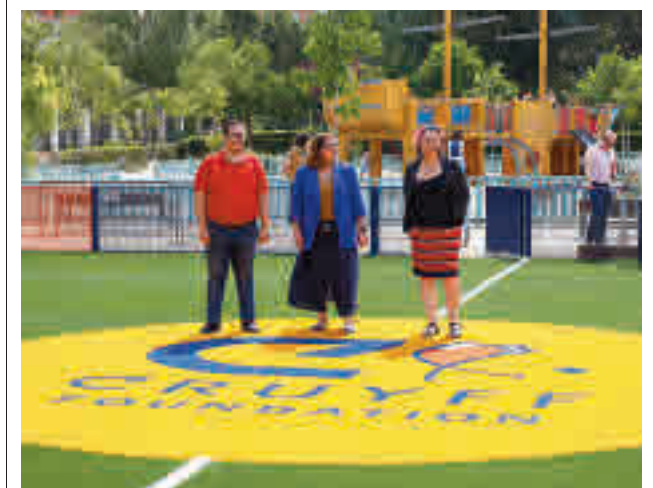
Nuevo campo de fútbol

El colegio valdemoreño Pedro Antonio de Alarcón es uno de los escogidos para albergar aulas de niños de 0 a 3 años el curso que viene.