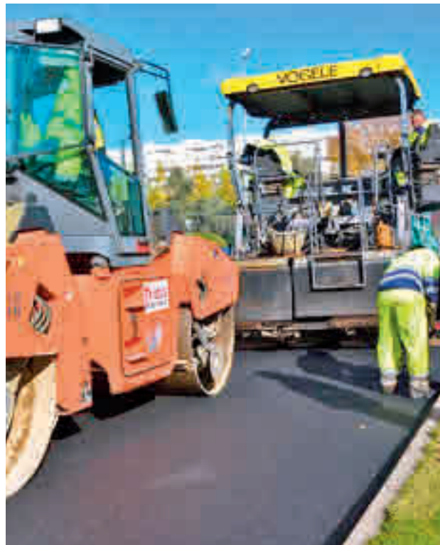
La avería se ha detectado durante el Plan de Asfaltado

Esta actuación tendrá una duración aproximada de dos meses, lo que afectará al tráfico en dicha vía, dado que “será necesario realizar di-