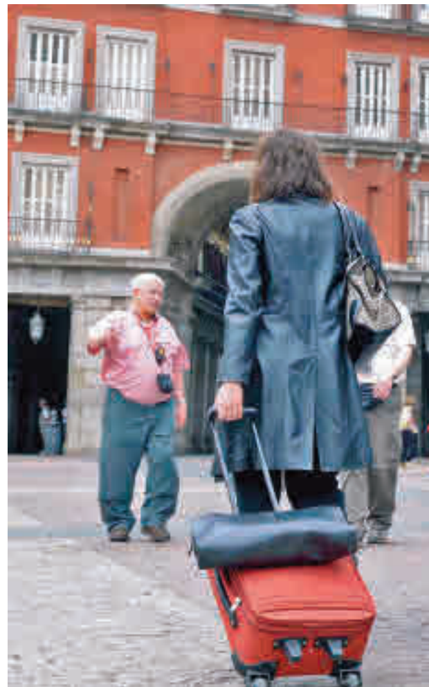
Dos turistas recorren con sus maletas la Plaza Mayor

Por otro lado, el carrito de información turística móvil