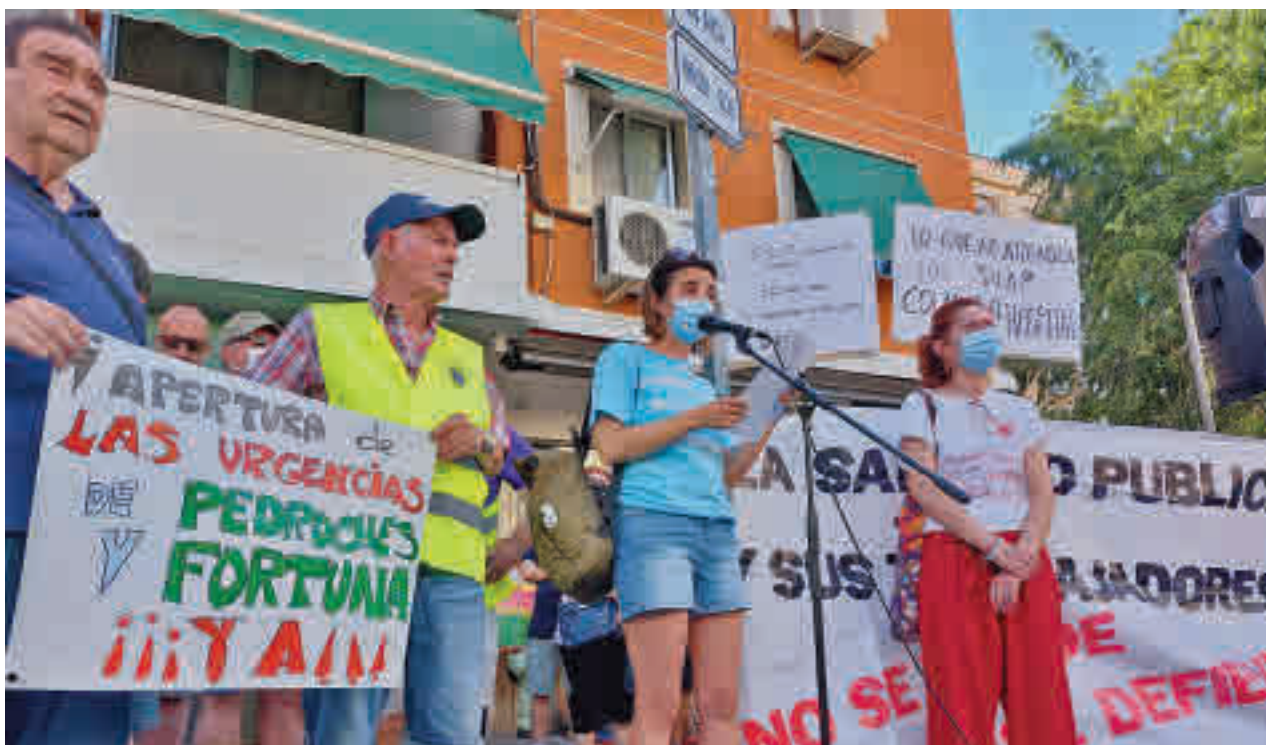
Los vecinos de Leganés se movilizaron contra el cierre de las urgencias