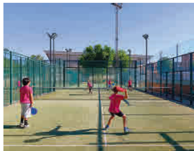
Colonias deportivas de Leganés

En este programa está incluida la comida diaria y todas las actividades deportivas, piscina y tiempo de ocio. Los jóvenes asisten desde las 9 horas de lunes a viernes a