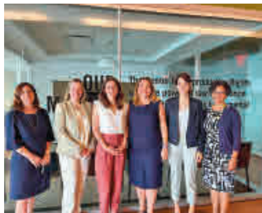
La ministra de Igualdad, en su visita a EEUU

EL PERIÓDICO GENTE NO SE RESPONSABILIZA NI SE IDENTIFICA CON LAS OPINIONES QUE SUS LECTORES Y COLABORADORES EXPONGAN EN SUS CARTAS Y ARTÍCULOS