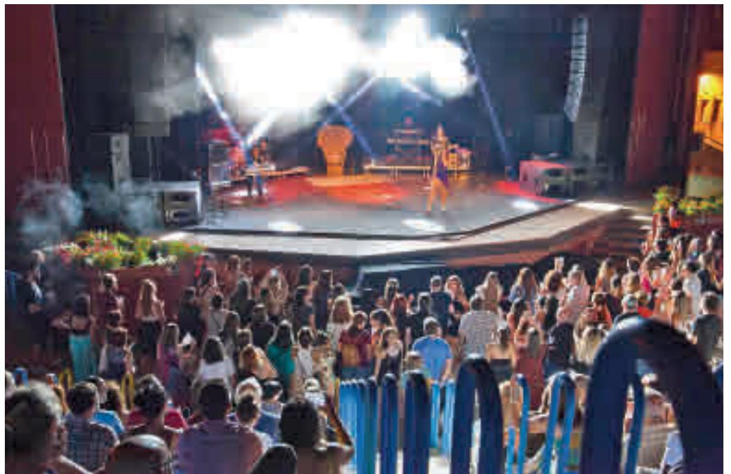
Actuaciones en el Teatro Egaleo de Leganés