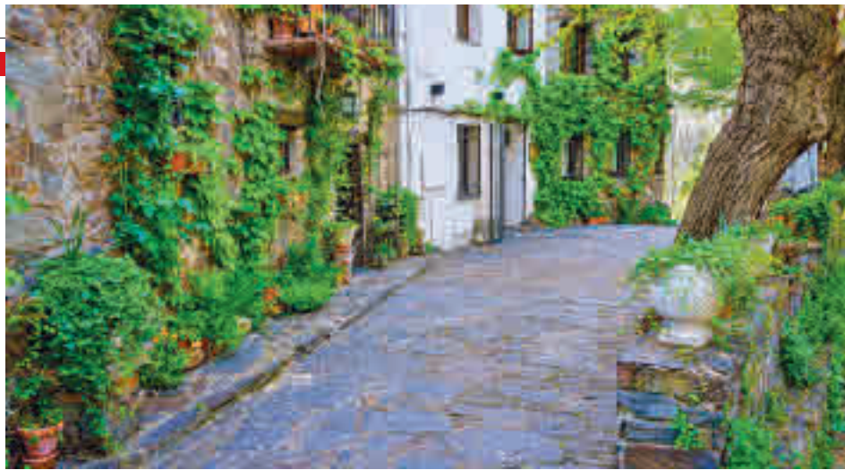
Madrid quiere promocionar el turismo rural