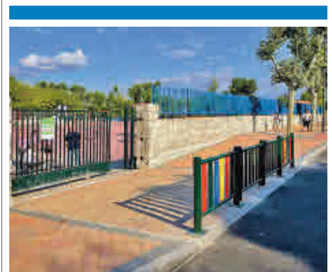
Vallado en la puerta del colegio

Desde el Gobierno municipal se justifica este rechazo por considerarse propuestas supramunicipales, al tiempo que lamenta que estos grupos municipales se "desmarquen de la petición del Ayuntamiento de que el Gobierno garantice un proceso transparente" en el proceso de adjudicación de la futura sede de la Agencia Espacial Española.