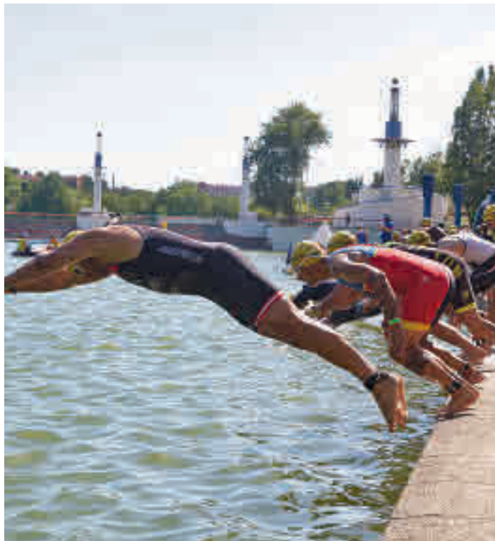
La Du&Tri Cup se celebra este domingo 10

De forma paralela, el séptimo arte se convierte en una buena alternativa para disfrutar del ocio, de la mano del cine de verano, instalado en la Plaza de la Familia. Allí se