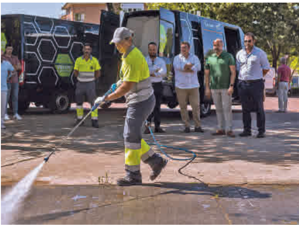
Presentación de las hidrolimpiadoras de agua caliente y fría