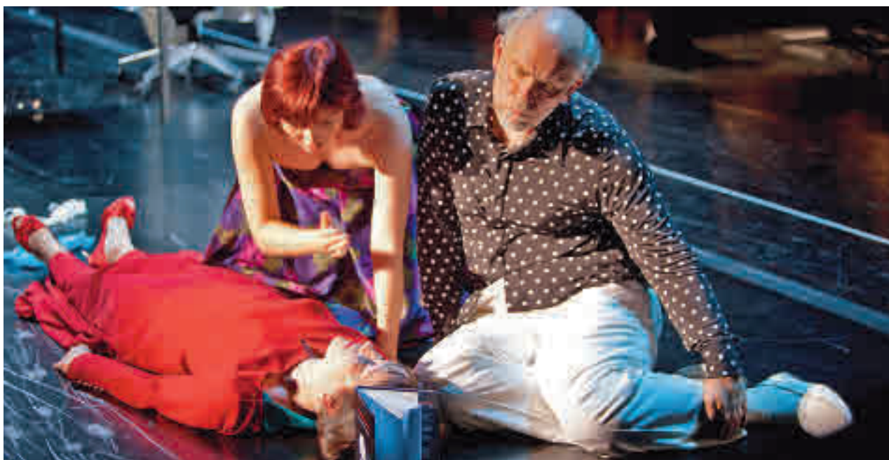
John Malkovich representará 'Confesiones de un asesino en serie' los días 11 y 12 de agosto en Conde Duque

» Sábado 9, 22 horas. Lago del Parque Central. Concierto gratuito.