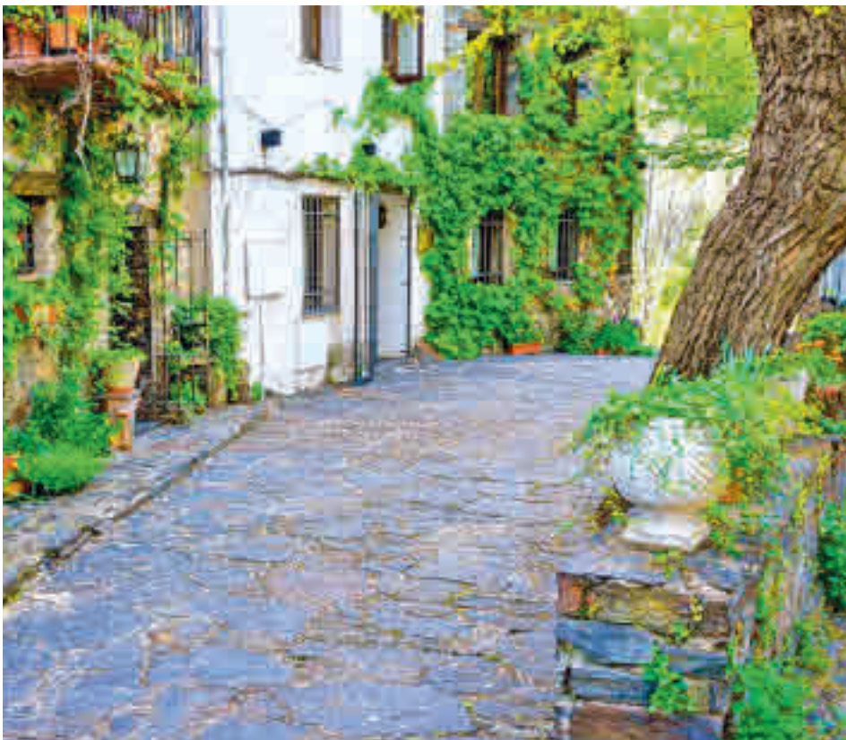
Madrid quiere promocionar el turismo rural