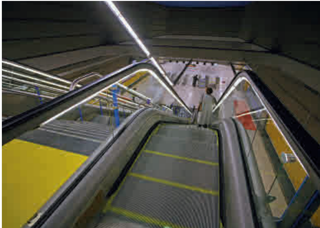
La línea 11 empieza su periodo de expansión

EL NUEVO EJE DE MOVILIDAD CONECTARÁ CUATRO VIENTOS CON VALDEBEBAS