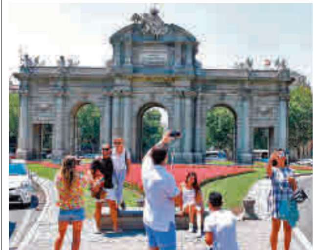
Turistas en el centro de Madrid

Por número de visitantes, Madrid fue la sexta región de España, con el 8,2% del total de los turistas nacionales.