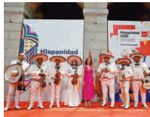
La presidenta en el acto de presentación del evento

"Ha empezado un tiempo nuevo, lo demuestra la alegría recobrada. El éxito de todo lo hispano en el mundo, que está, como Madrid, más de moda que nunca", afirmó.