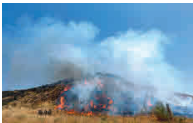
Incendio de Aranjuez

su paso por el término municipal de Aranjuez. Las llamas se extendieron rápidamente por una zona forestal hasta llegar muy cerca de una urbanización de viviendas y de un polígono industrial, donde los Bomberos pudieron detener su avance. En la mañana del miércoles se dio el in-