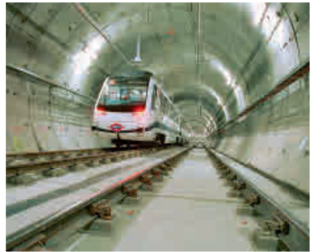
La Línea 11 llegará hasta Conde de Casal