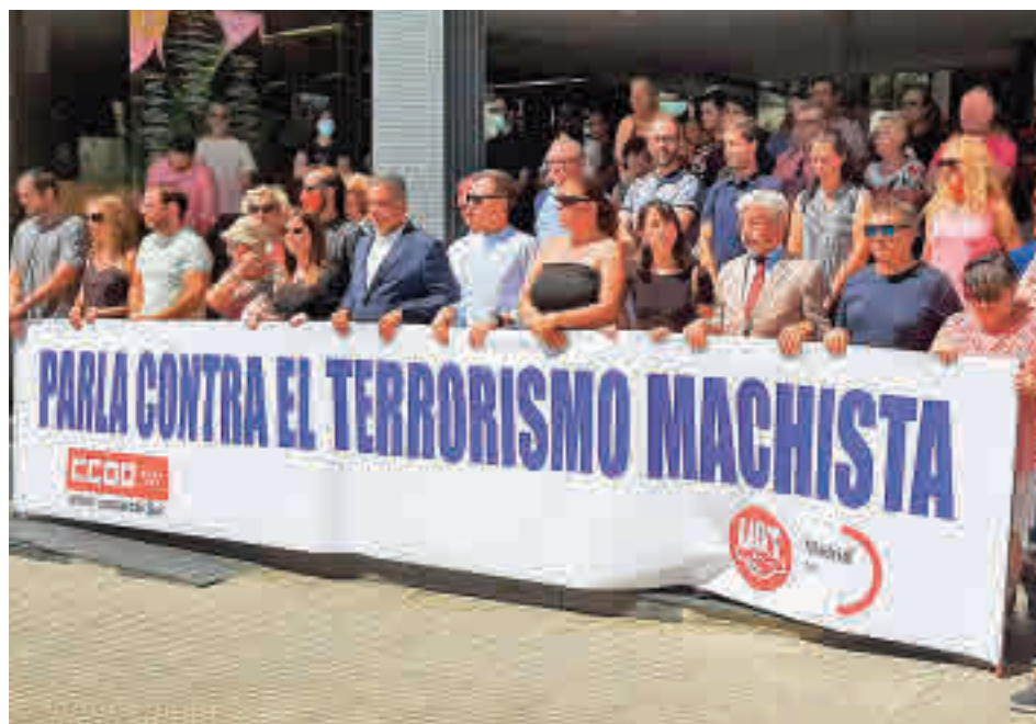
Concentración de repulsa por el asesinato machista en Parla

Este lunes se convocó una nueva concentración en las puertas del Ayuntamiento en la que se insistió en que “la educación, la concienciación y la colaboración ciudadana