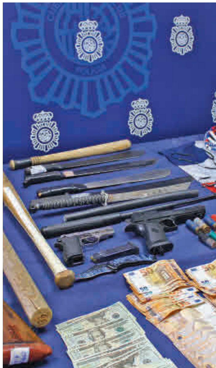
Además de dinero también se han incautado numerosas armas

Una operación se ha saldado con 66 detenidos, tras realizar registros en la capital, Getafe y Pozuelo • Buena parte de ellos eran unos hackers que actuaban como aparato de financiación