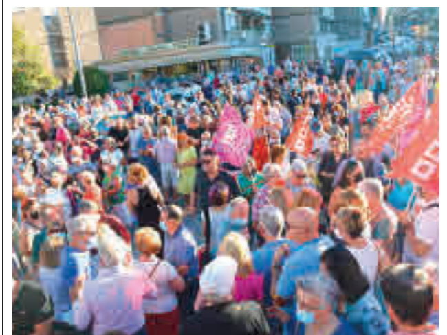
Protesta por el cierre de los SUAP

El alcalde de Pinto y el secretario general del PSM reclamaron este martes el tercer centro de salud para la localidad.