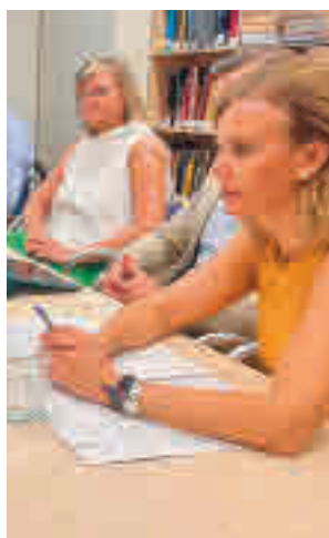
Firma del acuerdo

Las acciones se centrarán, principalmente, en el segmento MICE (turismo de congresos y reuniones), la gastronomía, el turismo 'premium' (lujo) y el turismo cul-