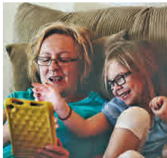
Hay que usar las pantallas en familia