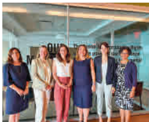
La ministra de Igualdad, en su visita a EEUU

EL PERIÓDICO GENTE NO SE RESPONSABILIZA NI SE IDENTIFICA CON LAS OPINIONES QUE SUS LECTORES Y COLABORADORES EXPONGAN EN SUS CARTAS Y ARTÍCULOS