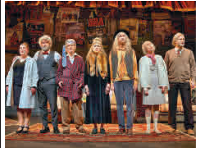
La obra está ambientada en un geriátrico

Con el respaldo de crítica y público, Los Estanques y Anni B Sweet ya miran al futuro: "Estaría bien seguir adelante, sobre todo si sigue siendo así de bonito", rematan.