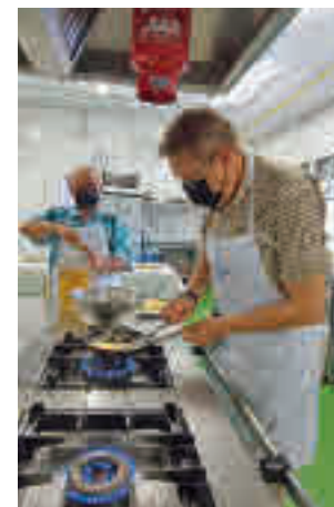
Academia Mayor Chef

La iniciativa se enmarca en la oferta de actividades y talleres en los centros municipales de mayores de cara al próximo curso, que contará con una oferta de más de 180 talleres gratuitos. Se amplía así el volumen de talleres que el Consistorio oferta de forma gratuita a los mayores de la localidad. En el año 2019 el programa incorporaba 150 iniciativas, cerca de 30 menos