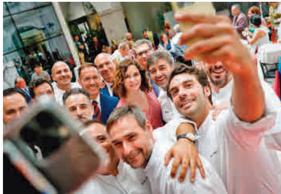
Acto de promoción del libro 'A pedir de vaca'

Ayuso lamentó que ahora esté decayendo la atención mediática en la isla y es cuando los habitantes "necesitan" más ayuda que nunca, después de que durante meses el volcán haya provocado "daños materiales devastadores".