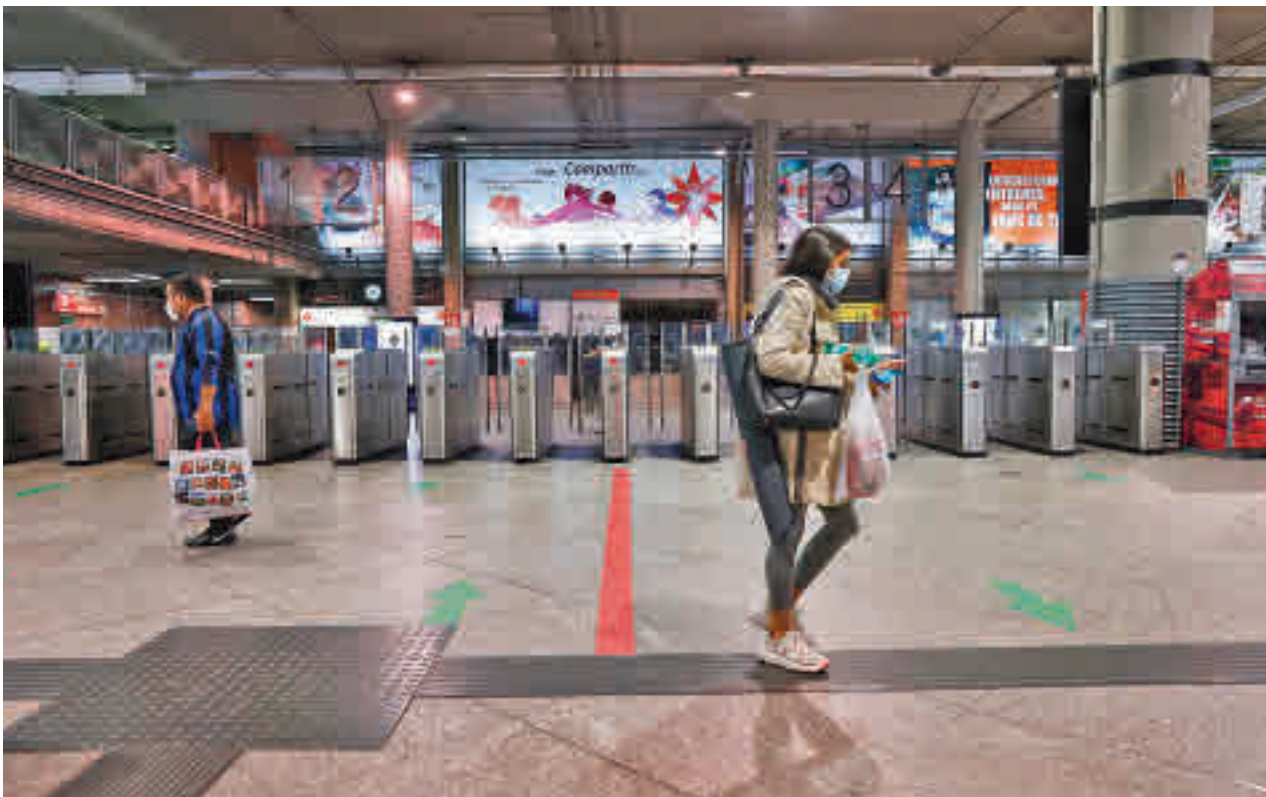
Transporte público en la Comunidad de Madrid