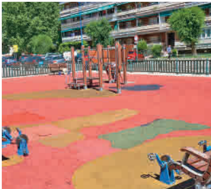
Una de las áreas en las que se actuará

El Ayuntamiento de Leganés destinará en los próximos meses una partida de un millón de euros para acondicionar y sustituir el pavimento de 47 zonas infantiles y 17 áreas biosaludables para personas mayores. Este cambio tendrá un coste de un millón de euros y estará terminado en un plazo de cuatro meses. Los espacios en los que se va a actuar se reparten en los ba-