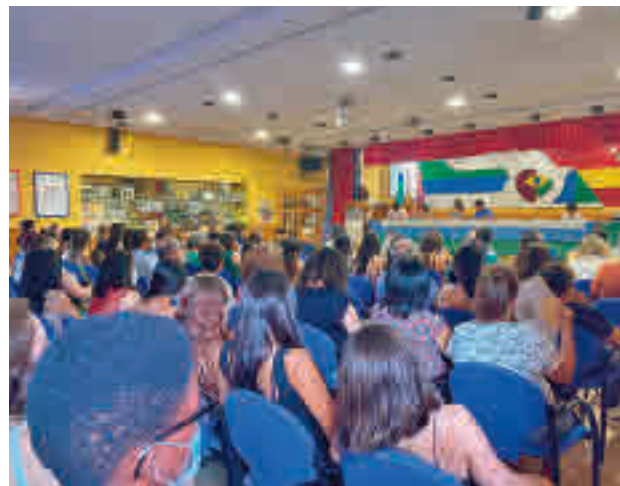
Asamblea Ciudadana de la CEMU

El joven protagonizó uno de los momentos emotivos del día tras anunciar que próximamente deberá dejar la alcaldía al haber conseguido un contrato laboral, fruto de su esfuerzo tras haber completado con éxito el Programa de autonomía desarrollado en la CEMU. A lo largo de la