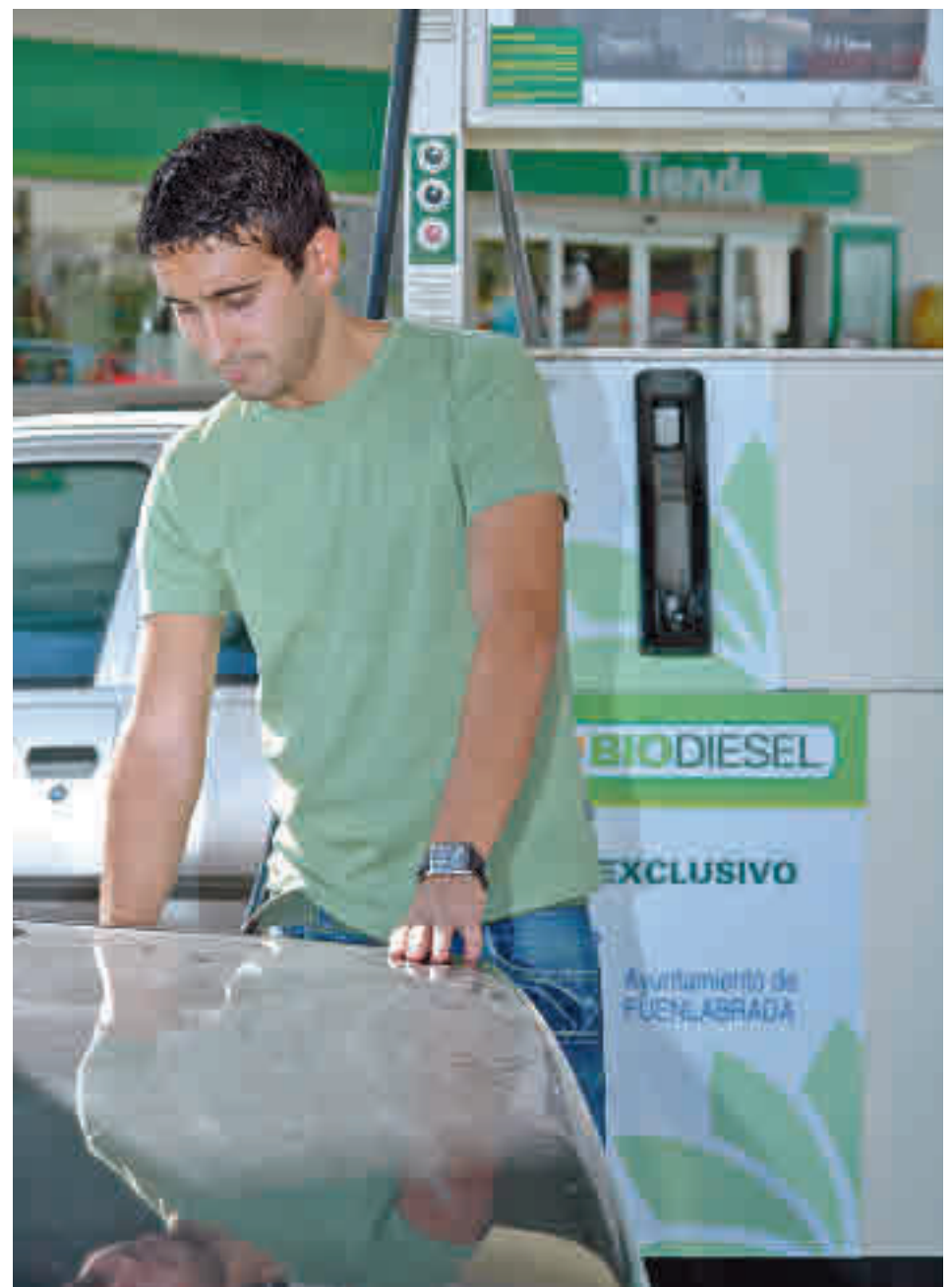
Una persona reposta en una estación de servicio

postar en gasolineras de marca para hacerlo en las de bajo coste. Esto podría suponer un ahorro de hasta 20 euros de gasóleo cada vez que se llena el depósito, y de hasta 13 euros en gasolina en lugares como Madrid.