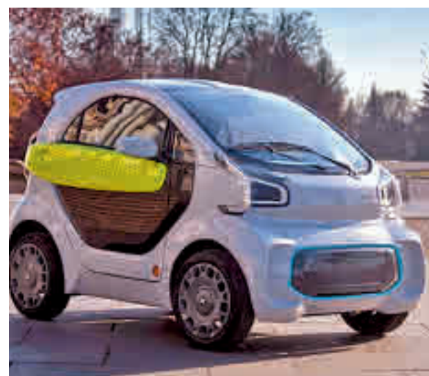
Exterior del modelo YOYO de la italiana XEV

puede cargar bien a una toma Mennekes o a una toma convencional de tipo Schuko. A diferencia de otros eléctricos, el coche italiano no ha adaptado sus baterías y motor a una plataforma ya existente, sino que ha sido diseñada de cero. Debido a su peso, ofrece un consumo declarado de un euro cada 100 kilómetros. Tiene una autonomía de 150 kilómetros y su velocidad máxima es de 90 kilómetros hora. Estas características le hacen ser un coche perfecto para la movilidad urbana sostenible. Además, una de sus mayores características es que sus tres baterías son extraíbles. Han