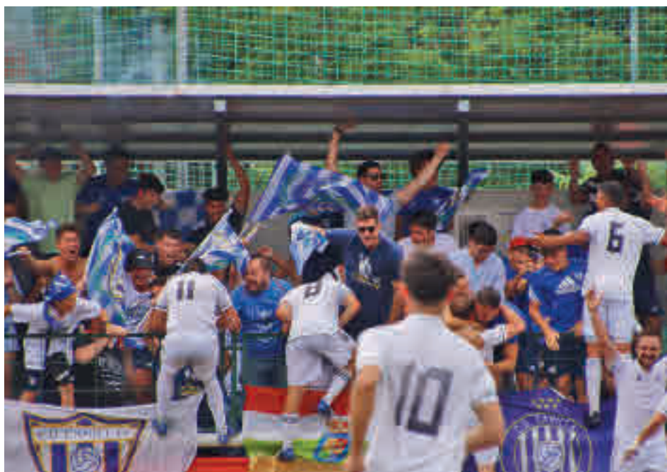
El Canillas vivió una jornada histórica con sus aficionados

Ese premio también se lo llevó en el Grupo 1 el Club Unión Collado Villalba, que hizo bueno el triunfo por 1-3