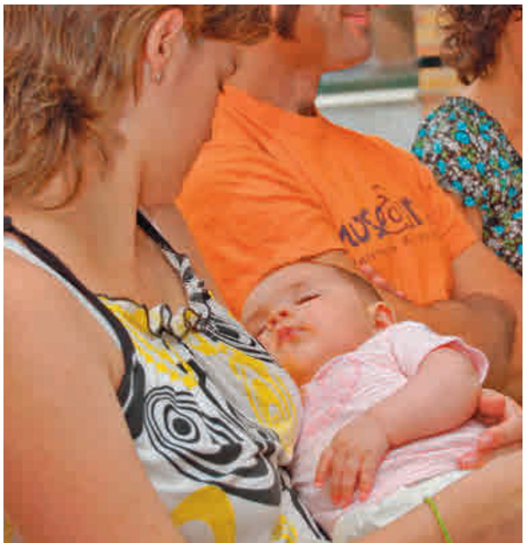
La crianza de los hijos se ha encarecido en los últimos años

Ayudas En comparación con otros países de la Unión Europea, desde Save The Children advierten de que las políticas españolas de apoyo a la crianza