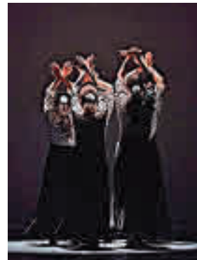
Línea y Movimiento

» Del viernes 17 al domingo 19. Precio: gratis, con invitación