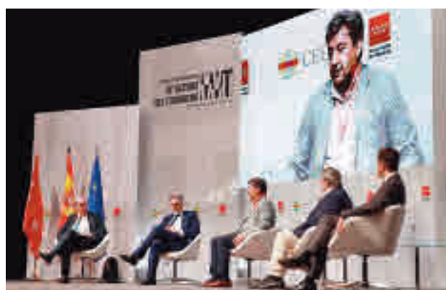
Congreso de Víctimas del Terrorismo

El Congreso Internacional de Víctimas del Terrorismo celebrado esta semana en Madrid ha pedido en sus conclusiones perfeccionar la primera intervención a las víctimas que sufran un atentado y darles un papel en la educa-