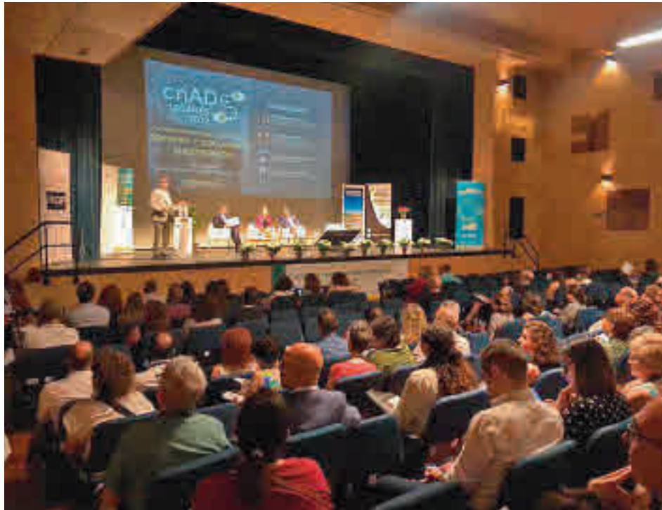
Inauguración del Congreso Nacional de Archivo y Documento Electrónico

Al ser el asunto de la ciberseguridad uno de los pilares del Congreso, el regidor ha asegurado que el Ayuntamiento conoce de cerca esta realidad debido al ciberataque que su-