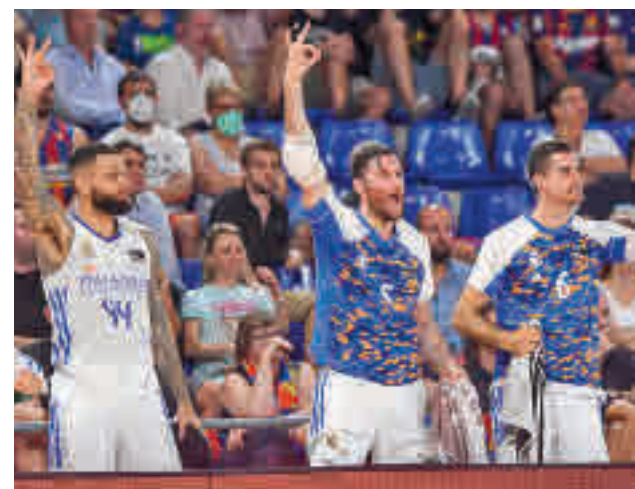
Los blancos dominaron con claridad el primer partido

asegurado, al menos, un cuarto partido. Este se jugará de nuevo en el WiZink Center, concretamente el domingo a partir de las 18 horas. Si alguno de los dos equipos es capaz de encadenar dos victorias habría campeón este domingo, aunque no es descabellado pensar que todo se resolverá en el quinto, que se jugaría el miércoles 22.