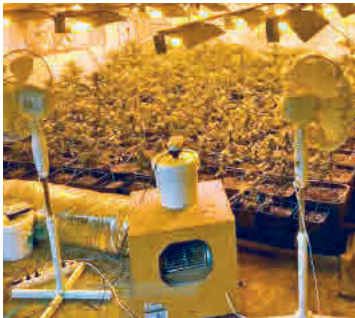
Plantación de marihuana en Leganés

La Policía Nacional han demantelado una plantación 'indoor' en una nave industrial de Leganés con casi 600 plantas de marihuana y ha detenido a dos hombres. La investigación comenzó cuando los agentes tuvieron conocimiento de que en el Polígono de San José de Valde- ras se podía estar desarrollando una actividad ilícita destinada a la producción y