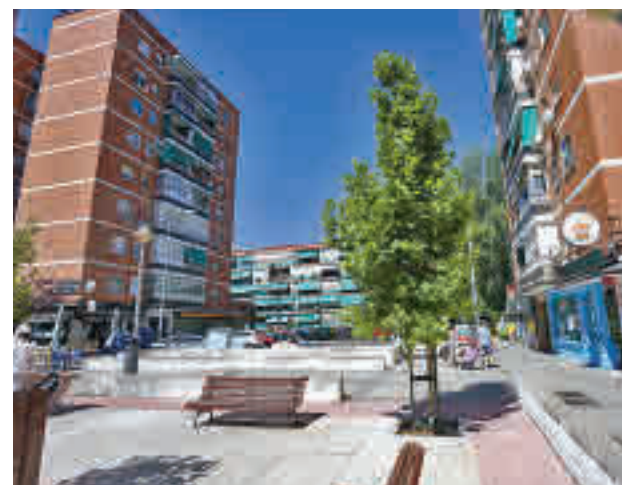
Estado actual de la plaza

También se eliminarán las barreras arquitectónicas que actualmente presenta el espacio y se crearán los viales de acceso para vehículos de emergencias. De esta forma vehículos de extinción de incendios y emergencias podrán acceder a la plaza direc-