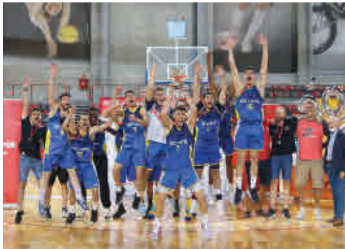
El CB Getafe celebró por todo lo alto su título de campeón FBM

Después de superar en octavos de final al Innova-tsn Leganés y en cuartos al Jofe-