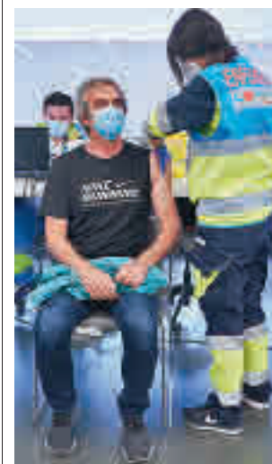
Vacunación en el Zendal

DURANTE EL AÑO PASADO ARDIERON CASI 500 HECTÁREAS FORESTALES