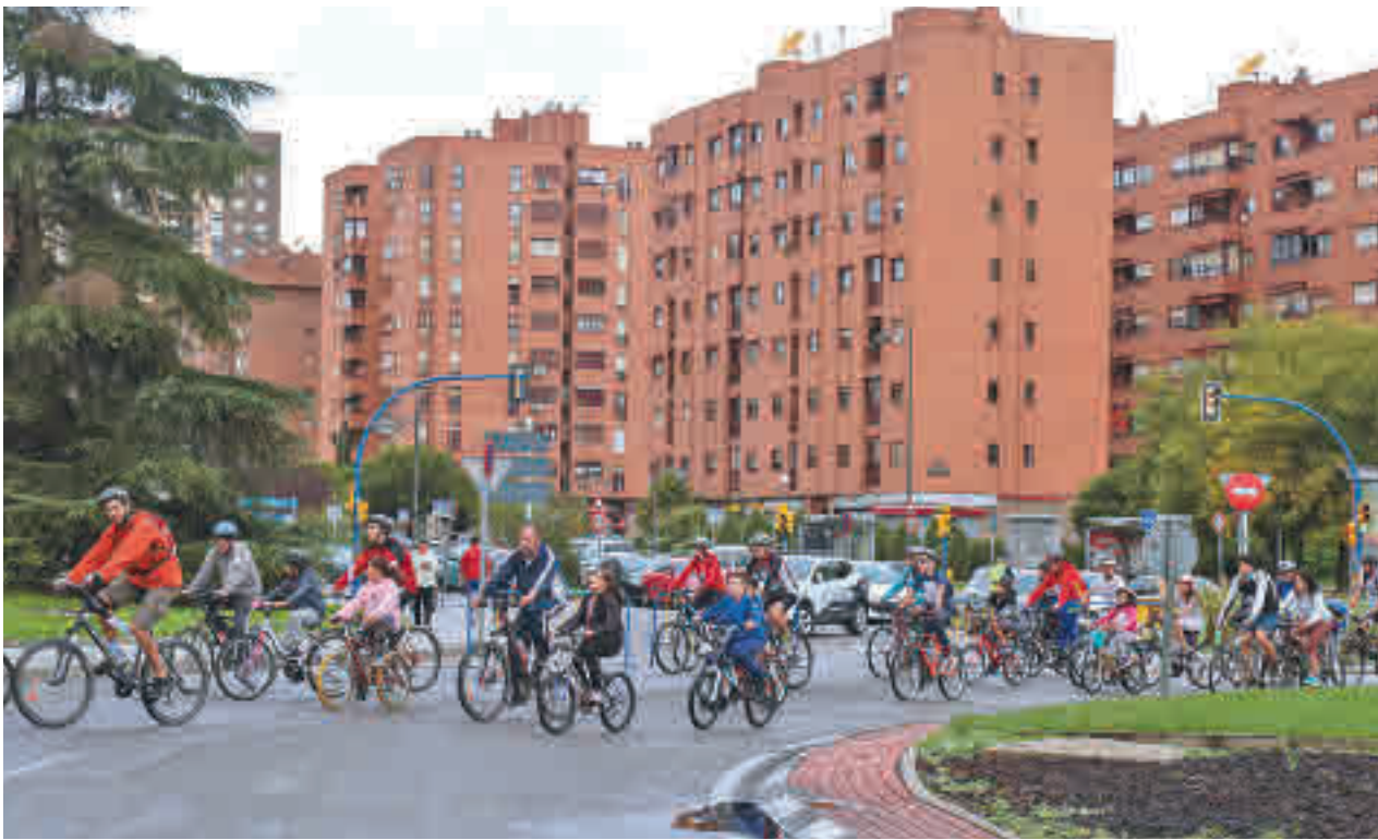
Los carriles bici serán uno de los beneficiados por las nuevas inversiones