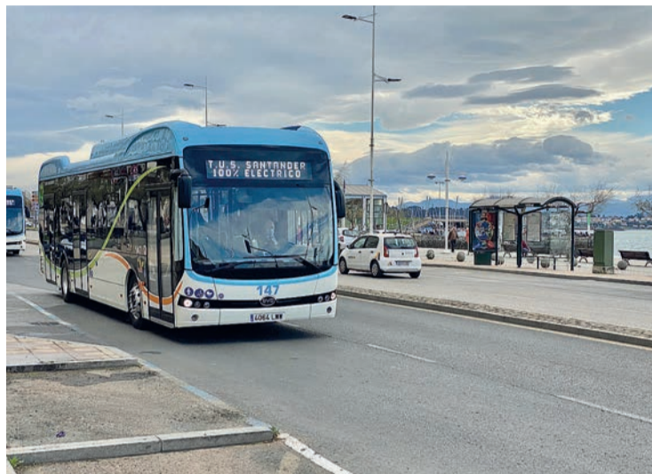
Uno de los autobuses eléctricos adquiridos por el Ayuntamiento a BYD EUROPE B.V.

judicataria, se ha visto inmersa en varios conflictos en Estados Unidos debido a la baja calidad de sus vehículos.