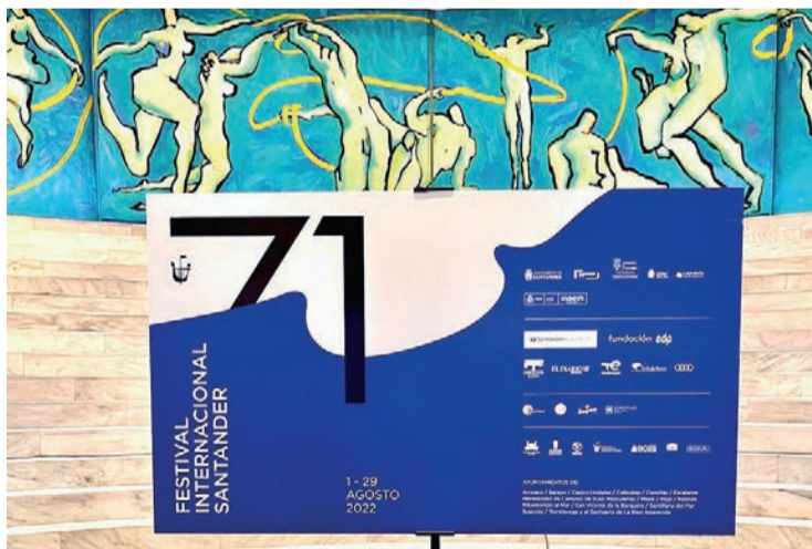
El FIS se celebrará del 1 al 29 de agosto.

tendrá lugar en el Palacio de Festivales. El público podrá adquirir desde el 1 de julio localidades para todos los espectáculos programados en el Palacio de Festivales. Los canales de venta serán los mismos que los de los abonos.