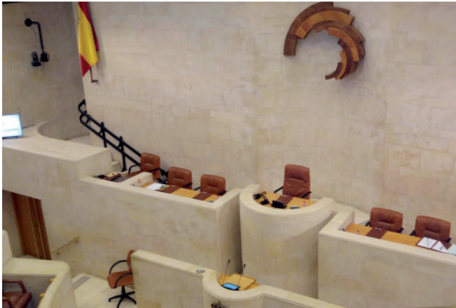
A ya menos de un año para las elecciones municipales y autonómicas, ya se van perfilando las tendencias de voto.

El resto de encuestas internas consultadas plantean un mismo escenario de cuatro partidos políticos ocupando el hemiciclo de la calle Alta, pero discrepan en quién será el que 'se lleve el gato al agua'. Mientras en una se da un empate técnico entre el PRC y el PP, con 12 diputados cada uno, en otra sería