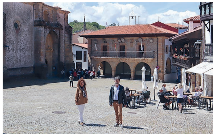
Presentación campaña vale de compras de Comillas.