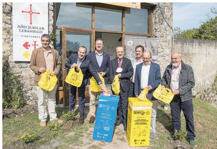
El Gobierno y Ecoembes colaboran en la campaña 'Camino del Reciclaje'.

Bajo el eslogan 'Que el camino deje huella en ti. No tú en él', la iniciativa repartirá más de 4.200 bolsas reutilizables, realizadas con PET reciclado, en los 42 albergues cántabros que han sido especialmente equipados para potenciar la concienciación medioambiental, fomentar el reciclaje y la lucha contra la 'basuraleza' entre los caminantes. Los consejeros de Medio Ambien-