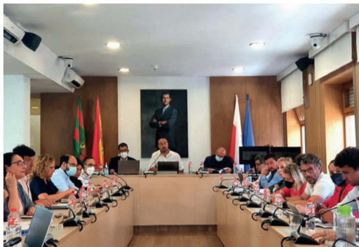
Un momento de la reunión plenaria del martes.

Y aunque estos contaron con más apoyo por parte de la Corporación, la ordenanza que regulará la ERA solo salió adelante con los votos del equipo de gobierno PRC-PSOE, mientras que PP y Ciudadanos (Cs) se abstuvieron ya que creen que el número de plazas es insuficiente o que el modelo elegido no es la solu-