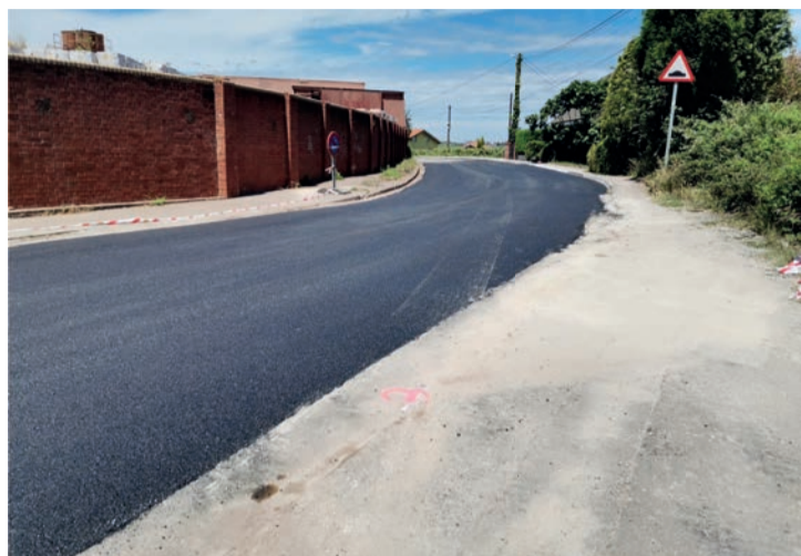
Asfaltado en la calle Los Coteros.

Con estos trabajos se completa la actuación realizada en esta zona, mejorando la capa de rodadura del vial una vez finalizados los trabajos acometidos previamente allí para