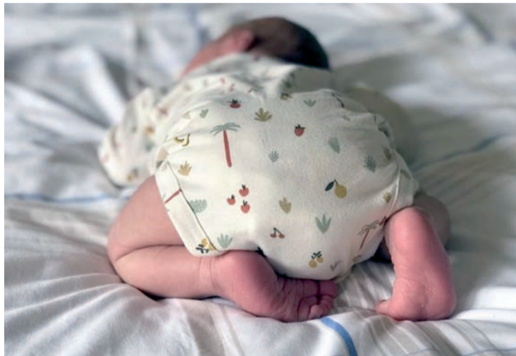
La imagen de un bebé recién nacido.

Según los datos publicados por el Instituto Nacional de Estadística