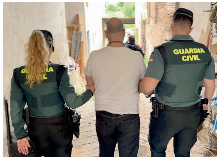
El sospechoso, escoltado por dos agentes de la Guardia Civil.