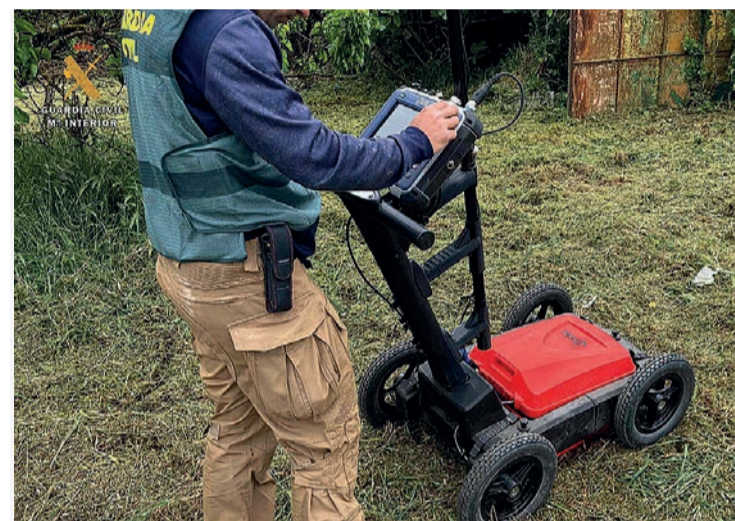
Las labores de trabajo del georradar en Entrena.

EDUCACIÓN | El modelo de financiación será bienal, entre 2022 y 2023