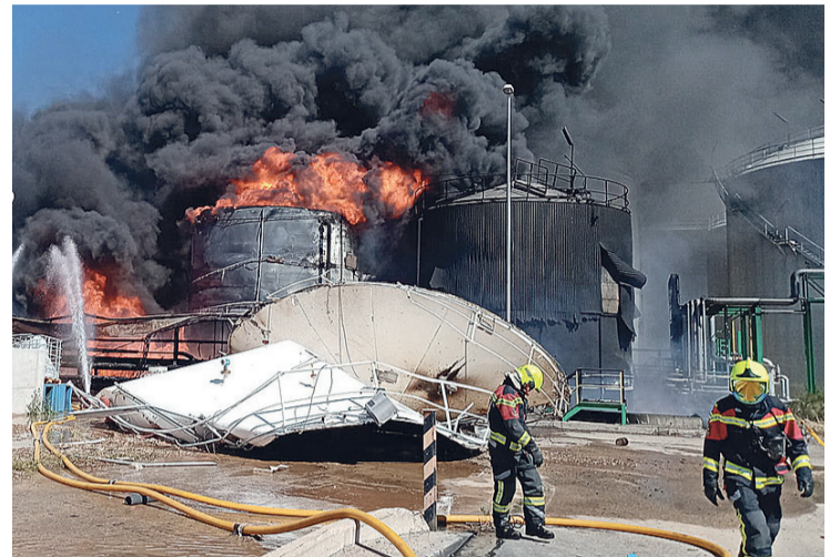
Las labores de extinción de los integrantes de Bomberos del CEIS-Rioja.

Rapaz. Allí, 250 niños de excursión fueron desalojados mediante autobuses, igual que los usuarios del centro ocupacio-