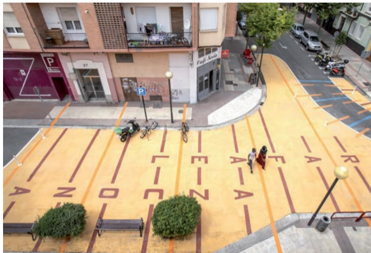
Una imagen de 'Calles Abiertas' junto a la Biblioteca Azcona.

Además, la Junta adjudicó el contrato para el desarrollo de la Agenda Urbana de Logroño por un importe total de 212.769,57 euros, y el de la asistencia técnica para la preparación, elaboración y seguimiento del Plan de Acción para el Clima y la Energía Sosteni-