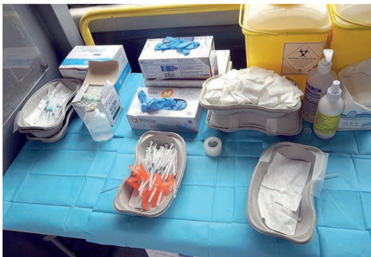
Material sanitario para la vacunación.

Desde el inicio de la pandemia, murieron en La Rioja 922 personas por COVID y se notificaron un total de 99.469 contagios, 350 de ellos durante la última semana. En los pasados siete días se realizaron en la comunidad riojana 1.975 pruebas (81 PCR y 1.894 test de antígenos), con una positividad del 30%, un punto por debajo de la media nacional.