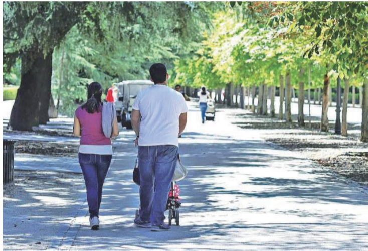
Imagen de una familia con el carrito de su bebé.

Además, el Consejo aprobó el gasto relativo a las obras de construcción de dos quirófanos, uno de ellos híbrido, para las especialidades de cirugía cardiológica y vascular en el bloque quirúrgi-