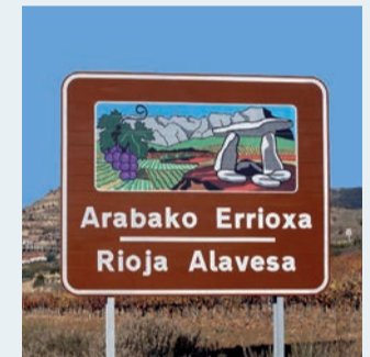
Cartel de Rioja Alavesa.

gobiernos (¡vaya incongruencia!), pues al final con "cuatro votos" son los que mandan en Madrid, y sobre todo en gobiernos inestables. Pero no nos engañemos. Quieren su denominación, pero dentro de la nuestra, aunque eso es el primer paso. El segundo es crear una propia que sea 'Rioja Alavesa'. Ya lo hicieron en los años 90. Yo he visto etiquetas y anuncios de prensa y televisión con 'Rioja Alavesa, el Rioja con nombre y apellido'. Es triste, pero estoy seguro que lo conseguirán. Aquí somos muy melifluos.