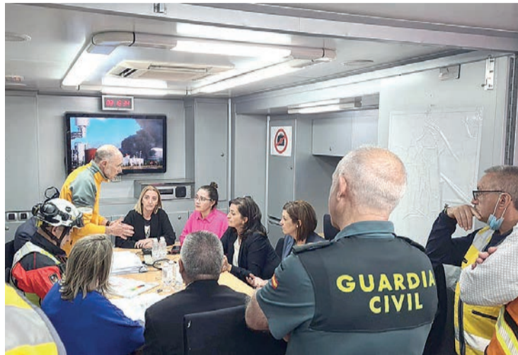
El puesto de mando de las autoridades junto a la planta de biodiésel de Calahorra.

En el momento del trágico suceso, pasadas las 12:00 horas, había alrededor de 25 empleados, pero no se produjo ningún herido grave. Sólo uno debió ser atendido en el Hospital de Calahorra, y recibió el alta inmediatamente. Unas 20 personas recibieron in situ cuidados médicos por inhalación de humo y cuadros de ansiedad, sin consecuencias. Hasta el lugar de