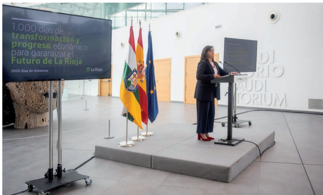
Concha Andreu, presidenta de La Rioja, durante su discurso con motivo de los 1.000 días al frente del Ejecutivo regional.