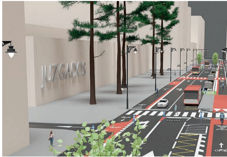
Una imagen sobre cómo evolucionará el proyecto en Murrieta.

Las obras se dividen en cuatro fases y empezarán en el Conservatorio de Música, donde se realizarán la parada de autobús, la plataforma para contenedores en Ramírez de Velasco y zonas ajar-