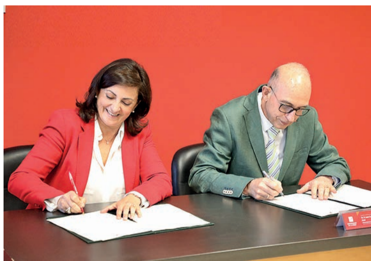
Firma protocolaria del convenio entre Gobierno riojano, Andreu, y UR, Ayala.

El primero, financiación estructural: con objeto de garantizar el funcionamiento general del campus, asegurar recursos suficientes para realizar las funciones de servicio público de la educación superior a través de la investiga-