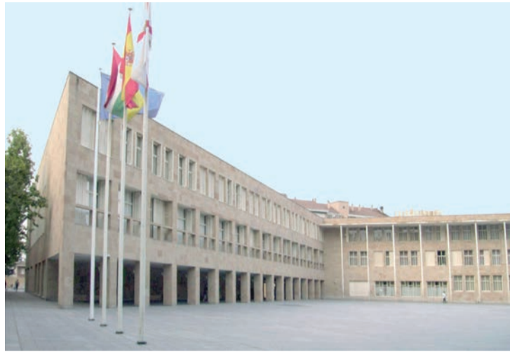
Una imagen del Consistorio logroñés.