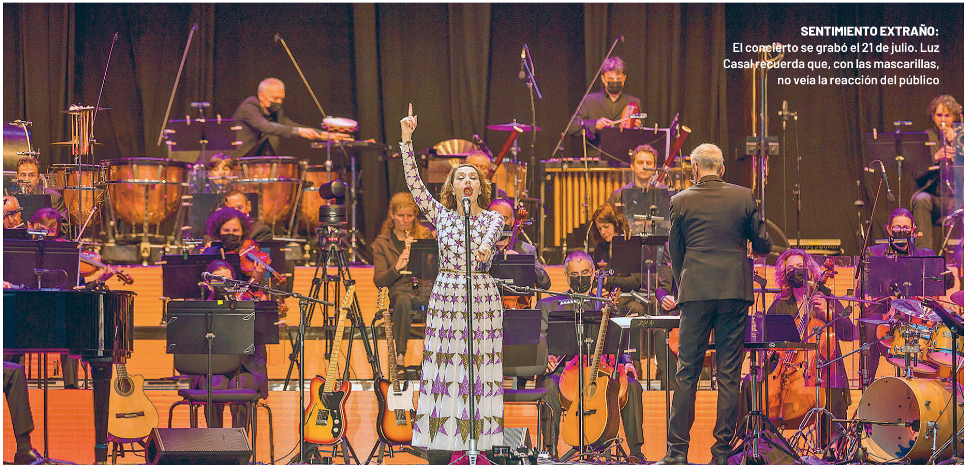
SENTIMIENTO EXTRAÑO: El concierto se grabó el 21 de julio. Luz Casal recuerda que, con las mascarillas, no veía la reacción del público

Q ue un artista lleve más de cuatro décadas en el mundo de la música es, sin duda, la muestra más irrefutable de que su trayectoria está a prueba de modas pasajeras. La historia de Luz Casal se sigue escribiendo, esta vez con un capítulo inédito, un disco en directo que bajo el título de 'Solo esta noche' repasa sus grandes éxitos con una compañía de excepción: una orquesta sinfónica.