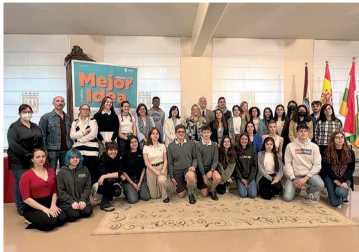
Foto de familia de los premiados y las autoridades logroñesas.

A través de la Red de Punto de Información Juvenil se promovió este concurso, que tiene como objetivo propiciar la partici-