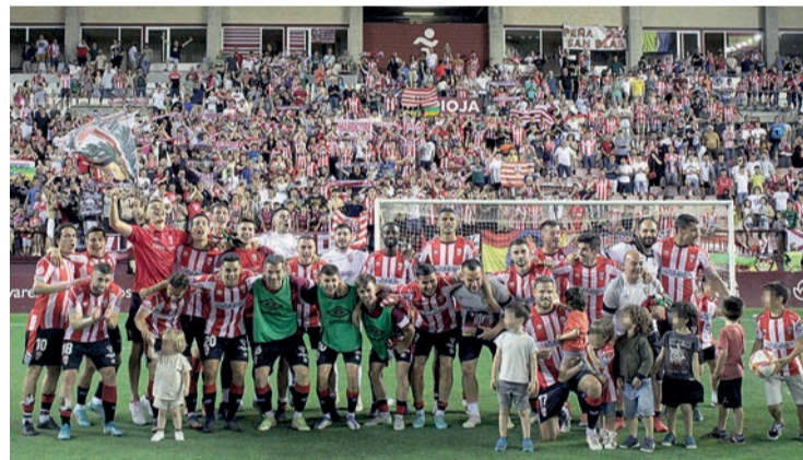
La celebración de la Unión Deportiva Logroñés tras la victoria sobre el Badajoz.