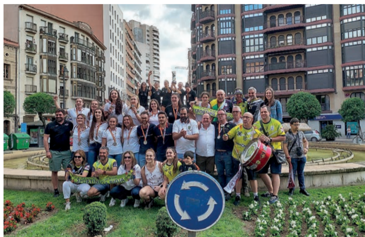
La celebración del Sporting La Rioja en Murrieta tras su ascenso.

Sporting La Rioja y Bolaños inauguraron la liguilla con un intenso choque que acabó en tablas (23-23). En el segundo encuentro, las riojanas dieron un paso al frente al batir por la mínima a las locales del Cicar Lanzarote Ciudad de Arrecife (21-22). La tercera y definitiva jornada se saldó con otro empate entre Sporting y Beti-Onak (23-23), un duelo por el título