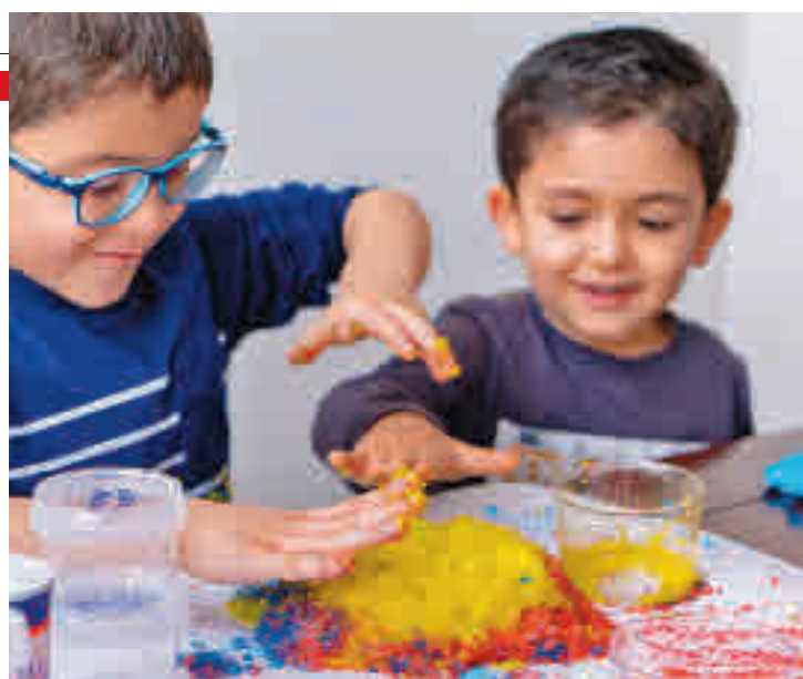
La iniciativa aún varias disciplinas como la ciencia y las artes