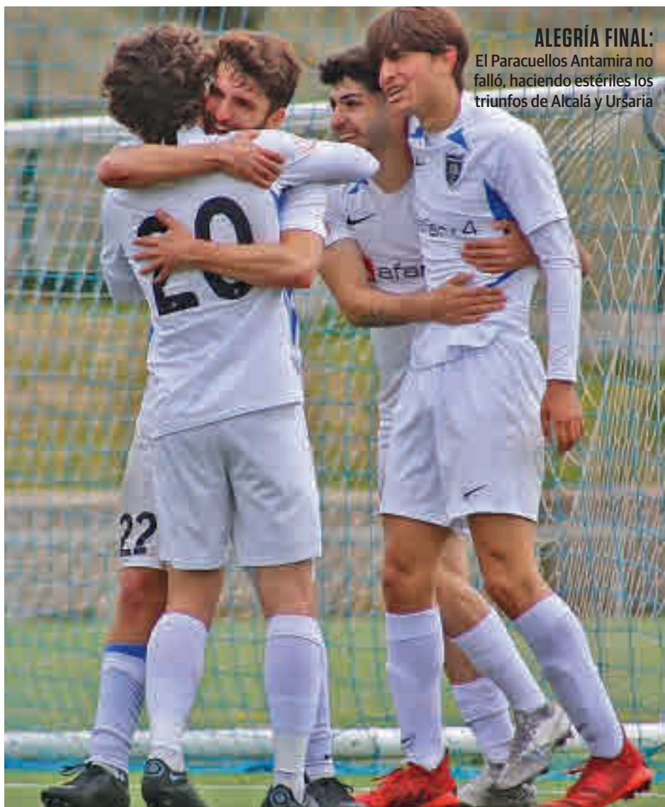
ALEGRÍA FINAL: El Paracuellos Antamira no falló, haciendo estériles los triunfos de Alcalá y Ursaria

El que salga vencedor de esa semifinal se verá las caras el domingo 15 con el ganador del cruce entre el Fuenlabrada Promesas y el Alcorcón B, que se disputará este domingo (18 horas) también en Navalcarbón. El filial azulón ha sido una de las revelaciones del campeonato, ya que tras tomar el relevo del Flat Earth