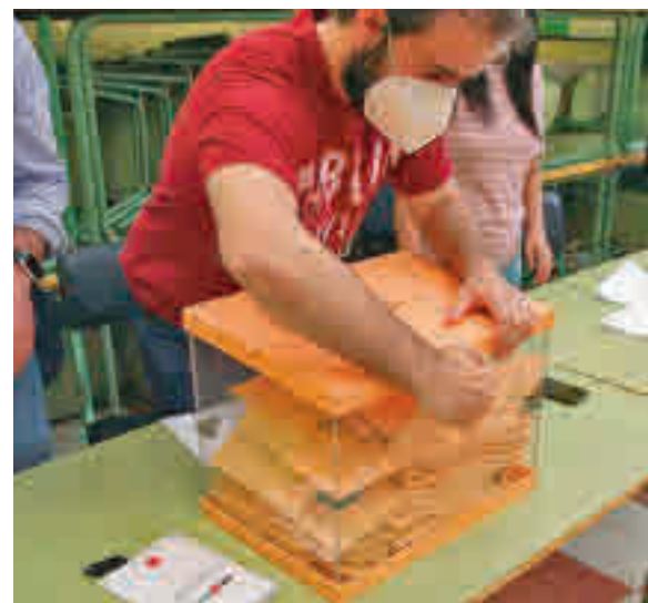
Elecciones autonómicas de 2021

La primera de ellas mantiene a Más Madrid como principal fuerza de la oposición, mientras que la segunda refleja que el PSOE recuperaría esa posición. Vox mantendría la cuarta plaza en todos los escenarios. Las peores noticias llegan para Unidas Podemos, que estaría a un solo punto de perder su representación.