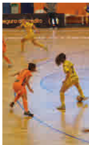
Partido del Alcorcón

sala, un torneo a cuya fase final se han clasificado ocho equipos, dos de ellos de la Comunidad de Madrid. Precisamente uno de ellos, el