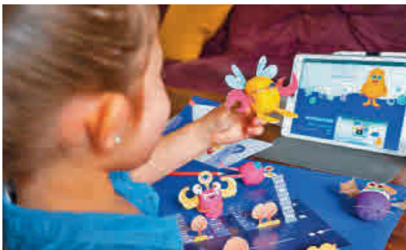
WoWplay tiene un formato híbrido entre el mundo digital y el offline