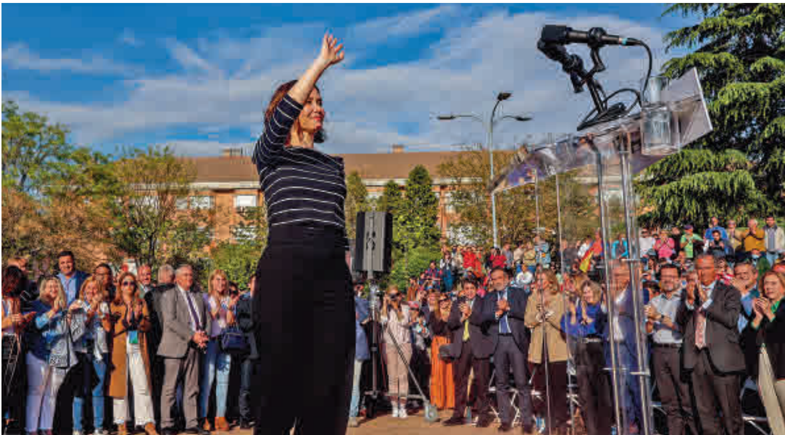
Isabel Díaz Ayuso, durante un acto realizado este miércoles 4 de mayo