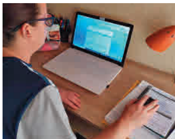
El teletrabajo ha aumentado en estos dos años

cuatro o más días a la semana el trabajo en remoto, según el informe 'Flash: Radiografía del trabajo a distancia' del Observatorio Nacional de Tecnología y Sociedad (Ontsi), dependiente de la Secretaría de Estado de Digitalización e Inteligencia Artificial. El estudio también revela que el 35% de las personas ocupadas en