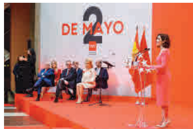
Homenaje en la Real Casa de Correos

Sin casi tiempo para la pausa, y aprovechando que las