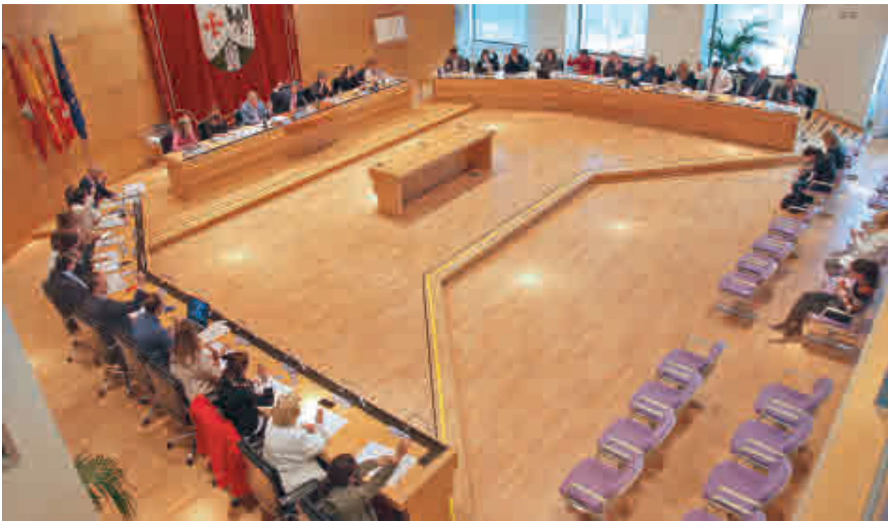
Un momento de la sesión plenaria llevada a cabo la semana pasada