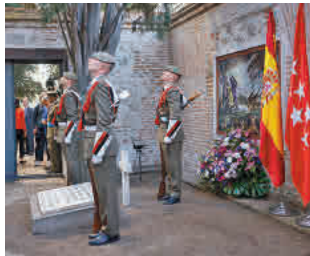
Ofrenda floral en el cementerio de La Florida

Nada más acabar este acto, en el que también participó el pelotón de Honores del Regimiento de Artillería Antiaérea 71, Díaz Ayuso se desplazó a la Real Casa de Correos de la Puerta del Sol para entregar las Medallas de la Comuni-