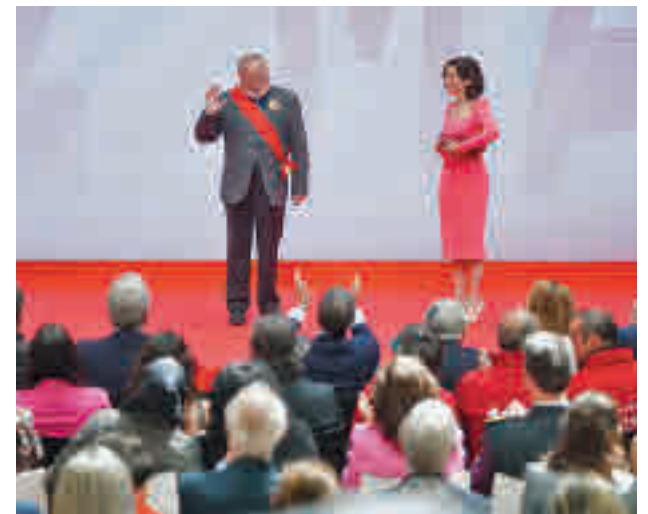
Entrega de los reconocimientos del 2 de Mayo

dad de Madrid y las Condecoraciones del 2 de Mayo. El filósofo Fernando Savater, el cocinero José Andrés, el grupo musical Hombres G, la exjugadora de baloncesto Amaya Valdemoro, el cineasta José Luis Garci, el periodista Luis María Anson y la juventud madrileña fueron algunos de los premiados en esta edición.