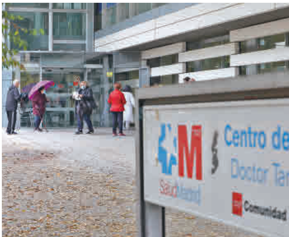
Centro sanitario de la Comunidad de Madrid

Zapatero subrayó que el coronavirus "sigue aquí" y, aunque continúen los contagios, la vacuna protege frente a casos graves. También ocurre en planta, donde hay una estabilización de ingresos y donde la mayoría de pacientes no están ingresados a causa de la infección por coronavirus. Además, ahora la Consejería de Sanidad cuenta con tratamientos para la covid-19 mediante antivirales que ya están utilizando en pacientes con mucho riesgo. "Van las cosas como tienen que ir", concluyó.