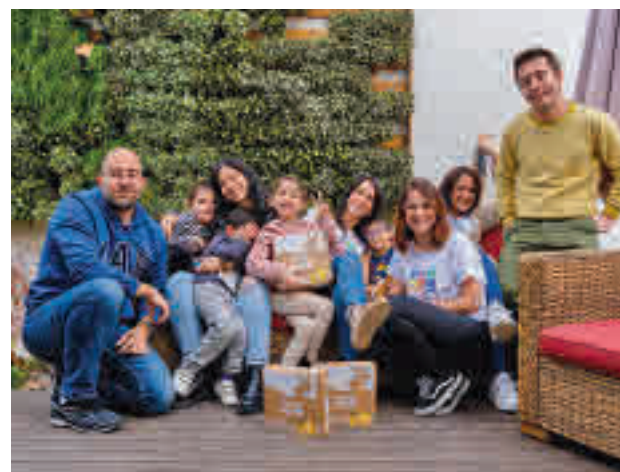
Buena acogida: La CEO y cofundadora afirma que "somos una comunidad aún pequeña, pero el 'feedback' que estamos recibiendo es muy positivo. Los padres destacan que "les permite tener tiempo de calidad en familia, al ser un proceso divertido".

Sobre las trabas que dificultan el emprendimiento, la CEO de WoWplay apunta a factores como la dificultad para conciliar, la financiación y la carga de tareas.