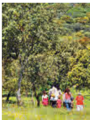
Entorno de la Dehesa Boyal

Aprovechando la explosión floral de esta época del año se ha programado una actividad de tres horas conducida por un experto botánico y dirigida a todos los amantes de la naturaleza y al público