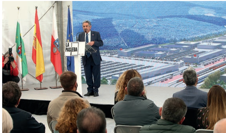
El presidente de Cantabria, Miguel Ángel Revilla, el miércoles durante la presentación.

Con esta hoja de ruta, el Ejecutivo mantiene su compromiso de que en el año 2023 "habrá máquinas en La Pasiega" para materializar "el proyecto que necesita Cantabria", que permitirá ampliar el Puerto de San-