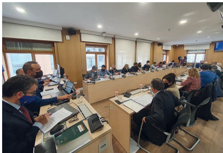
Un momento del Pleno, que el martes que retomó su formato presencial.

Este punto contó con el voto a favor de todos los grupos salvo ACPT y Cs, que se abstuvieron porque, aunque están de acuerdo con soterrar el aparcamiento y de hecho creen que lo contrario sería "una chapuza" que condicionaría el resultado de la obra, consideran que esta modificación del convenio responde a que "no se han cumplido los compromisos" por parte de las