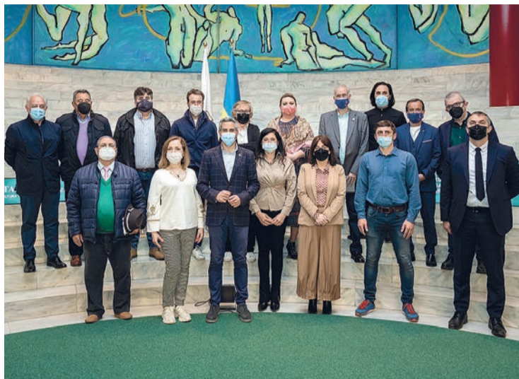
Foto de familia de los asistentes a la presentación del concierto solidario con Ucrania.

Las entradas tienen un precio único de 10 euros y también se ha habilitado una Fila 0 para recaudar el mayor número de aportaciones posibles. Además, el Gobierno de Cantabria también tiene habilitada una cuenta (ES37 0049 6742 52 2416330868) para colaborar con aportaciones y ayuda al pueblo