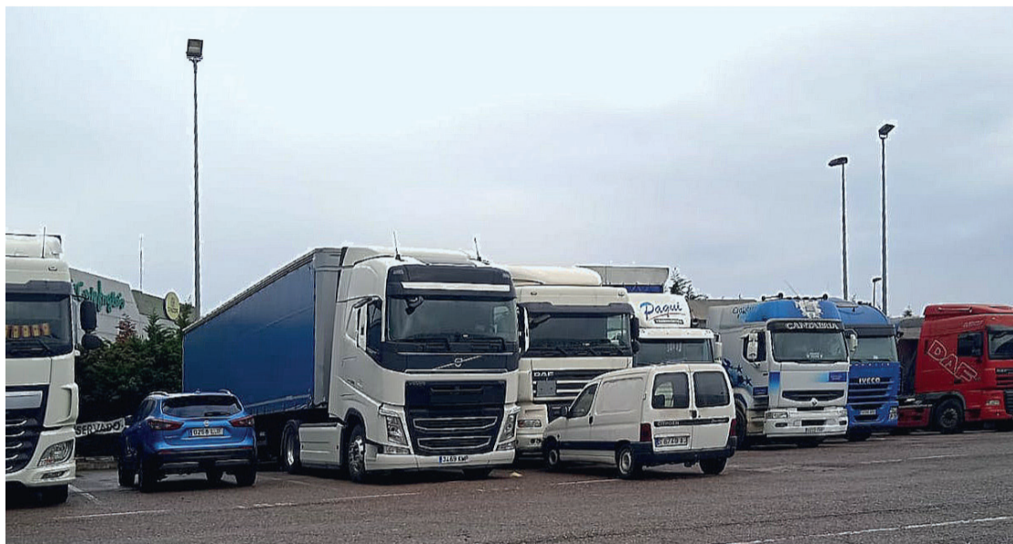
Camiones aparcados en la Ciudad del Transportista de Santander esta semana.

reunión de diciembre la aprobación de alguna de estas medidas, algunas organizaciones, como Plataforma Nacional, consideraron el acuerdo insuficiente y convocaron un paro indefinido.