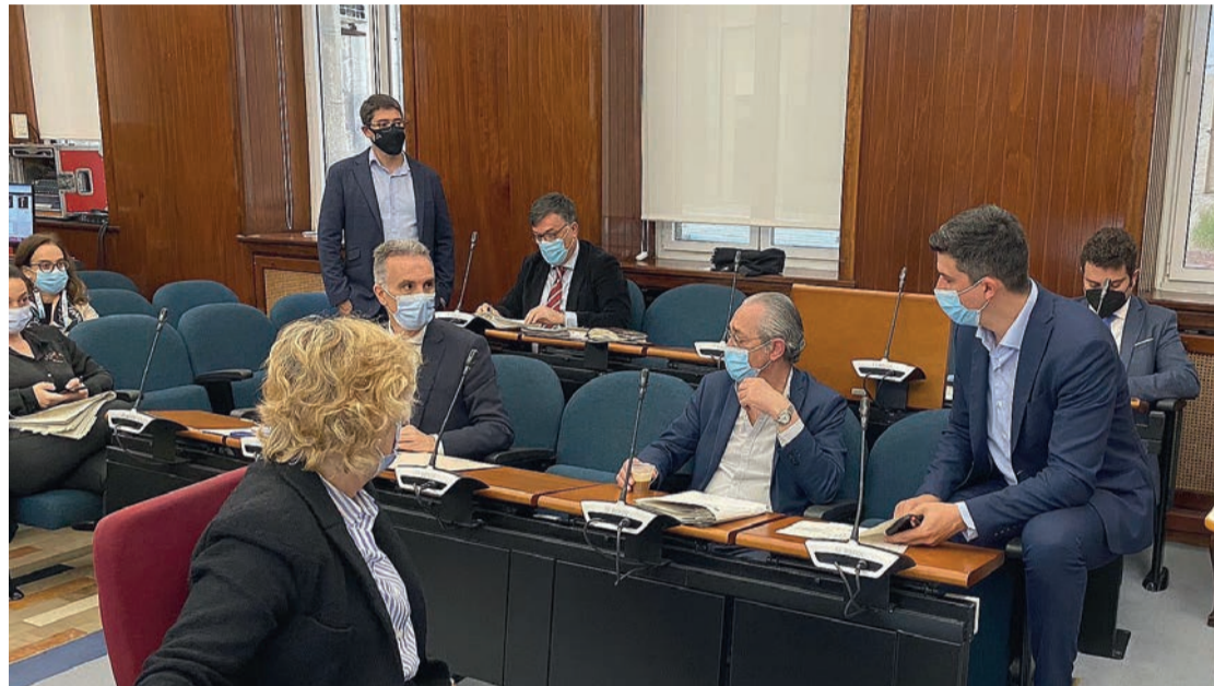
Concejales del equipo de gobierno, junto al portavoz del PSOE y al portavoz de Vox, durante el pleno del jueves.