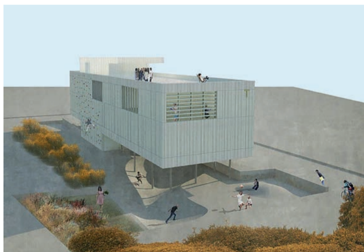
Infografía de la futura Tecnoteca y Centro de Ocio de Torrelavega.

Según se recoge en el pliego de condiciones, el edificio se deberá desarrollar en planta baja más tres alturas máximo, y sótano, con comunicación a través de núcleo de escaleras y ascensor. El edificio contará