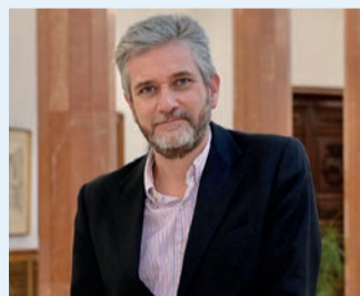
JAVIER CERUTI CONCEJAL DE URBANISMO, CULTURA Y TRANSPARENCIA DEL AYUNTAMIENTO DE SANTANDER