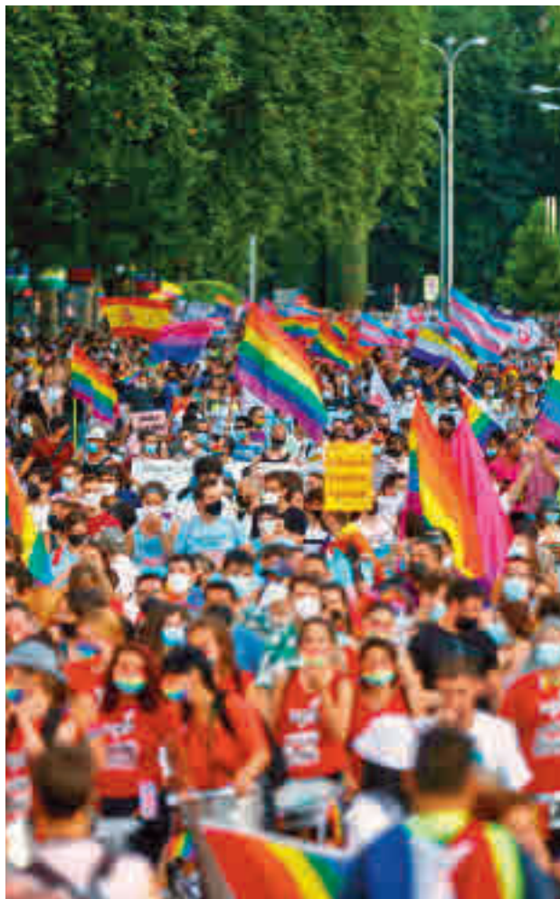
La multitudinaria manifestación de ediciones anteriores

El tradicional pregón en la Plaza Pedro Zerolo, el miércoles 6 de julio, dará el pistoletazo de salida para los actos de celebración. Otra de las citas destacadas será la 15 edición del Mr Gay Pride Es-