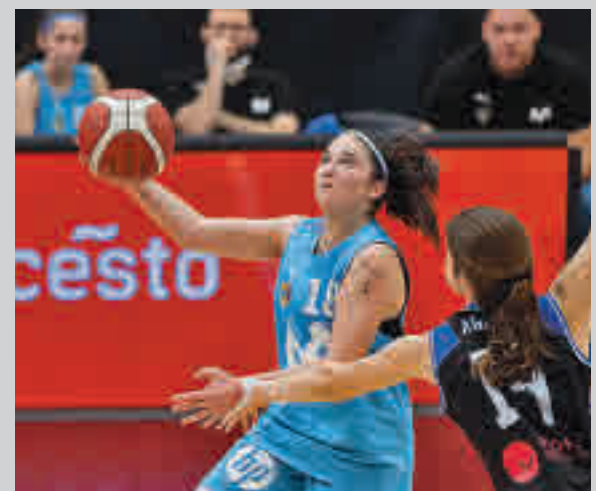
La jugadora natural de Las Rozas, en la final M. ESTUDIANTES