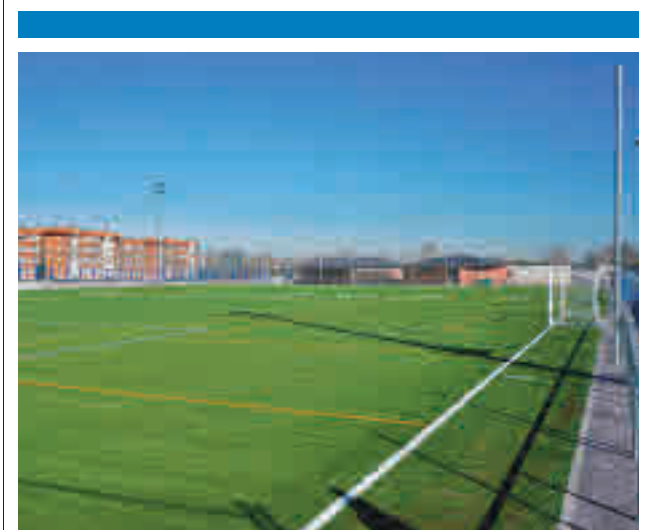
Campo de fútbol Jesús Huerta

Tras realizar un rastreo en la documentación aportada por el propietario se logró identificar un almacén ubicado en un polígono de Fuenlabrada como punto de distribución de esta mercancía. La inspección que realizaron los agentes permitió localizar numerosas cajas que albergaban botellas con diferentes licores asiáticos, por lo que los agentes se incautaron de 16.743 botellas, que la Agencia Tributaria ha valorado en 288.000 euros. El propietario podría ser acusado de contrabando.