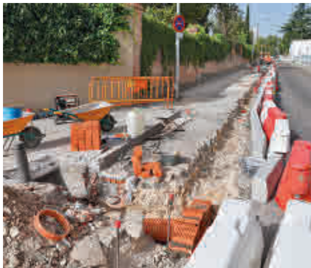
Las obras en el entorno del colegio Sagrado Corazón

Fuentes municipales explican que el objetivo es lograr una entrada segura y mejorar la seguridad vial del entorno y su calidad ambiental. Para ello, se pondrán en marcha intervenciones que permitan ampliar el espacio destinado al tránsito y estancia peatonales, actuar sobre la intensidad y velocidad del tráfico de vehículos, y mejorar su calidad. Además, se contemplan actuaciones de