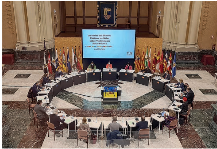
La mesa de diálogo del Gobierno central y las comunidades sobre medidas sanitarias.

Como Darias tiene "claro el cómo, pero no tanto el cuándo", se solicitó