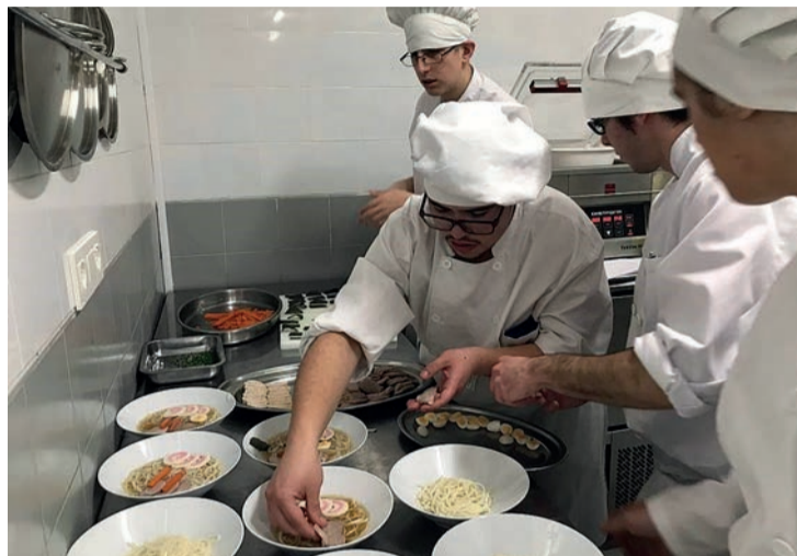
Alumnos de Formación Profesional en Cocina, en acción.

En nota de prensa, STAR explicó que se trata "un día triste para la educación pública riojana": "El CEIP San Francisco de Logroño era un centro de referencia en cuanto al trabajo en inclusión con el alumnado. Se realizaron propuestas a la Consejería de Educación para estudiar la posible puesta en marcha de un cambio metodológico, como el conocido como Proyecto Roma, heredero en gran parte de figuras de gran envergadura pedagógica como Lev Vygotsky, pero estas iniciativas no recibieron apoyo".