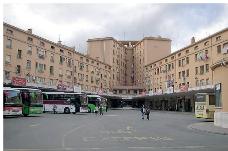
Una imagen de la antigua estación de autobuses, aún en funcionamiento.

La totalidad de las plantas bajas colindantes a la dársena de auto-