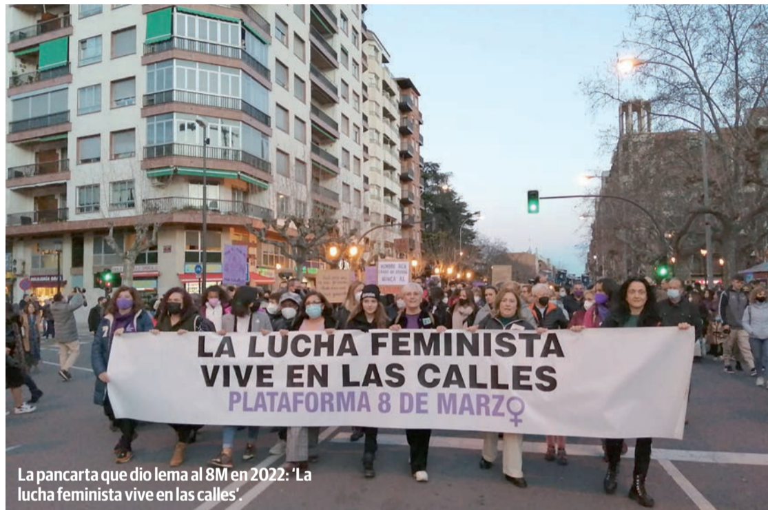
La pancarta que dio lema al 8M en 2022: ‘La lucha feminista vive en las calles’.

Por el camino también se corearon consignas al ritmo del himno feminista de Bandini: “Contra el patriarcado, feminismo organizado”. “Sola, borracha, quiero llegar a casa”. “No nos mires, únete”. “Ni una