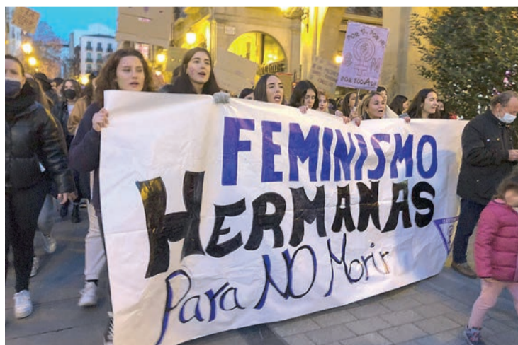
Una de las pancartas más directas: ‘Feminismo, hermanas para no morir’.

menos”. Los cartones y sus mensajes se transformaron en la mejor herramienta de repulsa al machismo: ‘Manolo, hazte tú la cena solo’, ‘Juntas, libres, seguras’, ‘No somos históricas, sino históricas’, ‘Somos las nietas de las brujas que no pudis-