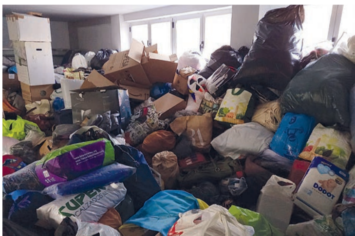
El material de primera necesidad recogido para Ucrania en el Center Gym Club.