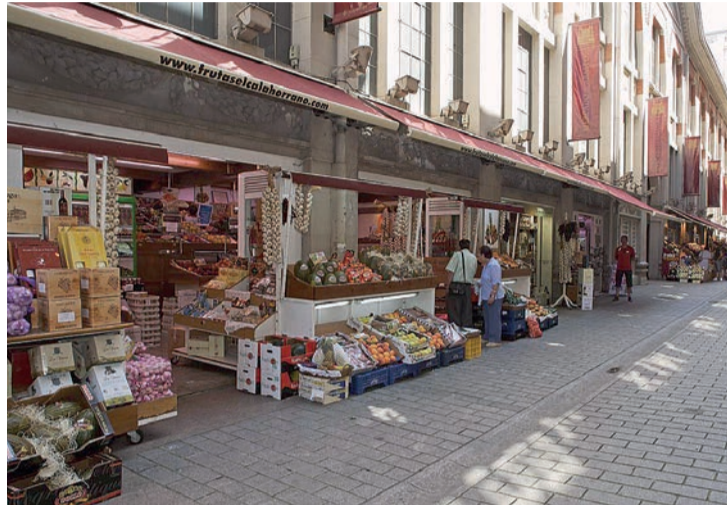
Uno de los puestos exteriores de la Plaza de Abastos logroñesa.

El proceso de licitación, puesto en marcha en primavera de 2021, fue "en todo momento dialogado y consensado con los comerciantes", como explicó Hermoso de Mendoza. Durante este 2022 el Ayuntamiento de Logroño acometerá obras de mejora en la Plaza de Abastos gracias a los fondos