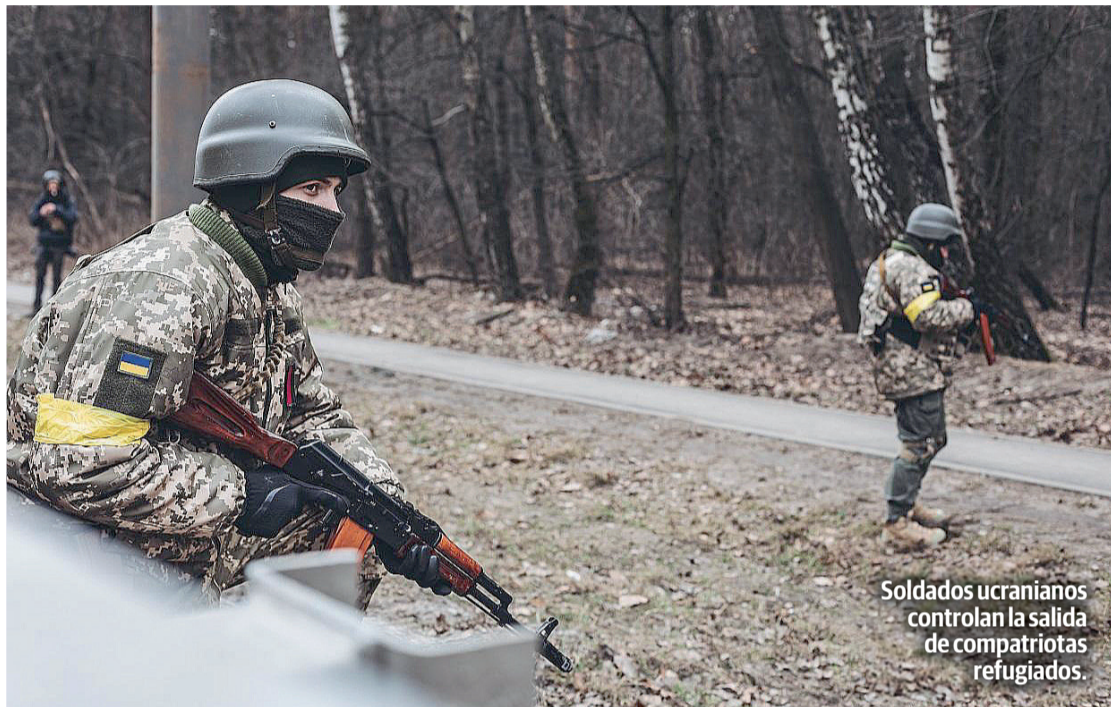
Soldados ucranianos controlan la salida de compatriotas refugiados.