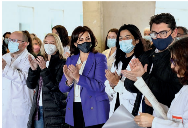
La lectura del manifiesto por el 8M en el Hospital San Pedro de Logroño.

Esta brecha salarial tiene su reflejo en las pensiones, fundamentalmente en las contributivas. Y