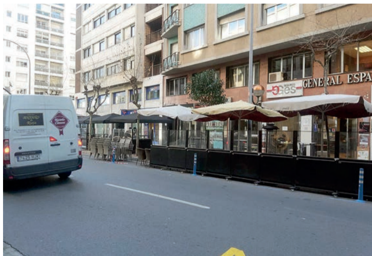
Las terrazas de avenida Portugal, con su espacio en los aparcamientos.

Caballero incidió en su rueda de prensa del lunes 7 que "Logroño llevó a cabo en mayo de 2020 varias decisiones normativas para facilitar que el sector de la hostelería pudiera instalar terrazas y veladores como consecuencia de las restricciones en el interior de los esta-