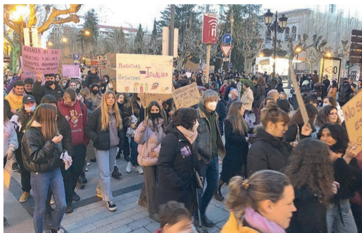
Los carteles y manifestantes antes de continuar la marcha por la calle Portales.