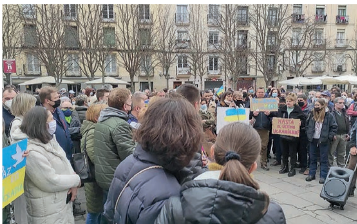
La concentración en Logroño de residentes ucranianos en La Rioja.