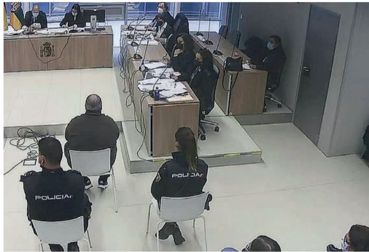
Un instante del juicio que se llevó a cabo en la Audiencia de Logroño.

El Ministerio Fiscal y la defensa del parricida alcanzaron un acuerdo de conformidad por el que coinciden en acusarle de un delito de asesinato con la agravante de parentesco, y se le reconoce la atenuante de alteración psíquica muy cualificada. Piden para él