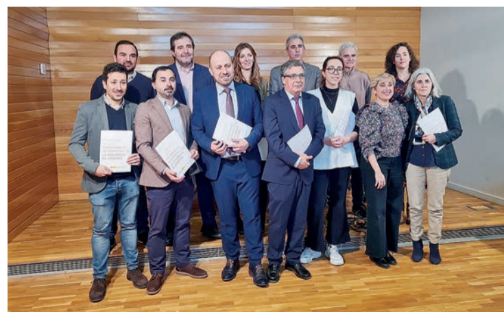
Los responsables de los medios riojanos, con el documento de buenas prácticas.

El texto lo firman todos los medios de comunicación riojanos y quiere convertirse en una guía ante "el importante papel de la prensa en todos sus ámbitos para la sensibilización y el compromiso de ser claros en la labor de informar con responsabilidad y proteger a las víctimas". Como destacó Ana Castellanos, es "fundamental que los periodistas estén bien formados y contar con los recursos necesarios