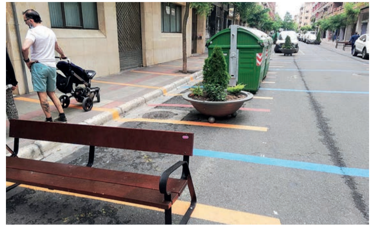
La calle Fundición y su señalización, una de las que se encuentra bajo lupa.

Además, el PP amplió su denuncia al Defensor del Pueblo con los informes de la 'Asesoría Jurídica, Dirección General de Contratación e Intervención General' respecto a las 32 facturas declaradas nulas y que corresponden también