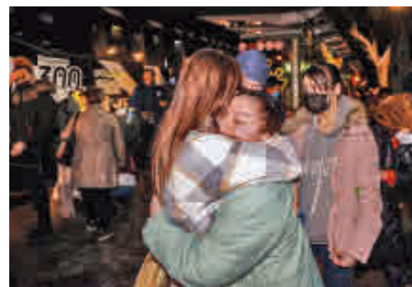
Refugiados llegando a España

celona y en Alicante. El ministro de Inclusión, Seguridad Social y Migraciones, José Luis Escrivá, señaló que su departamento está hablando con las comunidades autónomas para articular el mecanismo de acogida, cuya capacidad