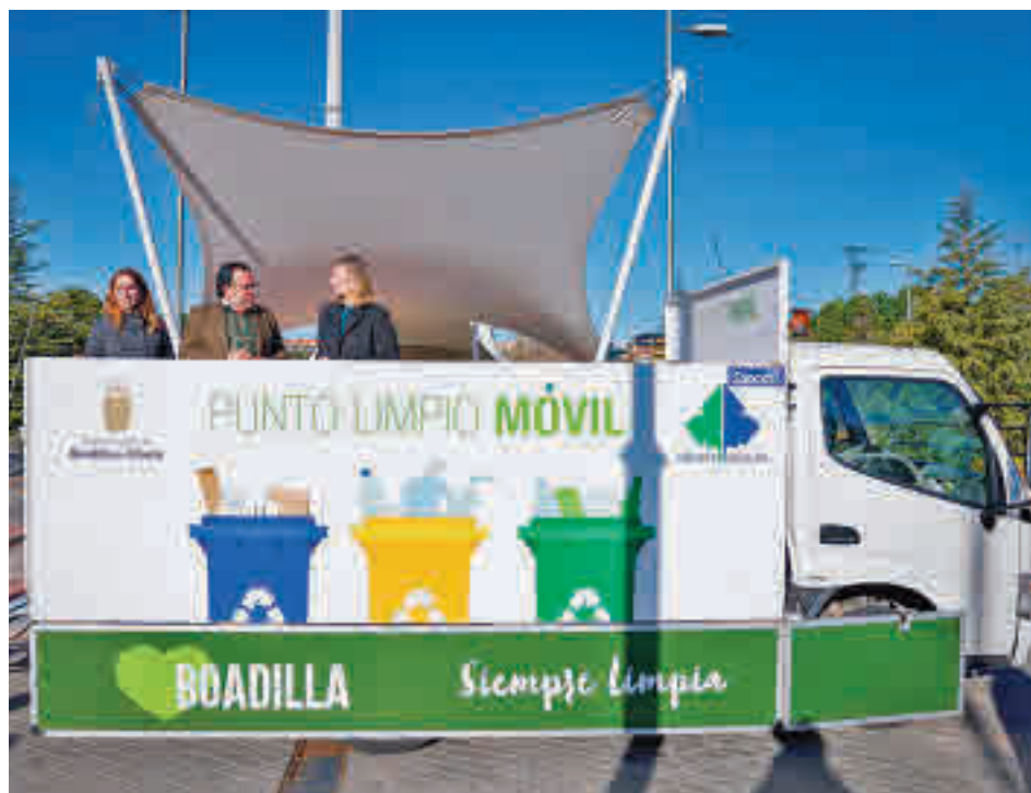
Un momento de la visita de la consejera de Medio Ambiente

La actualidad de los municipios del Noroeste, en nuestra web