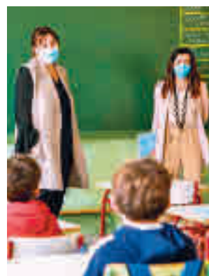
La alcaldesa visita un colegio

mana Santa. Para ello, durante los días 8, 11, 12, 13 y 18 de abril, abrirán sus puertas los colegios Las Acacias, Príncipes de Asturias y Divino Maestro, donde se desarrollarán diferentes actividades deportivas, culturales y artísticas, que se impartirán en gran parte, en inglés.