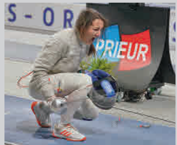
La madrileña compete en la disciplina de sable

La jornada 21 de la Parlem OK Liga de hockey patines depara una complicada visita este sábado (18 horas) para el CP Alcobendas, que se medirá con un Barça que es líder con una única derrota.