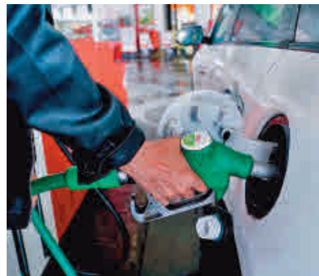
El precio de la gasolina supera los 1,8 euros por litro

La Asociación del Transporte Internacional por Carretera (Astic) ha advertido de la "debaque económica y desabastecimiento" al que España se enfrenta si el Gobierno no adopta "de forma inmediata" medidas para paliar los efectos que los altos precios de los carburantes está causando en el sector. La patronal recuerda que el transpor-