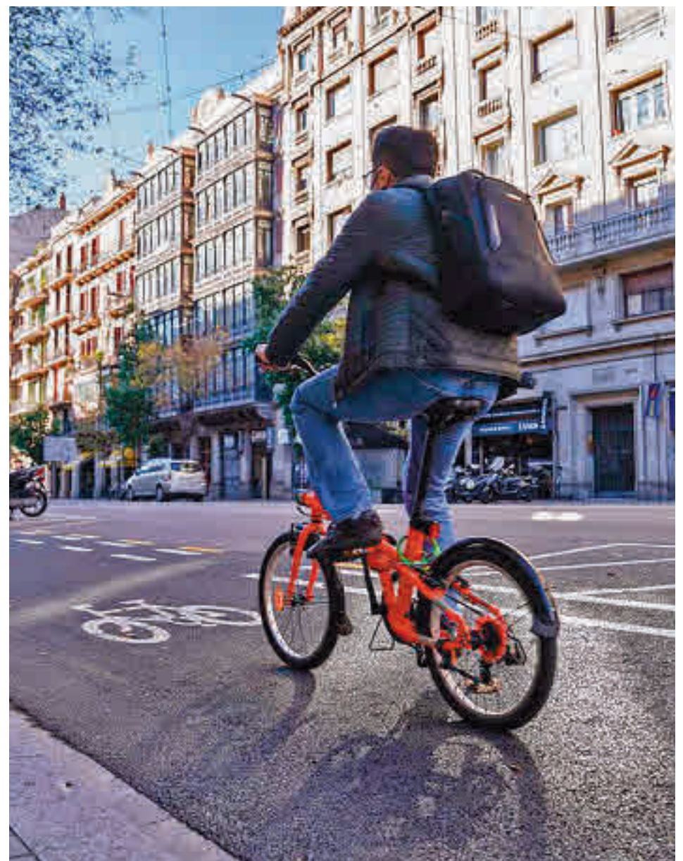
Los carriles bici provisionales de la pandemia se han quedado de manera definitiva

colectivos ciclistas más de una década. El primer tramo, que conectará Plaza Castilla con Nuevos Ministerios, abrirá en 2023. Barcelona, por su parte, abrió 21 kilómetros. En Vitoria se han conectado los polígonos industriales para que los trabajadores puedan ir a trabajar en bici. Además, esta es la ciudad que cuenta