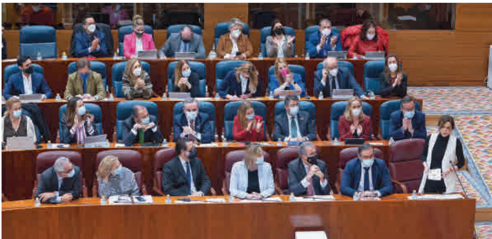
Isabel Díaz Ayuso, durante su intervención este jueves en la Asamblea de Madrid