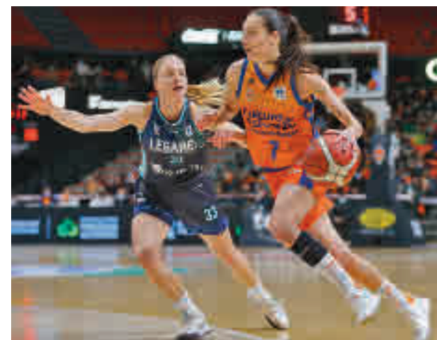
El Leganés no pudo con el Valencia FEB