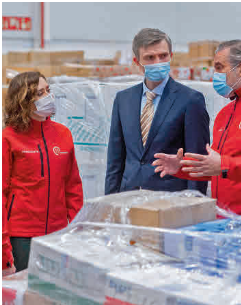
Díaz Ayuso visitó en almacén del Isabel Zendal

El alcalde de Madrid, José Luis Martínez-Almeida, anunció este lunes que el espacio público frente a la Embajada de Ucrania de la capital llevará el nombre del presidente ucraniano, Volodimir Zelenski, a quien denominó como "faro de la libertad". Se trata de la plazuela en la que confluyen Ronda de Sobradriel, Ronda Abubilla y avenida de Champagnat. "Es necesario homenajear a aquellos que están defendiendo la libertad y democracia en el mundo", añadió.