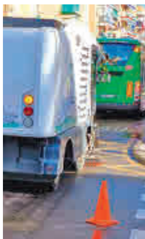
Limpieza en Parla

inciendiando en la retirada de residuos que no pueden eliminarse con el servicio de limpieza viaria habitual como residuos procedentes del tráfico, excrementos de animales, hojas de árboles o cualquier otro tipo de objeto o residuos depositado en las vías y zonas verdes públicas, susceptible de ser cargado y transportado por el equipo de barrido.