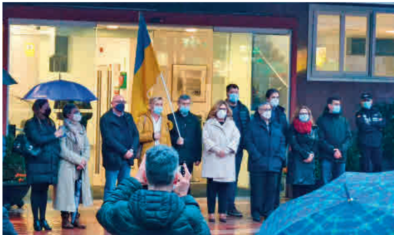
Alcorcón se manifestó en contra de la guerra en Ucrania

Tanto Alcorcón como el resto de municipios de la zona (Móstoles, Pinto o Valdemoro) han llevado a cabo en los últimos días concentraciones de apoyo al pueblo ucraniano, rechazando la invasión llevada a cabo por el ejército ruso. Además, la Federación Española de Municipios y Provincias (FEMP) convocó cinco minutos de silencio este miércoles a mediodía en todas las localidades.