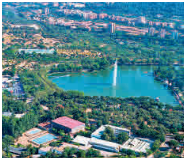
La Casa de Campo es el mayor pulmón verde de la capital

Fuentes municipales explican que el temporal dañó un total de 733.507 árboles de los 1.717.028 con los que cuenta la ciudad, esto es un 42,7%. Además, el 20% del arbolado de alineación se vio afectado, lo que supuso un total aproximado de 150.000 árboles. La especie que peor salió parada fue el pino, con