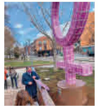
Monumento de Parla