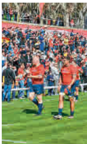
Nueva cita en Madrid

13 de marzo (12:45 horas) se viva otra bonita mañana de rugby, con la selección española jugando un choque claro en la clasificación para el