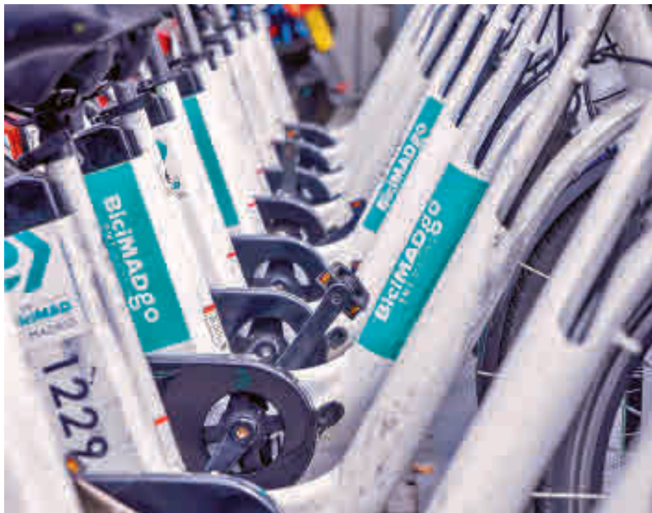
Una de las bases del servicio municipal de alquiler de bicicletas en la capital

Desde Cibeles explican que hasta que se complete el proceso, habrá una etapa de