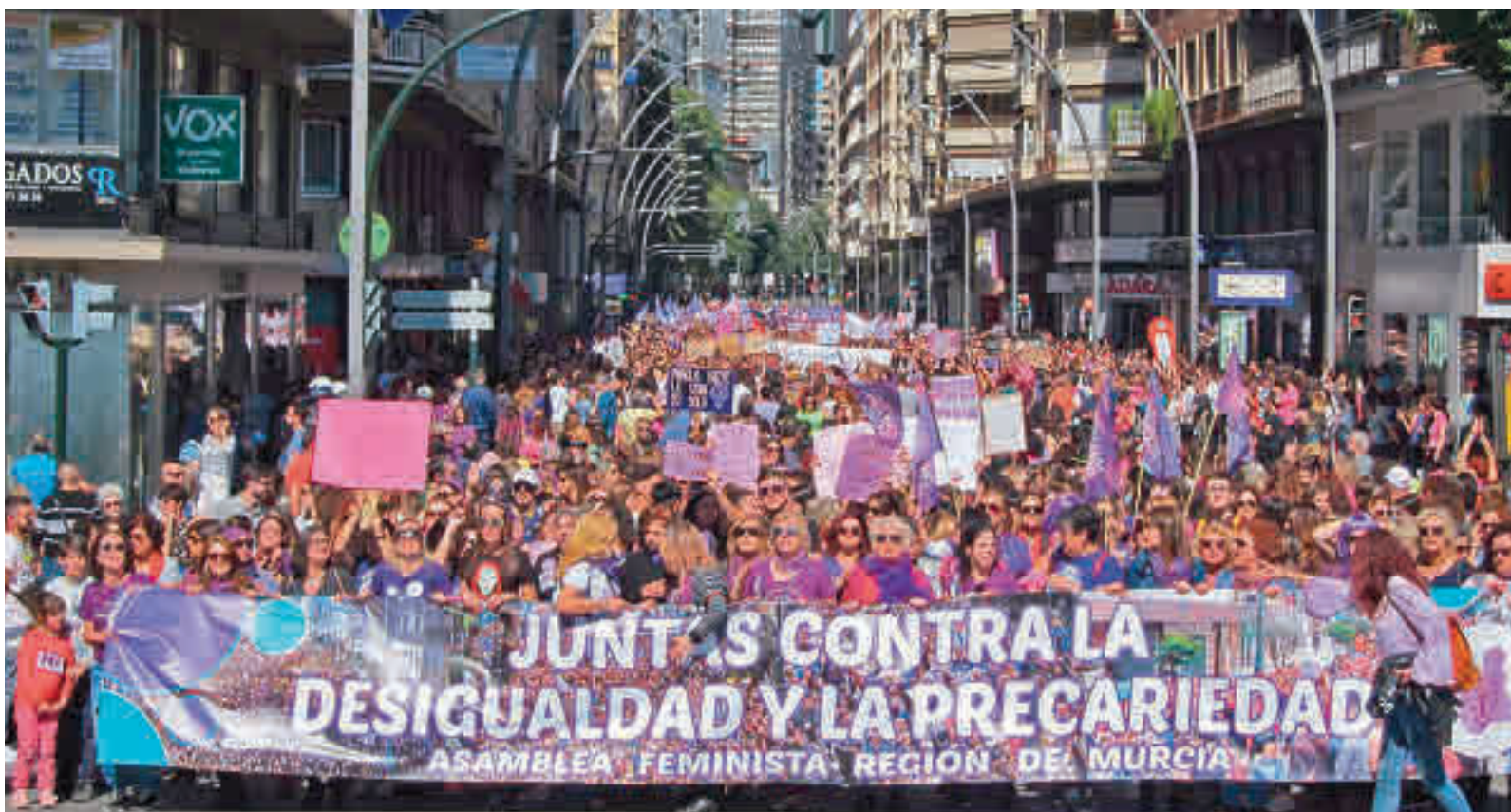
Celebración del 8-M del año 2020