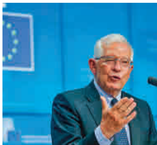
Borrell, en el Parlamento Europeo

EL PERIÓDICO GENTE NO SE RESPONSABILIZA NI SE IDENTIFICA CON LAS OPINIONES QUE SUS LECTORES Y COLABORADORES EXPONGAN EN SUS CARTAS Y ARTÍCULOS