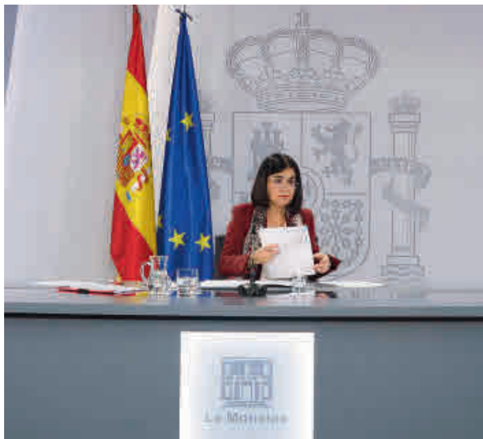
Comparecencia de Carolina Darias

Entre el 15,4% de los encuestados que no han modificado sus hábitos de consumo, se ve una clara preponderancia de los hombres (20,5%) frente a las mujeres (10,6%), y de mayores de 65 años (22%) en comparación a los jóvenes de entre 18 y 34 años (8,5%). Casi 7 de cada 10 (69,1%) responsables del pago de suministros han afirmado que son "más conscientes" del consumo energético total a raíz de la situación económica.