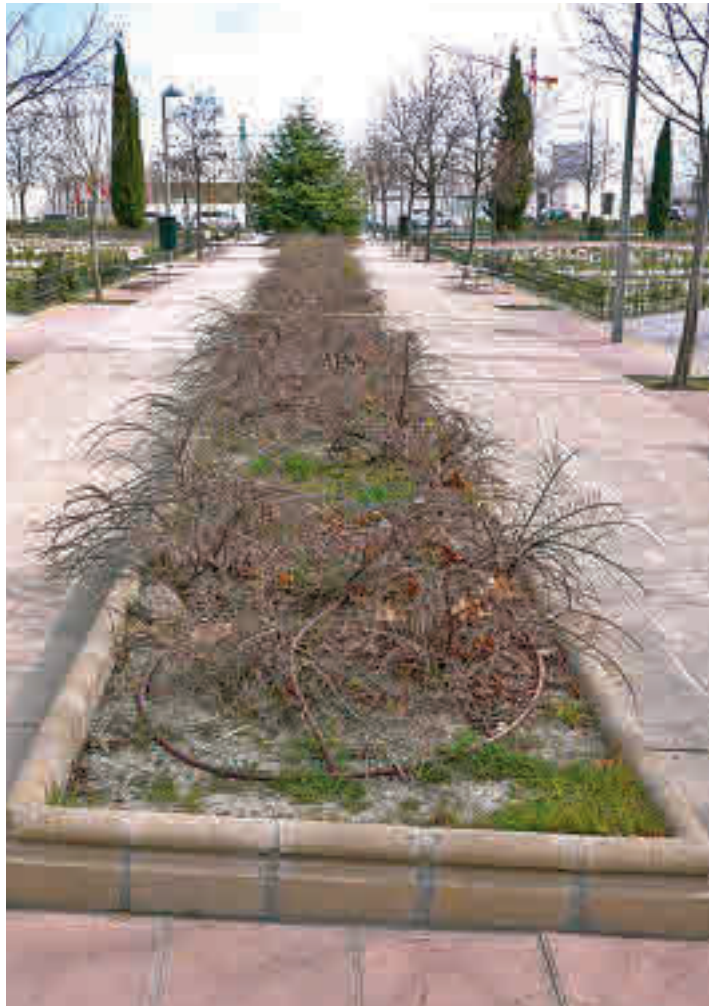
Uno de los ámbitos de la actuación municipal

SE HAN CREADO ZONAS CANINAS EN DIFERENTES ESPACIOS DEL BARRIO