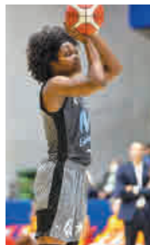
El 'Estu' es octavo

También se antoja difícil la salida del Innova-tsn Leganés, en su caso a la cancha del Valencia Basket, un conjunto que parece estar en condiciones de poner en duda el duopolio de los últimos años entre el Perfumerías Avenida y el Spar Girona.