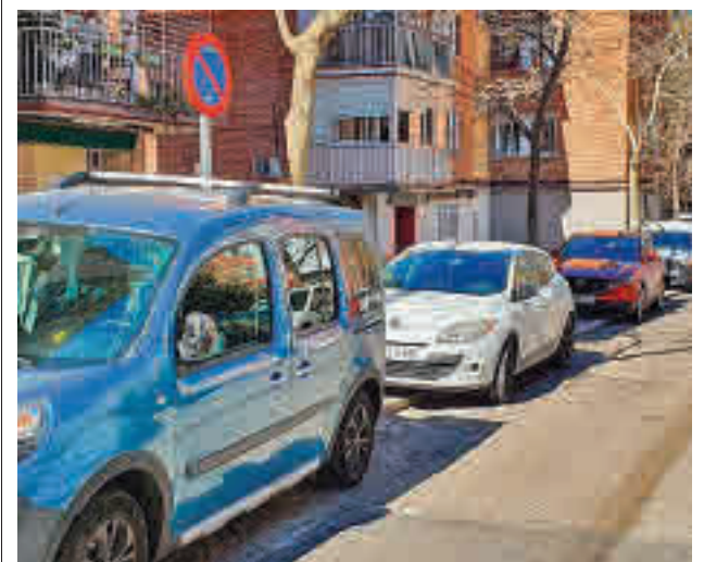
Una de las calles de Ciudad Lineal

Para completar las actuaciones en el distrito de Villa de Vallecas, se ha llevado a cabo la reposición de las pistas de petanca y se ha creado una zona de merendero con mesas. Además, se han instalado bancos y se han renovado las papeleras donde ha sido necesario.