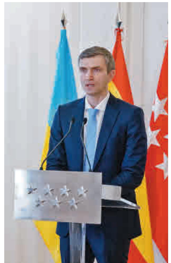
Matuschenko, tras la reunión con Ayuso

a ayudar en todo aquello que necesiten y que para eso vamos a estar en contacto con el Gobierno. La batalla que se está librando es por la libertad de Ucrania pero también es por la libertad de todos nosotros”, concluyó.