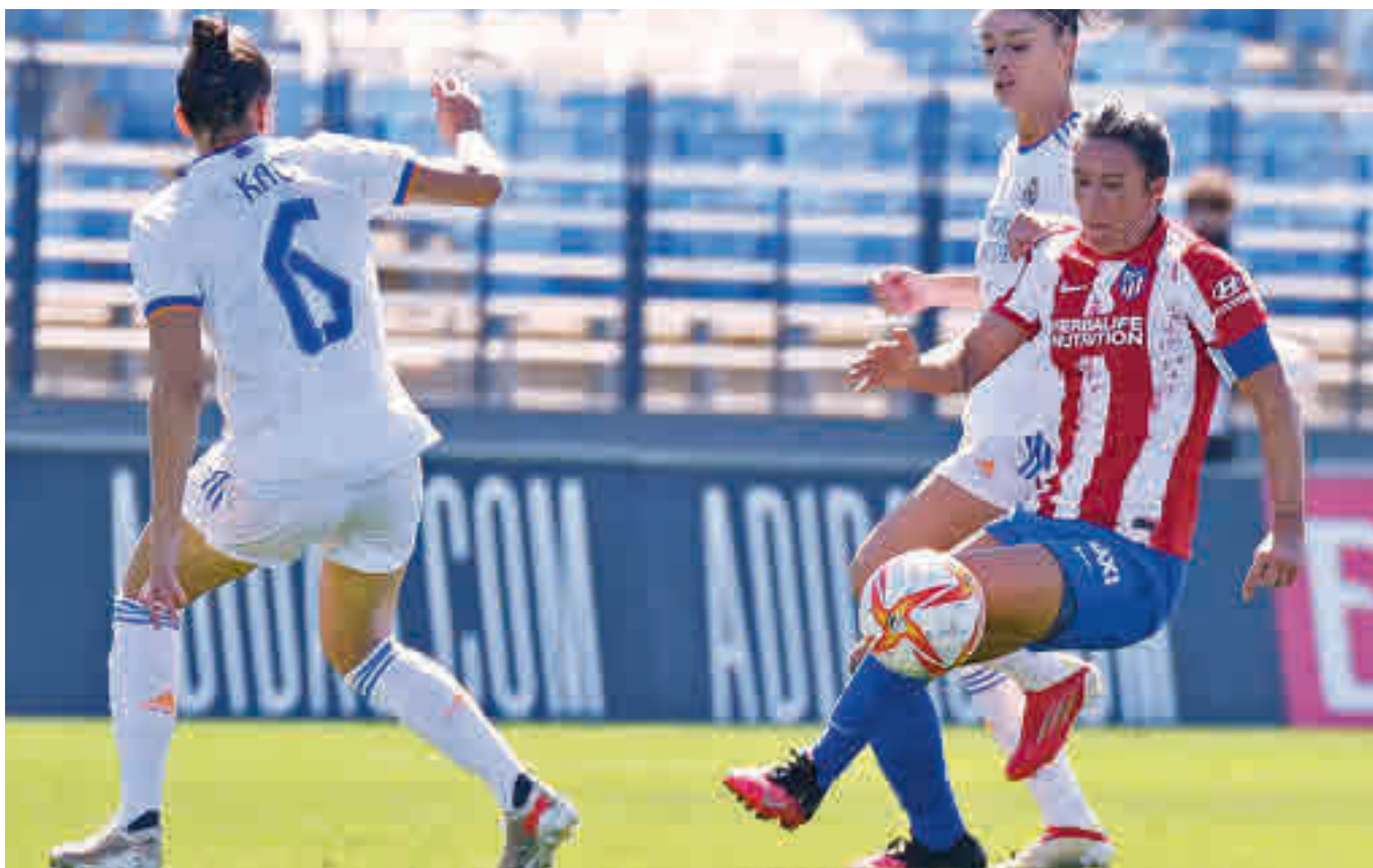
El Atlético de Madrid se impuso en el derbi jugado en la primera vuelta en Valdebebas por 0-2