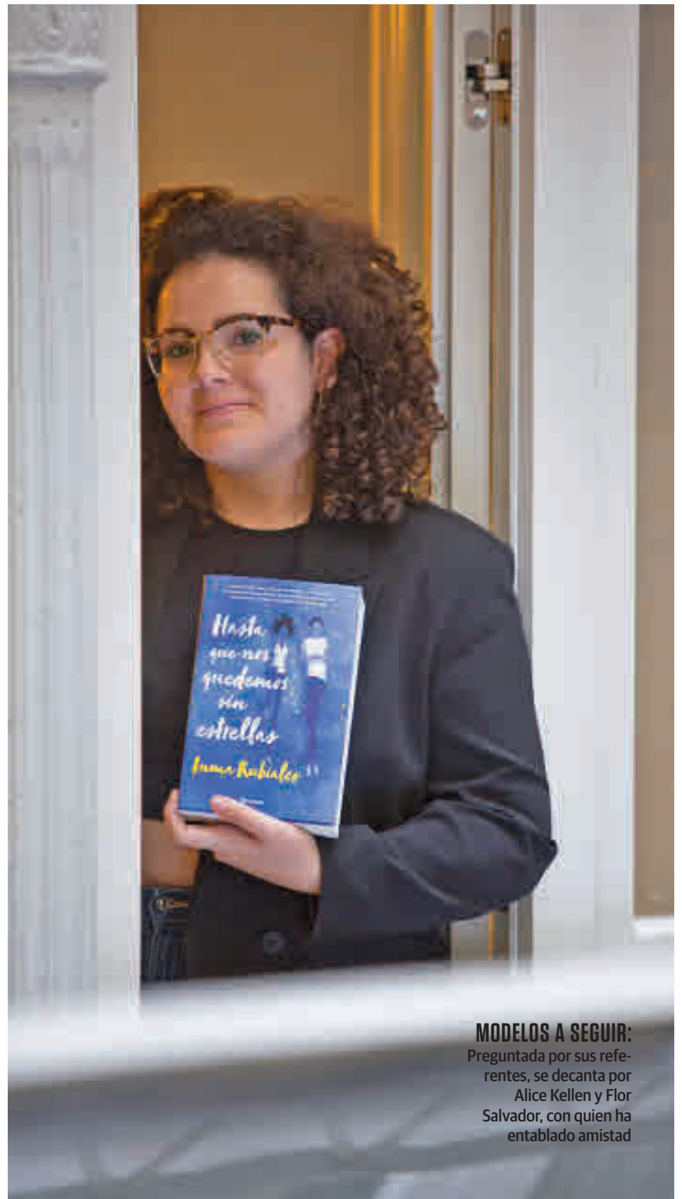
MODELOS A SEGUIR: Preguntada por sus referentes, se decanta por Alice Kellen y Flor Salvador, con quien ha entablado amistad

Esa es la razón por la que no ha dudado a la hora de introducir a la salud mental en su última novela. “Hay que normalizar hablar de salud mental sin tapujos ni tabúes; la literatura puede ser una