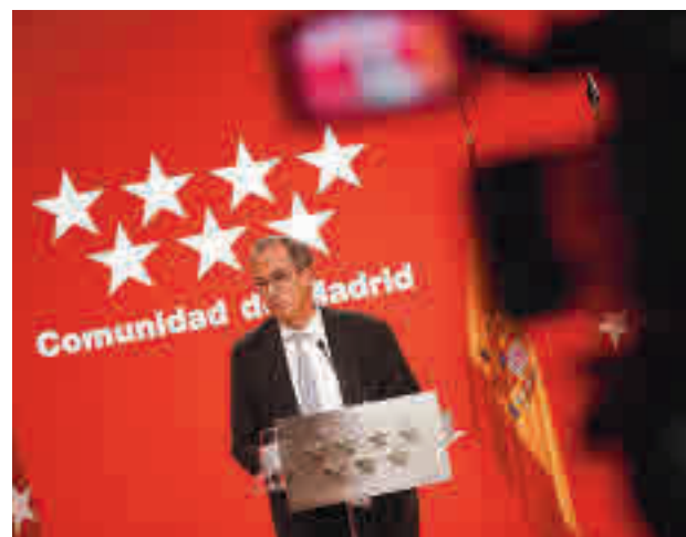
Comparecencia tras el Consejo de Gobierno

Los centros ofrecen alojamiento, manutención y una atención psicosocial orientada a la mejora de su autonomía personal y de su calidad de vida, promoviendo su integración.