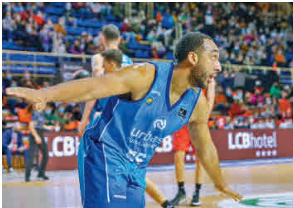
El Urbas volverá a jugar ante su público el martes 8

Una victoria en ese último choque no solo ayudaría al Urbas Fuenlabrada en su ca-