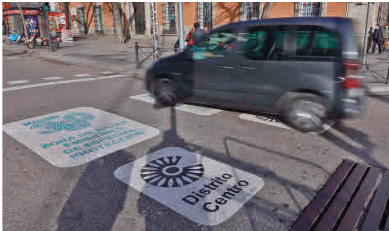
Madrid Zona de Bajas Emisiones (ZBE) limita progresivamente la circulación a los vehículos más contaminantes en la capital

Desde la entrada en vigor de Madrid ZBE, el pasado 1 de enero, y hasta el 24 de febrero, se han enviado 30.855 cartas a los infractores con las razones de las restricciones, la fecha prevista para su implantación y la cuantía a la que habría ascendido la sanción. La media de accesos diarios indebidos se sitúa en 1.454 vehículos, con más de 78.000 accesos en este periodo y una tasa de reincidencia del 31,7%.