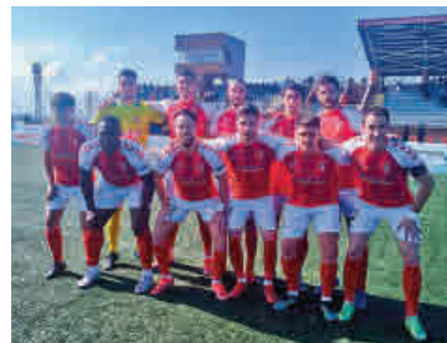
El partido entre Las Rozas y el Alcalá fue muy polémico

También se van clarificando las cosas en la zona baja, donde este domingo (11:30 horas) tendrá lugar un Villaverde San Andrés-AD Parla que puede catapultar a los visitantes o servir a los locales para seguir creyendo en la permanencia.