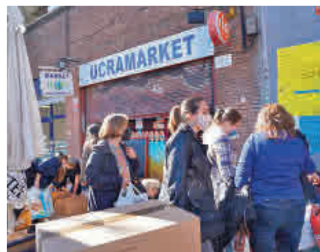
El almacén Ucrmarket, situado en el distrito de Arganzuela

Por otro lado, el Consistorio está canalizando la ayuda humanitaria que está recibiendo en las juntas de distri-