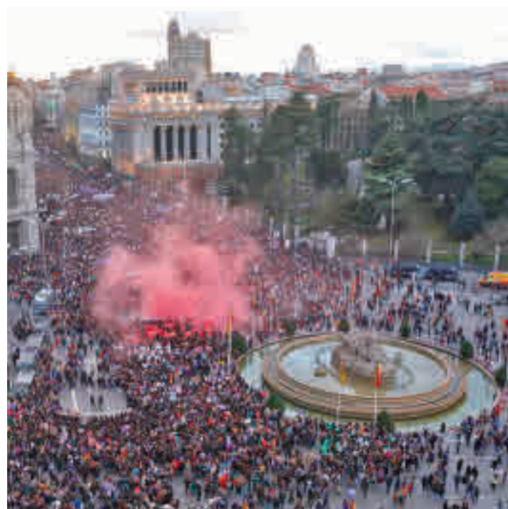
Vuelta a las calles: La celebración del 8 de marzo del año 2020 estuvo marcada por la presencia del coronavirus, ya que tuvo lugar solo una semana antes del confinamiento. El año pasado se tuvo que suspender, mientras que en la edición de este año las mujeres volverán a las calles.