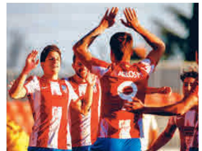
El filial rojiblanco continúa con su buena dinámica

tos al ascenso, Las Rozas, que visita en la tarde del domingo (18 horas) el campo de un Complutense que corre el riesgo de quedarse descolgado en la lucha por la permanencia. Otro partido destacado en la zona alta lo jugarán el Rayo Vallecano B y el Torrejón. Será este domingo (11 horas) en la Ciudad Deportiva franjirroja.