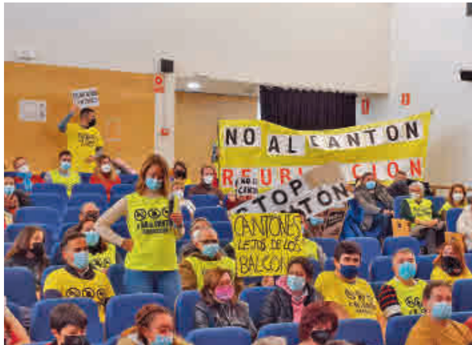
Los vecinos afectados, en el Pleno de la Junta Municipal de Latina

Este proyecto pionero tendrá una duración inicial de dos años, prorrogable a otros dos más.