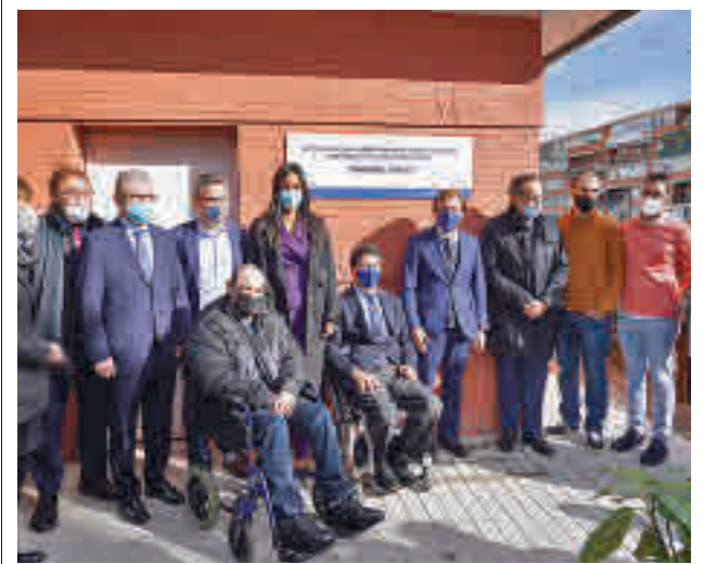
Un momento de la inauguración

gentedigital.es Toda la actualidad de los distritos de Madrid, en nuestra web