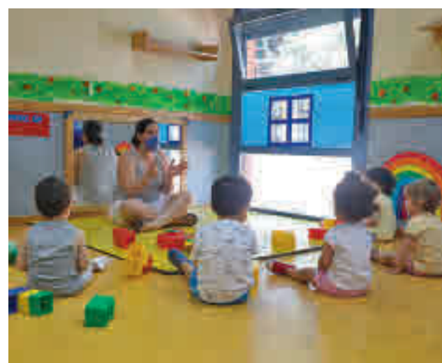
Escuela infantil en la Comunidad de Madrid