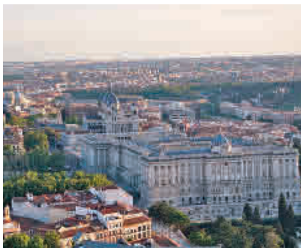
Una imagen aérea de la capital

El Ayuntamiento ha organizado un concurso internacional de proyectos para la creación de una nueva identidad visual para la capital. Según fuentes municipales, el objetivo es mejorar la percepción de la Marca Madrid ante prescriptores externos, a través de la medición de su impacto en los medios de comunicación y su valoración en índices y rankings internacionales. Esta iniciativa está abierta tanto a creadores individuales como a agencias y el plazo para presentar las propuestas se cierra el próximo el 21 de marzo. Cada participante podrá presentar