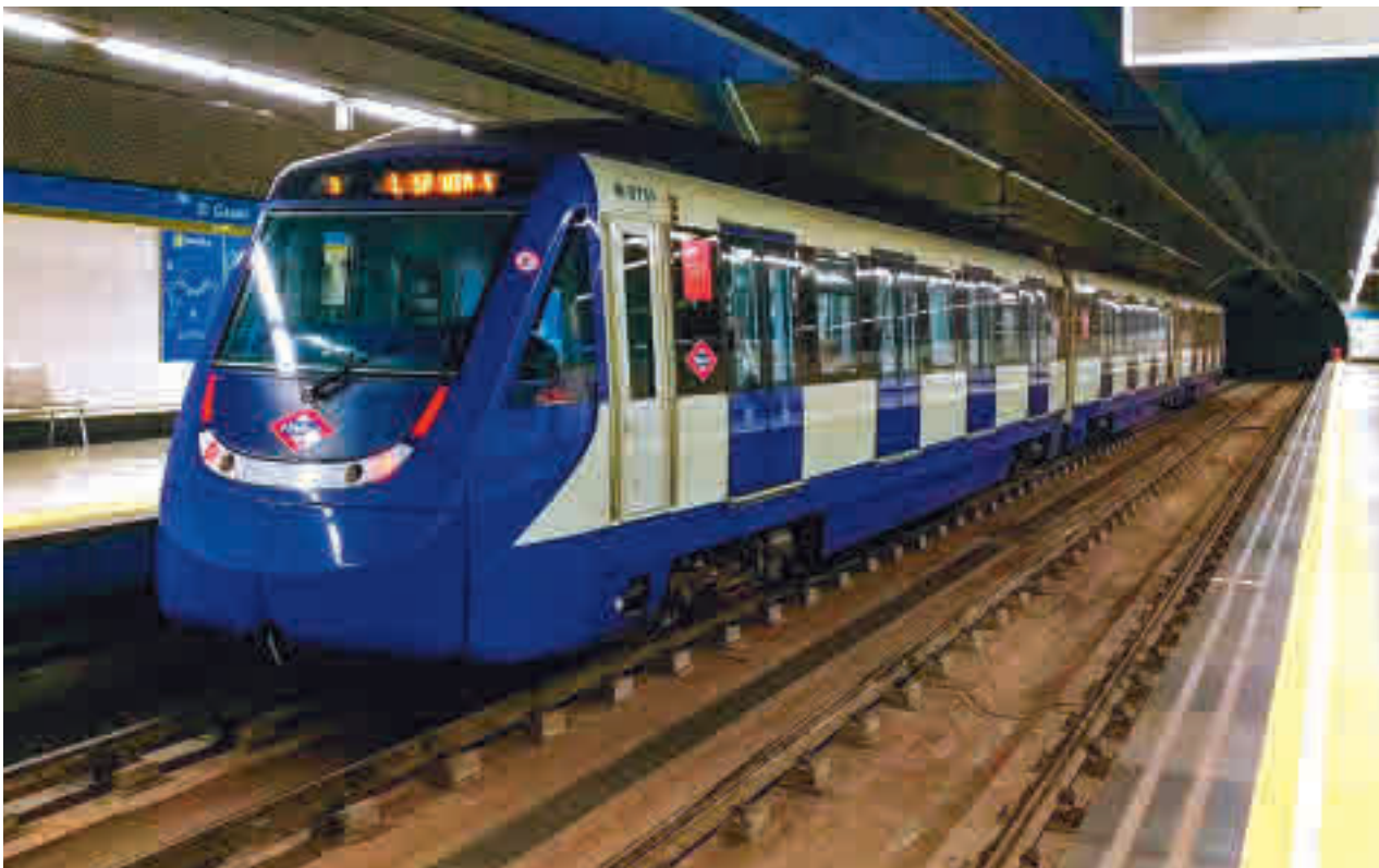
Estación de El Casar, en Getafe