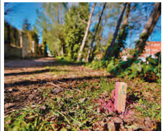
La zona de la futura actuación

gentedigital.es La actualidad de los municipios del Noroeste, en nuestra web