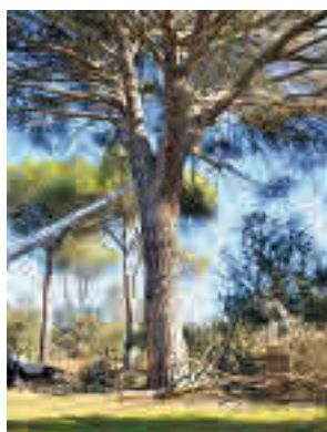
La zona de actuación

Después de haber actuado en las franjas de seguridad y cortafuegos, ahora se está trabajando en unas 20 hectáreas de monte.