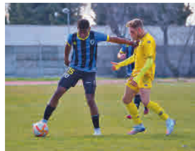
Parla y Alcorcón B tratan de huir del descenso

El miércoles 2 se jugarán varios partidos aplazados, como el Pozuelo-Villaverde, Torrejón-Moratalaz o el Complutense-Villaviciosa.