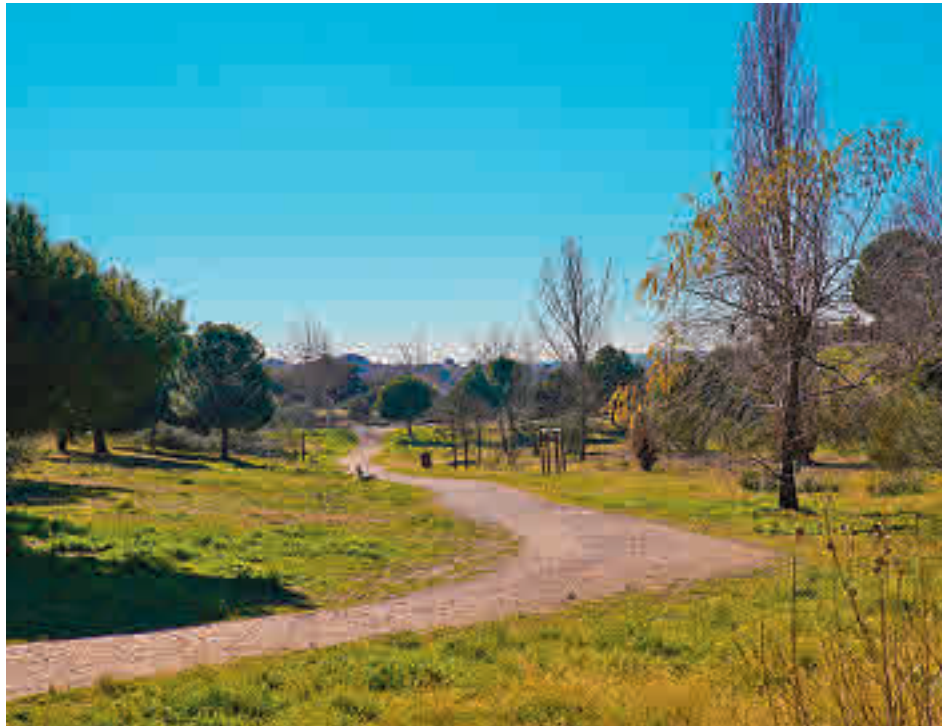
Parque urbano de El Lazarejo en Las Rozas

El objetivo de estas obras es mejorar el espacio urbano incrementando los elementos vegetales y garantizando la preservación de los existentes; mejorando los accesos y la pequeña red de caminos y senderos para un mejor disfrute del mismo por parte de los vecinos; renovando e incrementando las infraestructuras y equipamientos del área para aumentar su rango de uso o introduciendo sistemas que aseguren la sostenibilidad la zona, como riego automatizado o