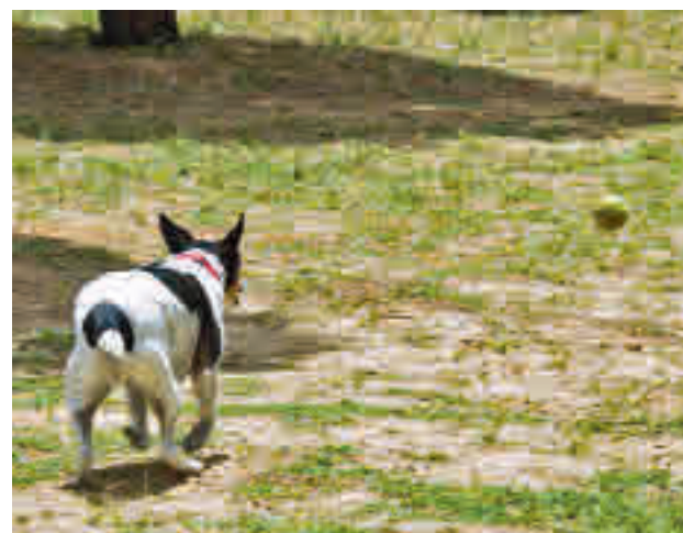
Un perro paseando por Pozuelo

Al igual que sucede con otros espacios dedicados a los perros en la ciudad, como el del Parque Peñalara, se delimitará con un vallado y dos puertas de acceso: una para público y otra para servicios de mantenimiento. Igualmente se crearán zonas estanciales adoquinadas en las entra-