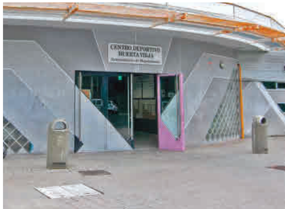
La entrada del Centro Deportivo Huerta Vieja

“Se tratan de unas obras muy importantes, ya que actualizan una estructura tan crucial en cualquier zona como es la de recogida de aguas”, asegura el alcalde de Las Rozas, José de la Uz.