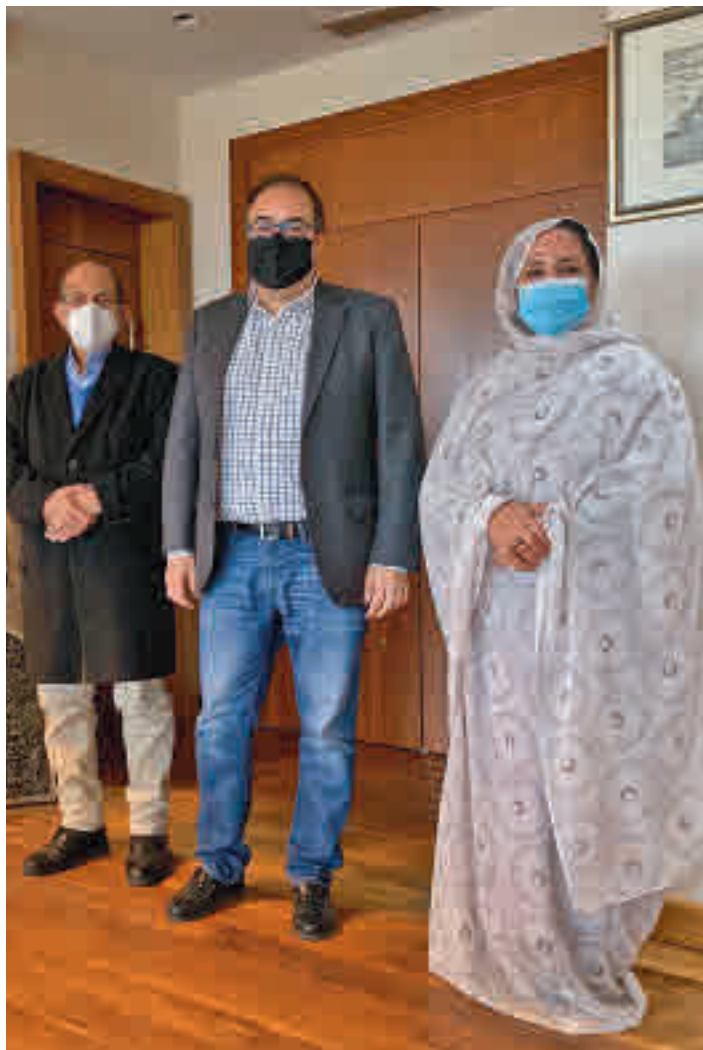
Recepción a los representantes saharauis

Durante el encuentro, el primer edil y la responsable de Cooperación transmitieron a los representantes saharauis el compromiso del Ayuntamiento de Leganés para continuar desplegando acciones de cooperación técnica en el Sáhara, como las desarrolladas en los últimos años. Leganés es una ciudad históricamente vinculada al Sáhara. Desde el propio Consistorio en primer lugar y posteriormente también con el apoyo de la Alianza de Municipios del Sur, programa de acción humanitaria en el que están presentes los ayuntamientos de Leganés, Getafe, Fuenlabrada, Móstoles y Al-