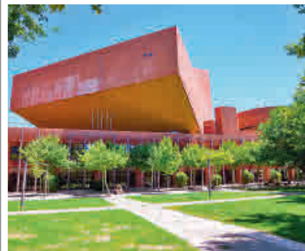
Universidad Carlos III en Leganés

gentedigital.es Toda la actualidad de Leganés, en nuestra página web