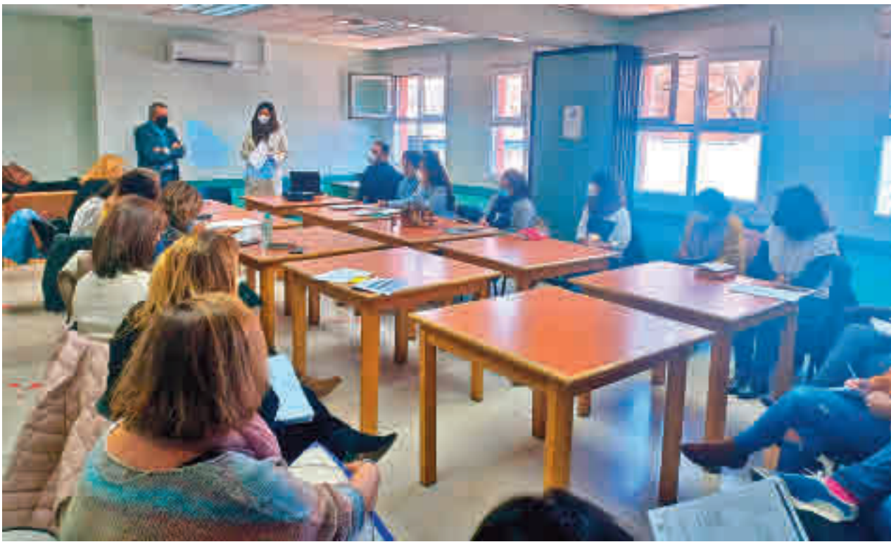
Acto de presentación de la Mesa de Empleo de Leganés