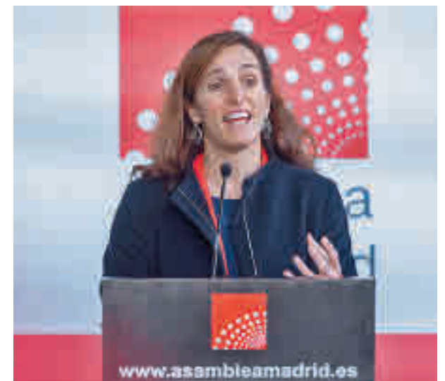
Mónica García, portavoz de Más Madrid

muy convencidos con el plan presentado por Díaz Ayuso. La secretaria de las Mujeres de CCOO Madrid, Lidia Fernández Montes, lo calificó de "puro acto de propaganda" e insistió en acabar con la precariedad del empleo femenino como única salida. "Ayuso nos vuelve a hacer un juego de manos con esta propuesta que en la realidad significa nada, que es la enésima vez que presenta y que está dotada en los presupuestos de 2022 con 29,6 millones de euros", añadió.