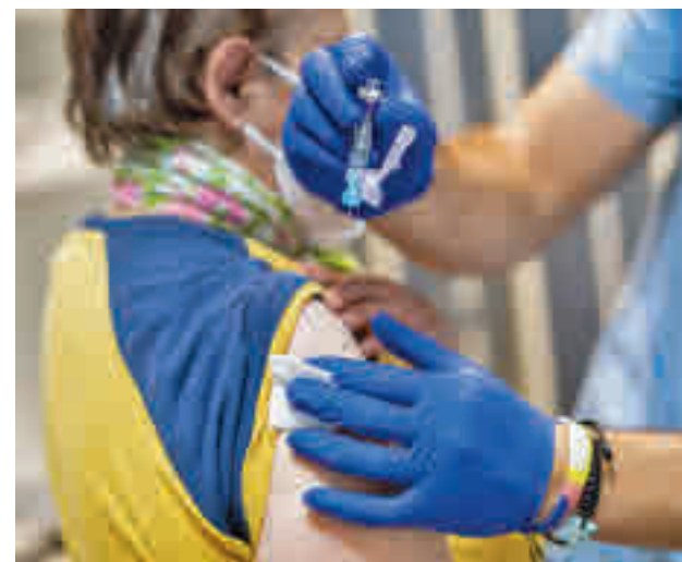
La campaña de vacunación sigue vigente