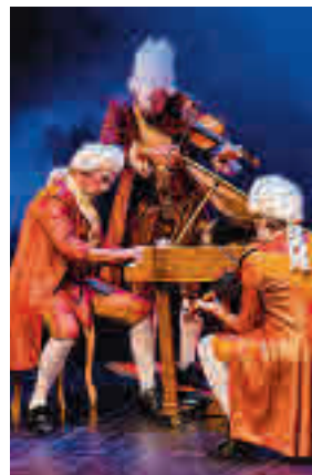
'Maestrissimo' de Yllana

'Vidas enterradas' es el título de una serie de reportajes de la Cadena Ser. Partiendo de ese material, las compañías Corsario, L'OM-Imprebis, Micomicón y Temple