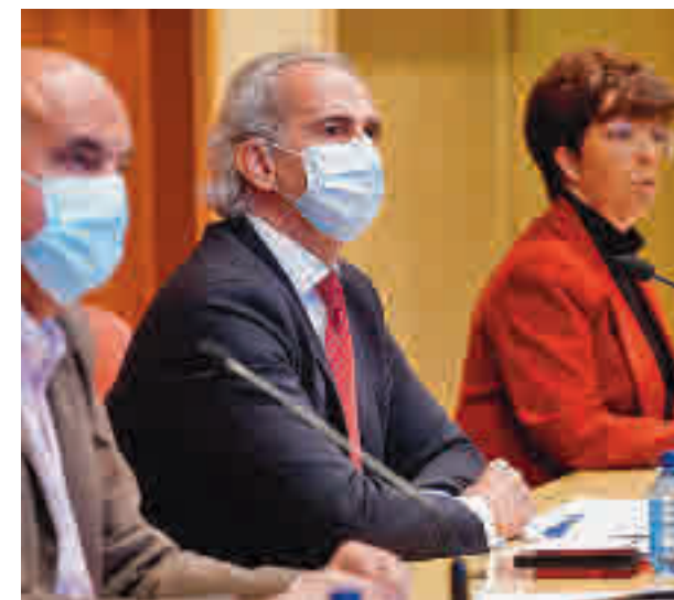
Ruiz Escudero, durante la rueda de prensa

mente entre las personas más vulnerables. En este marco, se enviarán 330.000 SMS para promover la administración de la tercera dosis al grupo de población con edades entre 60 a 69 años y pacientes con factores de riesgo. Escudero dejó en manos de la Comisión de Salud Pública la posibilidad de reducir las cuarentenas a cuatro días, en lugar de los siete actuales, como han solicitado los empresarios madrileños para paliar el efecto negativo de las bajas laborales en la economía.