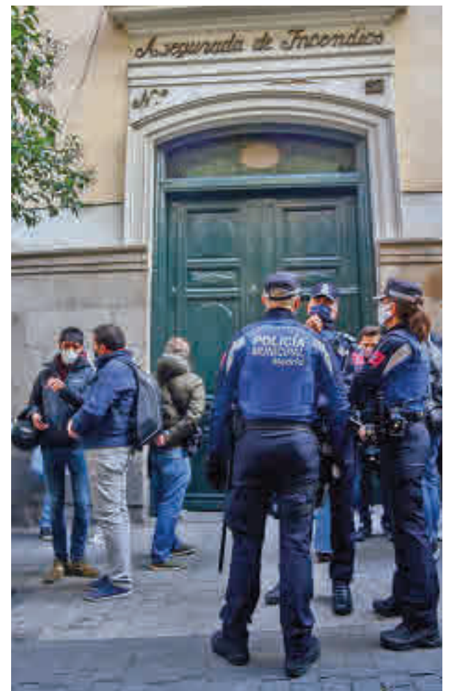
Concentración contra un desalojo en Madrid

López ha pedido al Ejecutivo central que tome más medidas en este aspecto, acusándoles de "simpatizar" con los infractores.