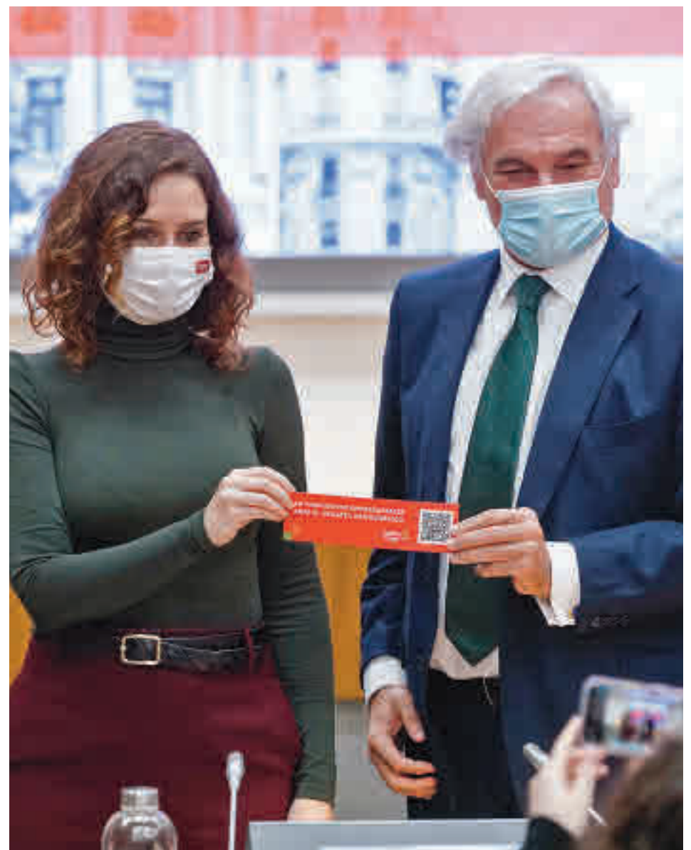
Ayuso presentó la estrategia en una escuela infantil

Se dará prioridad en el Plan Vive a las mujeres embarazadas y familias con hijos hasta los 35 años. Se incluye también la ampliación de hasta 1.200 euros en el IRPF en el alquiler de vivienda habitual para jóvenes menores de esa