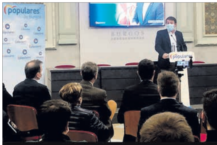
Alfonso Fernández Mañueco durante su intervención en el acto, en Burgos, el día 27.