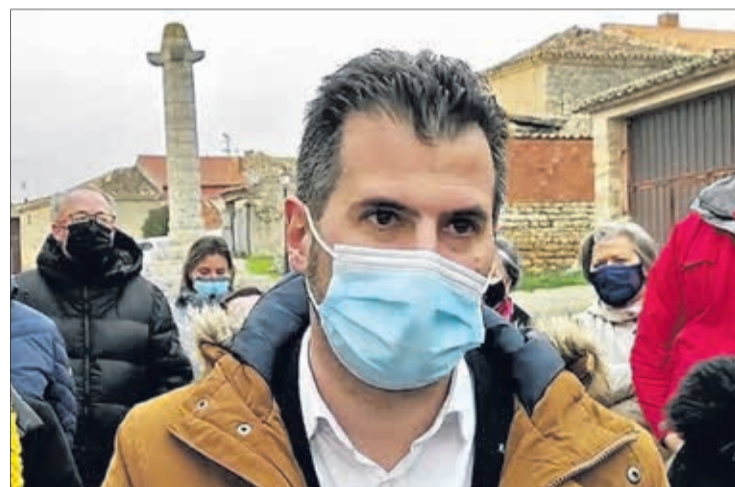
El secretario general del PSOE de CyL, durante su intervención el día 28.

Por eso, se mostró convencido de que “este es el momento electoral en el que tenemos que aprovechar la oportunidad”, ya que lo que ha sucedido es que el PP “ha desmantelado la sanidad y la Atención Primaria en el medio rural y ahora va a tratar de prometer lo que no ha hecho estos dos años y medio”.