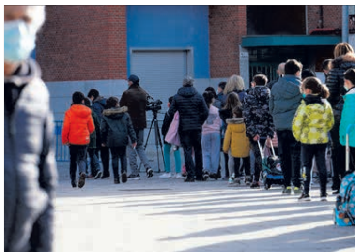
Los menores de 12 años han sido los últimos en sumarse a las campañas de vacunación.

En esos días estaba concluyendo la primera fase de la cam-