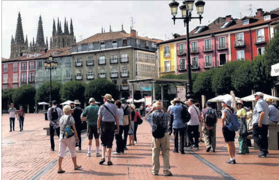
Imagen de turistas visitando la ciudad de Burgos.

Del mismo modo, el decano del Colegio de Economistas destacó el sector de la automoción, que venía de un año 2020 “catastrófico”, siendo uno de los que “más sufrió”. Sin embargo,