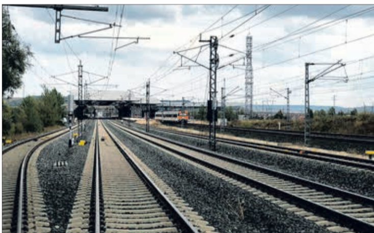
La Agencia Española de Seguridad Ferroviaria (AESF) debe autorizar la puesta en servicio de la línea para explotación comercial.