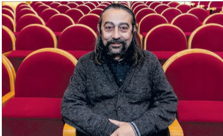
Adolfo García-Sastre es miembro de la Academia Nacional de Ciencias de los Estados Unidos.

García-Sastre explicó entonces que no hay tiempo para pensar "si en cada una de las fases de estas vacunas se va a dar lugar a un producto comercial", que es lo que normalmente ocurre, generándose "muchas discusiones" sobre si merece la pena emplear el dinero en función del mercado, y cuánto va a ganar la empresa. "Esas con-