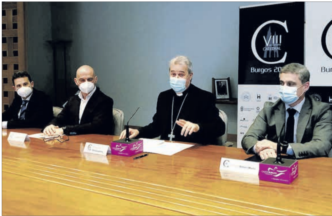
Firma del convenio de colaboración entre las tres entidades, el lunes 27.

Por su parte, el arzobispo de Burgos, Mario Iceta, agradeció durante la rueda de prensa la renovación de este convenio de colaboración, ya que ha habido "muchas" actividades que