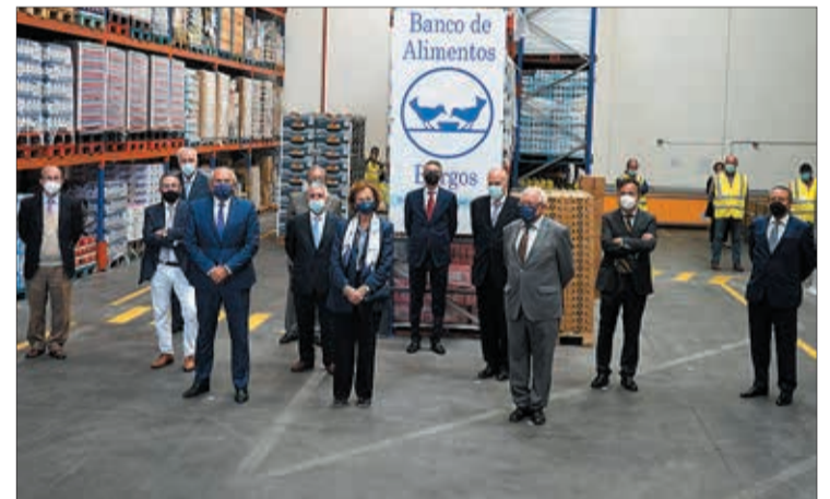
Foto de familia en las instalaciones del Banco de Alimentos de Burgos.

El encuentro se inscribía, a iniciativa de S.M. la Reina Doña Sofía, en el marco de colaboración que su Fundación mantiene desde el año 2012 con los Bancos de Alimentos de toda España, con el fin de conocer sus necesidades. A través de esta colaboración, el Banco de Alimentos de Burgos ha podido dotar de un equipo de refrigeración a una de sus furgonetas para el transporte de alimentos perecederos y recibe anualmente donaciones de productos básicos indispensables.