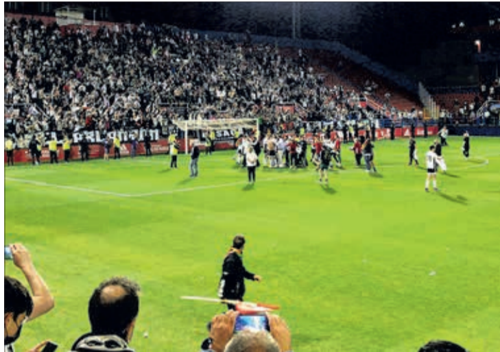
Imagen del Burgos C.F. en Almendralejo.