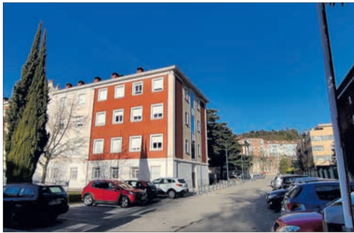
Se adecuarán las condiciones del convenio especial firmado en 2018 y prorrogado en 2020.

Además de la revisión de las condiciones de financiación del