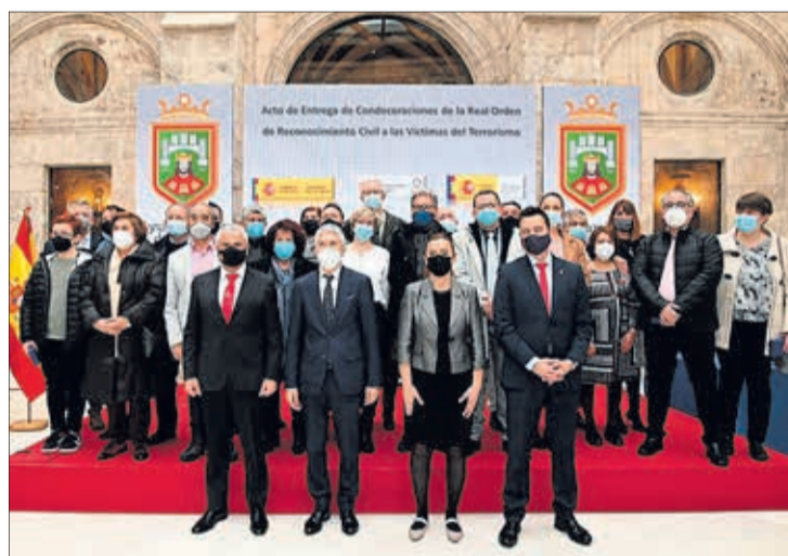
Foto de familia en el acto de Reconocimiento Civil a las Víctimas del Terrorismo.

tes de que diese comienzo el acto de entrega de dos grandes cruces y veintidós encomiendas de la Real Orden de Reconocimiento Civil a las Víctimas del Terrorismo, que tuvo lugar en el Monasterio de San Juan, el lunes 29 de noviembre. En este contexto, y acompañado de la delegada del Gobierno en Castilla y León, Virginia Bar-