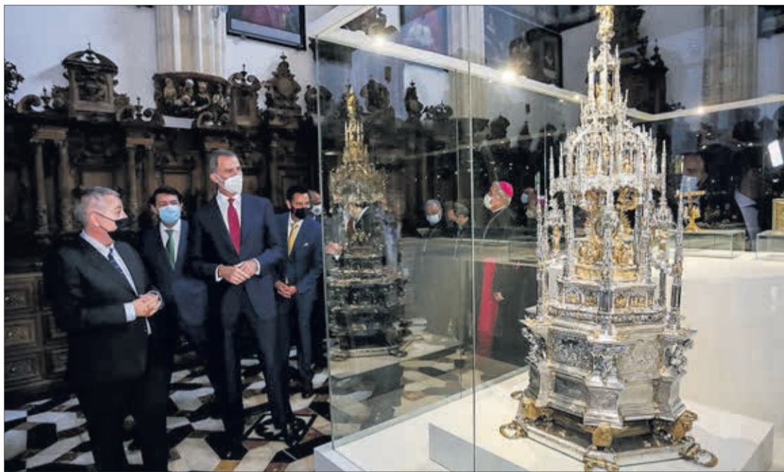
El Rey mientras contemplaba una de las obras expuestas en la exposición 'LUX', el 29 de junio.

Tras visitar la muestra durante más de hora y media, Don Felipe dejaba escrito en el Libro de Honor de la exposición lo "impresionado" que estaba "por la maravilla que la nueva edición de las Edades del Hombre había reunido en Burgos para celebrar tanto los ocho siglos de la historia de esta Catedral como el nuevo Año Santo Jacobo". "Quiero felicitar a todos los que han trabajado y apoyado esta nueva muestra espectacular de nuestro arte sacro y nuestro patrimonio cultural. Estoy seguro de que será un éxito y pondrá en valor sus valio-