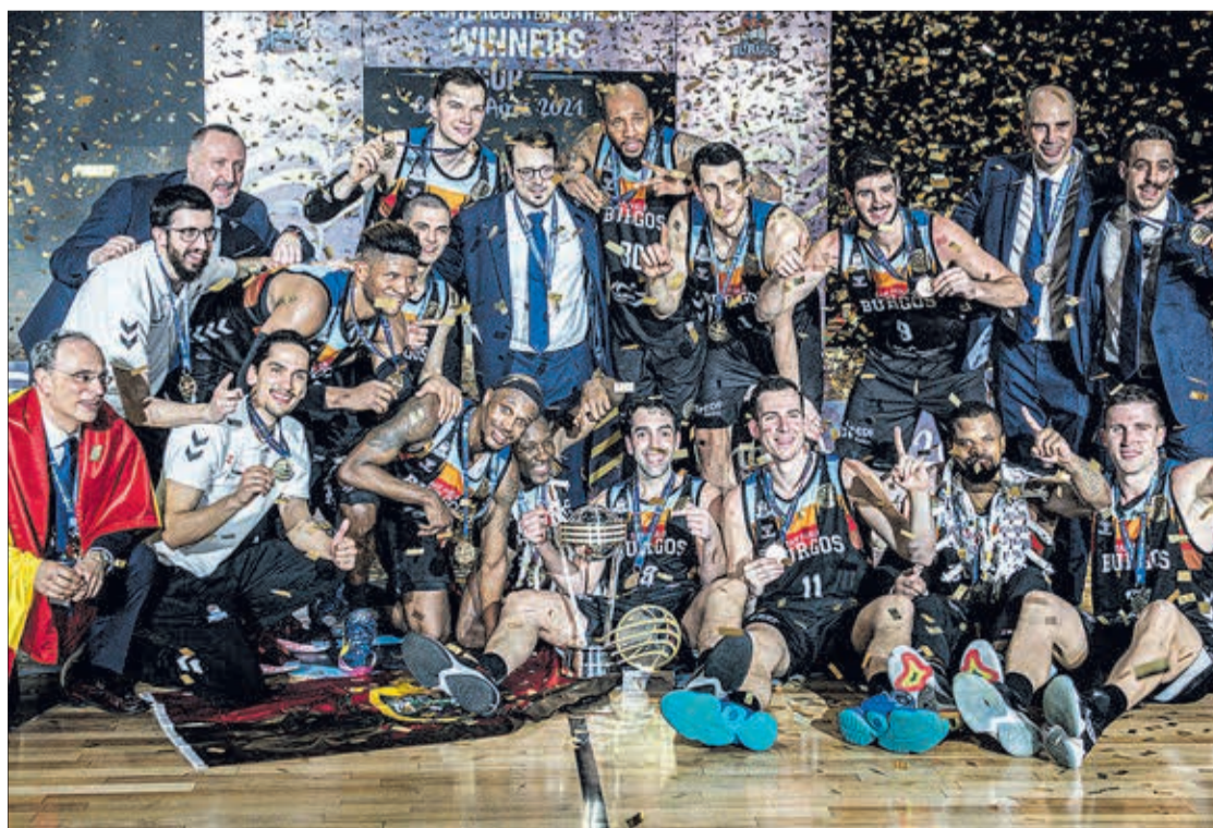
El Hereda San Pablo Burgos, campeón de la Copa Intercontinental de la FIBA en Buenos Aires.

El equipo de Joan Peñarroya logró en mayo su segundo título de Basketball Champions League