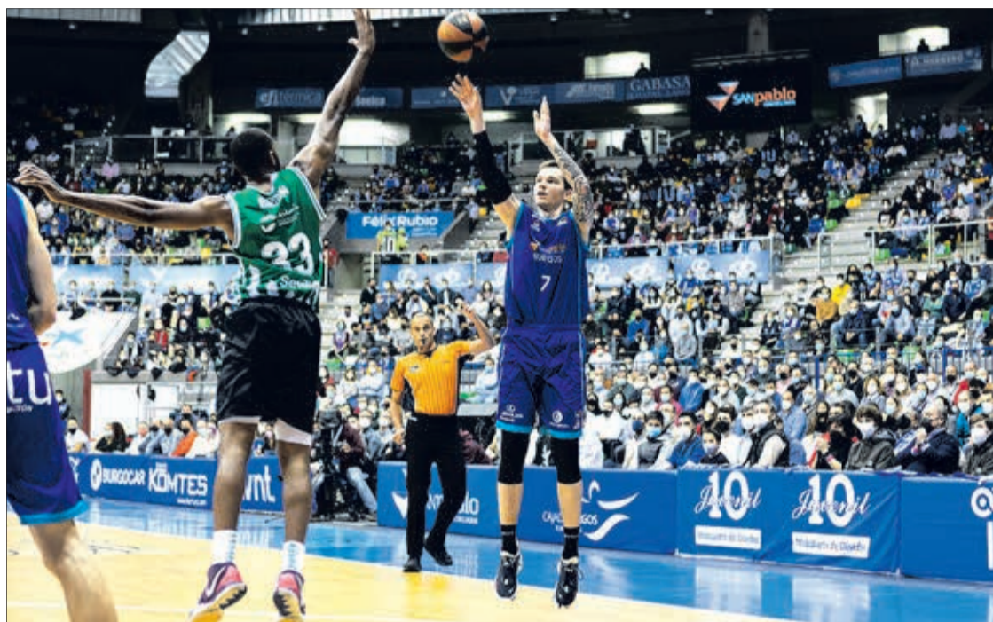
Hereda San Pablo sufre una nueva derrota liguera en el Coliseum ante el colista Real Betis.