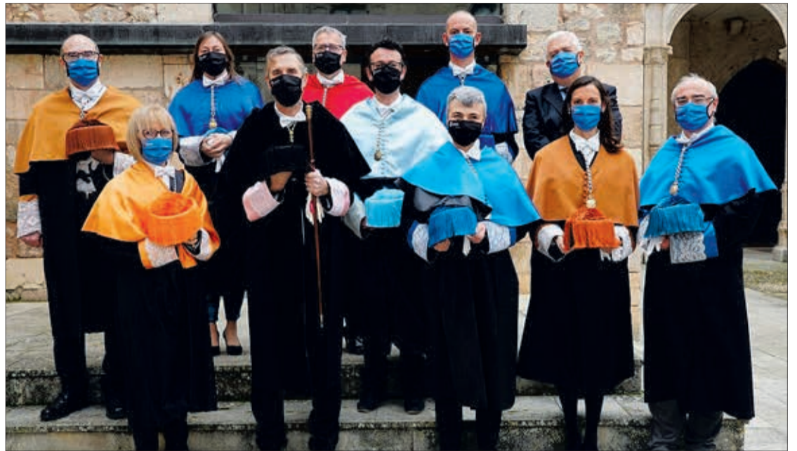
Foto de familia del nuevo equipo rectoral de la Universidad de Burgos el pasado mes de enero.

El rector también aprovechó su intervención para hacer un breve repaso del pasado mandato. Puso en valor que la UBU ha logrado los "mayores niveles" de