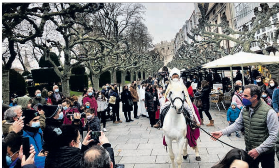
El Obispillo paseó a lomos de un caballo blanco a lo largo del Paseo del Espolón, entre los aplausos de la gente, el día 28.

LA ESCOLANÍA DE LOS PUERI CANTORES CELEBRA SU 25º ANIVERSARIO Y EL OBISPILLO ASEGURA QUE MANTIENEN LA ILUSIÓN DEL PRIMER DÍA