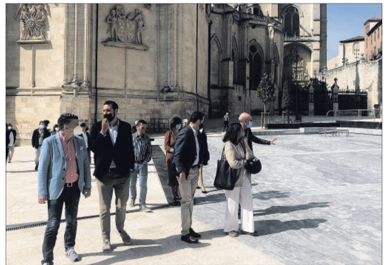
El alcalde de la ciudad visitó junto a otros corporativos el nuevo espacio, el 31 de mayo.

En este contexto, el alcalde también se pronunció con respecto al antiguo Asador de Aranda. Esperaba que se convirtiese en el "futuro" Centro de Interpretación del Camino de Santiago, si bien reconocía que no se encontraba dentro de las "prioridades inmediatas" del ejecutivo. El coste de esta primera fase se adjudicó por 1,5 millones de euros, que tras un modificación que respondía al cambio de modelo de contenedores soterrados dejó el coste final en 1,6 millones de euros.