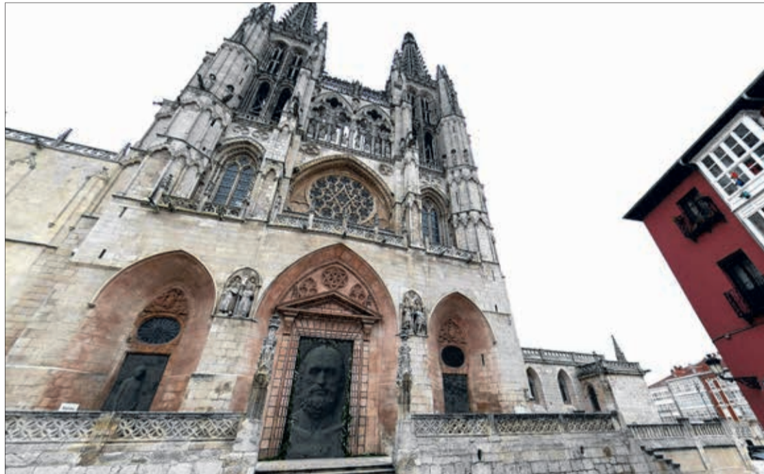
Recreación facilitada por el Arzobispado de Burgos con las nuevas puertas de Antonio López para la Catedral.