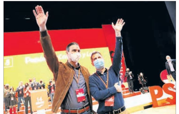
Pedro Sánchez y Luis Tudanca, en el Fórum Evolución, el 27 de noviembre (Foto: PSOE CyL).

El presidente del Gobierno señaló que su "meta es ofrecer un horizonte de progreso y bienestar social a todos los ciudadanos, independientemente de dónde vivan, porque es el Estado el que debe acercarse a los vecinos". De ahí, dijo, la apuesta de los socialistas por la descentralización de servicios para que lleguen a todos los territorios. "Mientras fuera nos miran con orgullo, dentro de casa, la derecha y la ultraderecha nos critican y votan en contra de la recuperación justa", lamentaba.