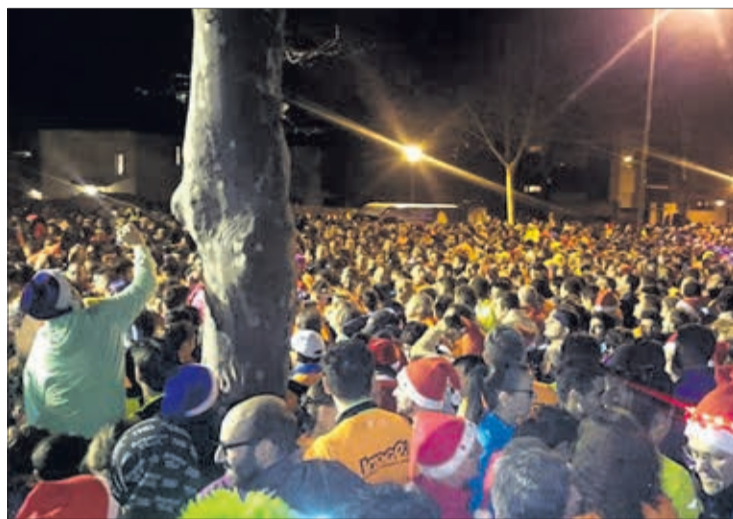
Imagen de una de las últimas San Silvestres que se pudo celebrar.

Sobre el resto de actividades del programa de Navidad, se es-