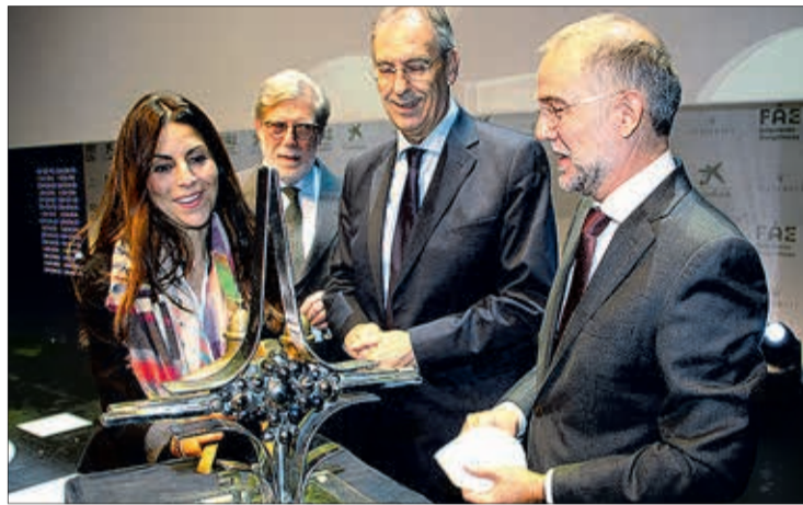
Imagen de los galardonados, en el Fórum Evolución.

Por su parte, Benavente reconocía durante su intervención que FAE era, al fin y al cabo, una "gran familia, la familia de las empresas burgalesas". "Esa familia cuyos miembros se apoyan, se ayudan y se cuidan. Esa familia que rema hacia un único horizonte, que es-