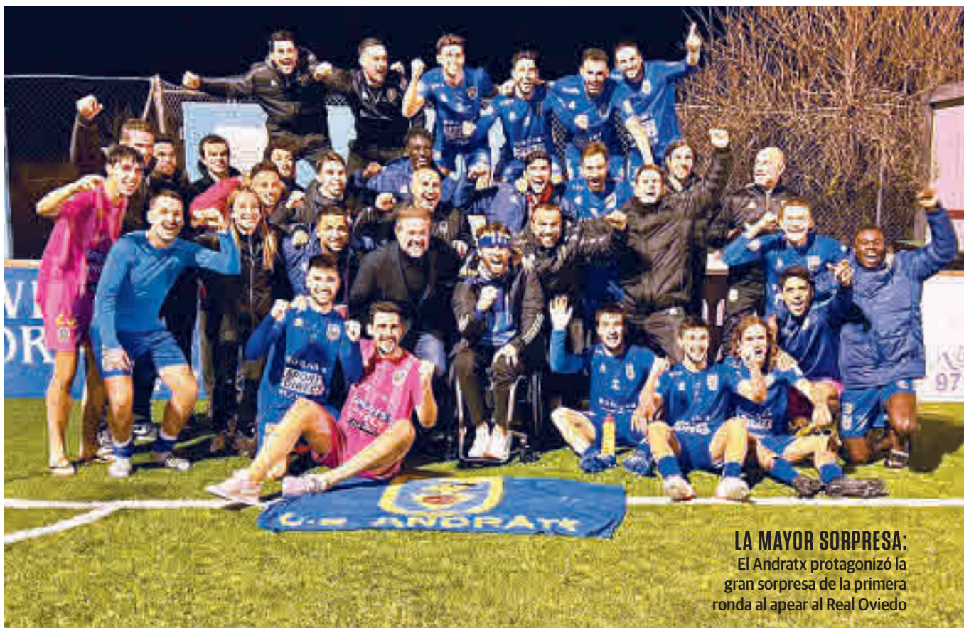
LA MAYOR SORPRESA: El Andratx protagonizó la gran sorpresa de la primera ronda al apeaar al Real Oviedo