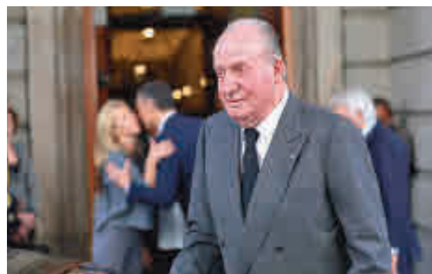
El Rey emérito

dres. En su demanda, la que fuera amiga íntima del monarca pidió a los tribunales que reclamaran al Rey emérito una indemnización por los costes de su tratamiento médico de salud mental, por la "instalación de medidas de seguridad personal y servicios diarios de protección" y