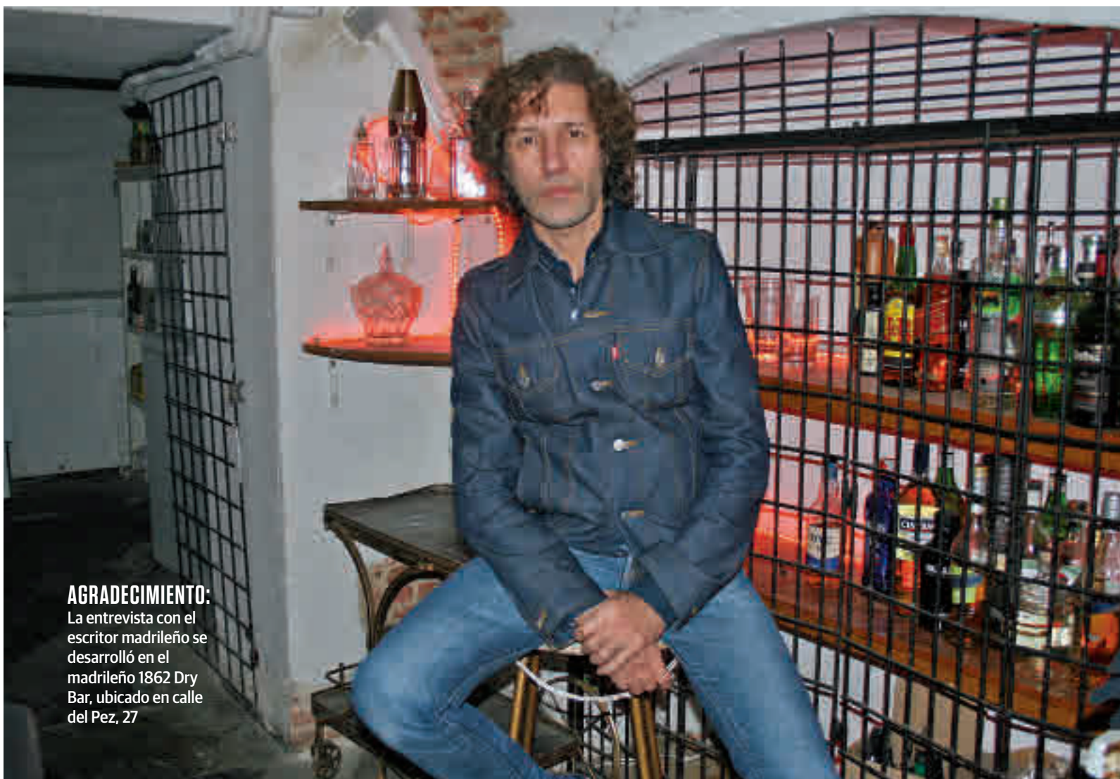
AGRADECIMIENTO: La entrevista con el escritor madrileño se desarrolló en el madrileño 1862 Dry Bar, ubicado en calle del Pez, 27

Fue un fenómeno plural y democrático”, argumenta antes de explicar que ese ejercicio de reduccionismo, a su juicio, se debe a que “la foto de los modernos vendía más, mola, era más chula, más pintona, pero La Movida fue mucho más diversa”. Por ese motivo ha incluido a “los heavies, los flamencos sacrílegos con la tradición, los cantantes melódicos, los directores del cine quinquí, los cantantes