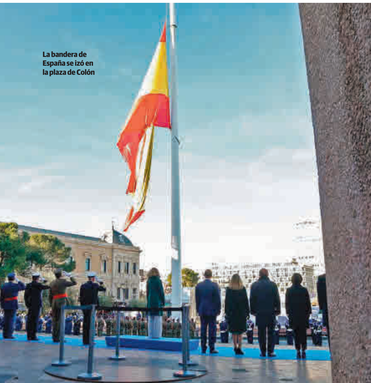
La bandera de España se izó en la plaza de Colón