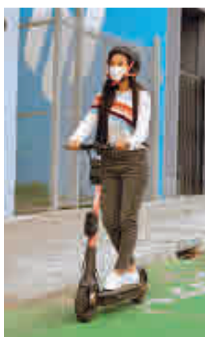
Nuevo modelo del patinete

inteligencia artificial, el nuevo cerebro de los patinetes eléctricos de Spin estudiará cada movimiento que haga el usuario. De no hacerse bien, el vehículo eléctrico comenzará a pitar. Con un sistema de sensores, cámaras tra-