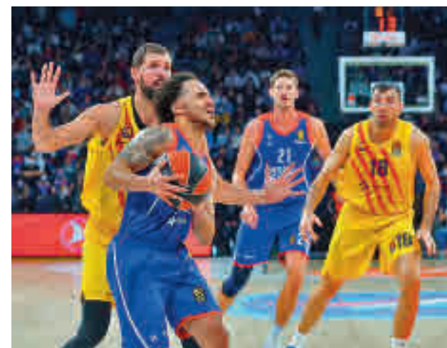
Efes y Barça protagonizaron un duelo vibrante

Por su parte, el Real Madrid arrancará la semana recibiendo el martes (20:45) al Alba Berlín, para visitar el jueves (20:30) la complicada pista del Armani Exchange Milan.