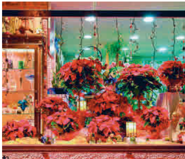
Imagen de un escaparate de años anteriores

Los establecimientos interesados en participar deben rellenar el formulario que encontrarán en la web municipal, www.alcobendas.org , donde también están las bases completas. Los comercios que se adhieran recibirán va-