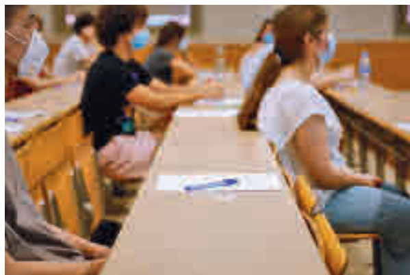
Clases de español

rismo y Deporte, Marta Rivera de la Cruz, en su entrevista a Europa Press. En el mundo hay 22 millones de personas que estudian el español y a Madrid solo vienen 17.000 hasta ahora. "Ahí hay un mercado que hay que conquistar y muchí-