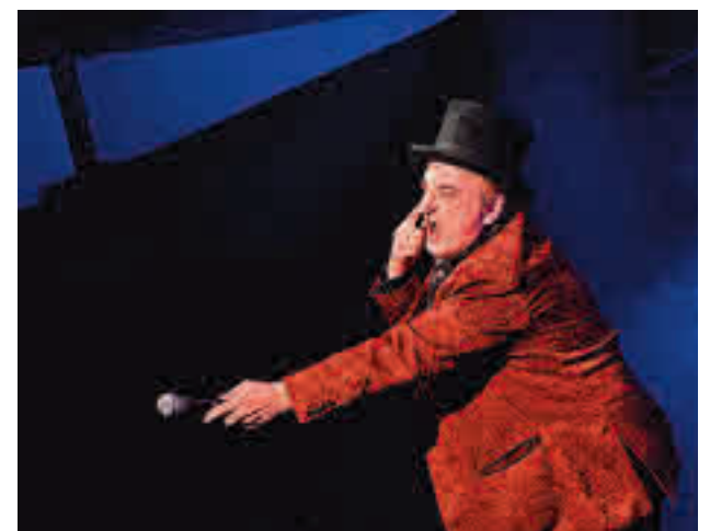
La Orquesta Mondragón, uno de los participantes