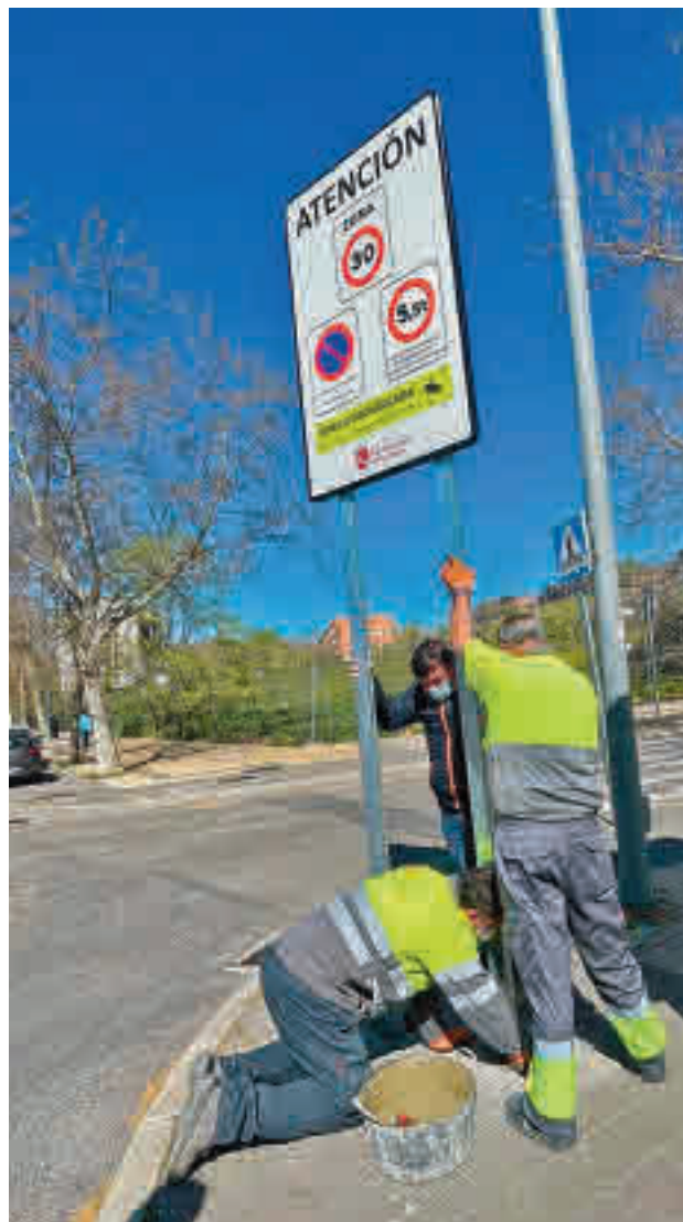
Señalización de la Zona 30 en el barrio

En este sentido, los vecinos fueron informados de dos no-