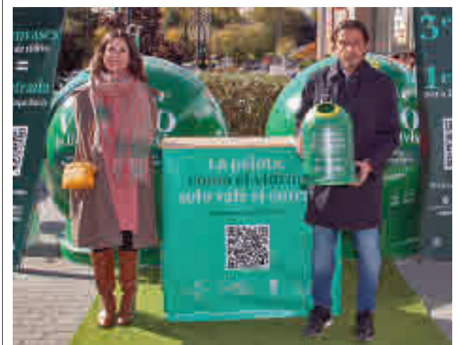
Presentación de la iniciativa