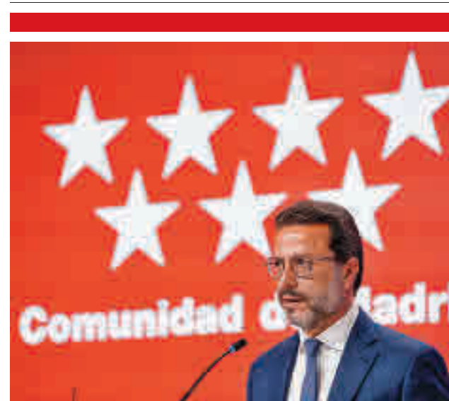
Presentación de la rebaja fiscal