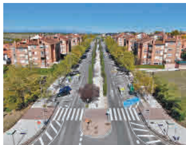
Aspecto actual de la avenida

Además, se ha realizado el retranqueo de la acera de los pasos de peatones para