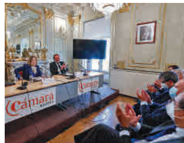
Firma del convenio