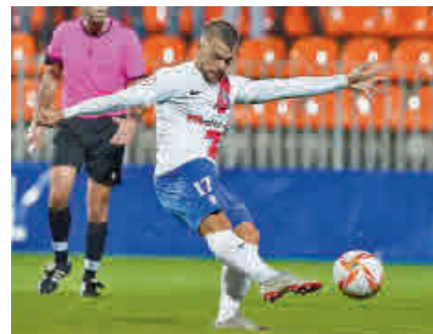
El Rayo cayó como local ante el Racing de Ferrol

Quien sí jugará como local es el San Sebastián de los Reyes, que recibirá (12 horas) al duodécimo clasificado, el Real Unión de Irún.