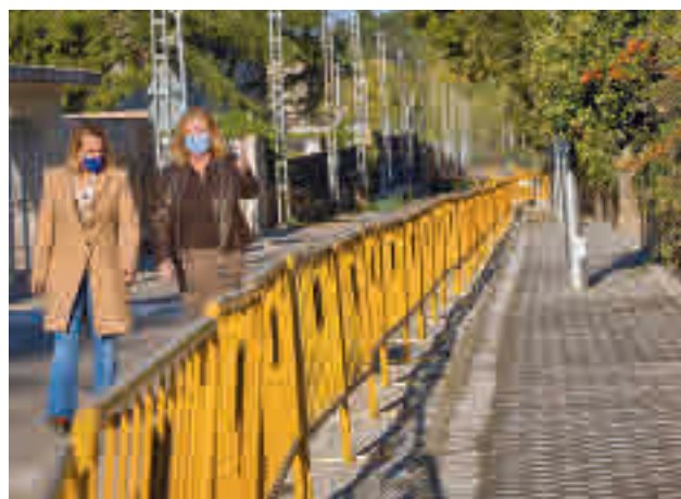
Visita institucional a la zona

Actualmente, según datos municipales, en la capital hay un total de 940 terrazas