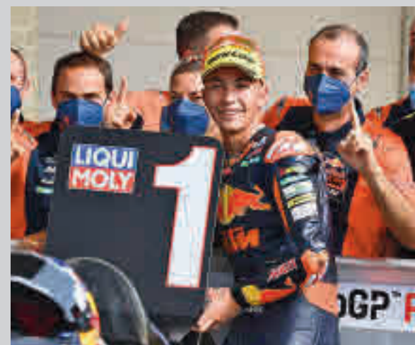
Fernández es el piloto con más victorias en Moto2 (7)

La derrota encajada en la pista del Juaristi ISB descolgó momentáneamente al Movistar Estudiantes de la carrera por el liderato. Este domingo (12:30) recibe en el WiZink al CB Prat.