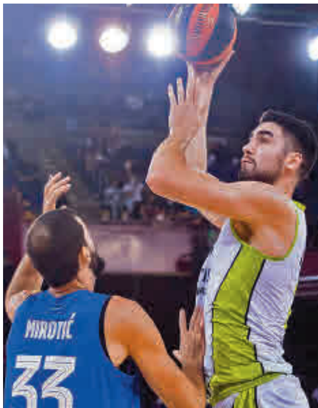
El Urbas dejó buena imagen en Barcelona

Con esa delicada situación en la tabla, al Urbas no le queda más remedio que apelar a su mejor versión para un tramo del calendario realmente complicado: después de la visita al Palau, este sábado (18 horas) abre la jornada viajando a la pista de un