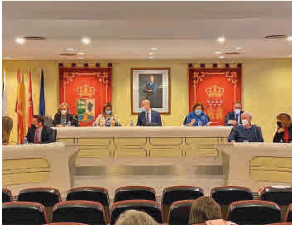
Pleno del Ayuntamiento de Majadahonda