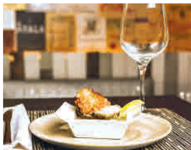
Tapa y consumición costarán 4 euros