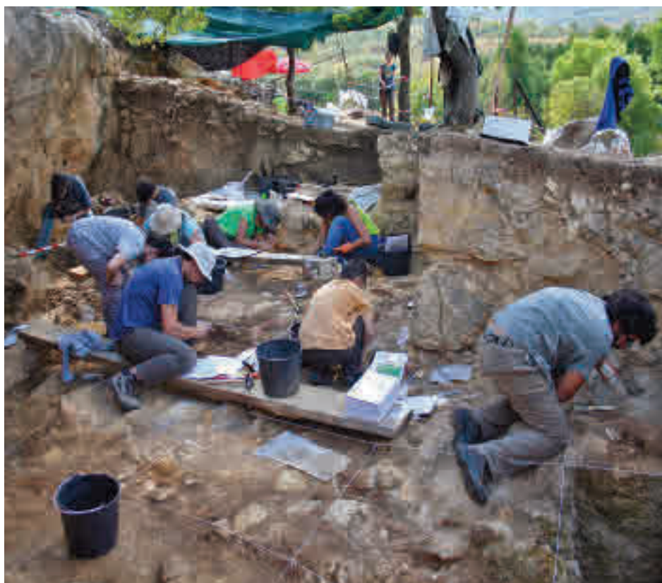
Excavación arqueológica en La Pinilla

Ayuso hizo hincapié en que las excavaciones realizadas desde finales de la década de los 70 hasta hoy mismo han permitido encontrar valiosos restos fósiles y situarlo como uno de los más ricos de España. "Extraer toda la riqueza aquí nos ha permitido descubrir que lo que hoy es un tranquilo pueblo de la sierra, hace unos 100.000 años, fue el