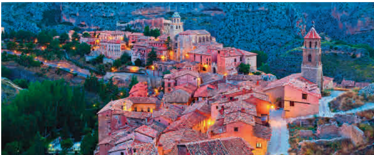
Algunos municipios asumen resignados el proceso de despoblación