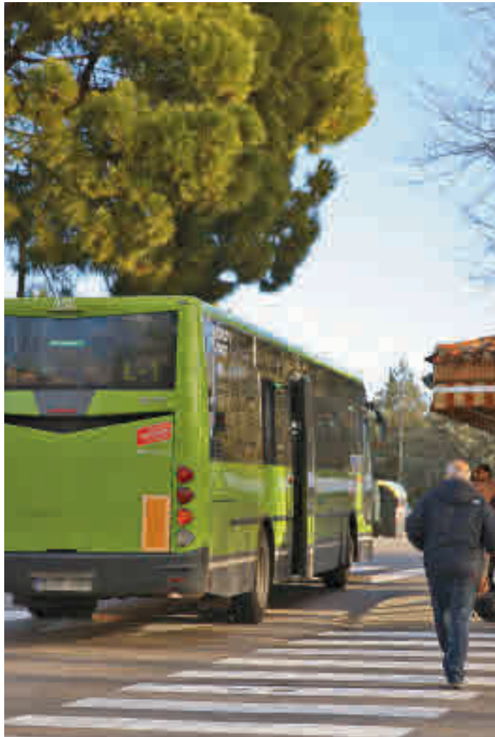
Uno de los autobuses urbanos que recorren Las Rozas

Por otro lado, en lo que se refiere a las líneas urbanas de la localidad, cofinanciadas al 50% entre la Comuni-