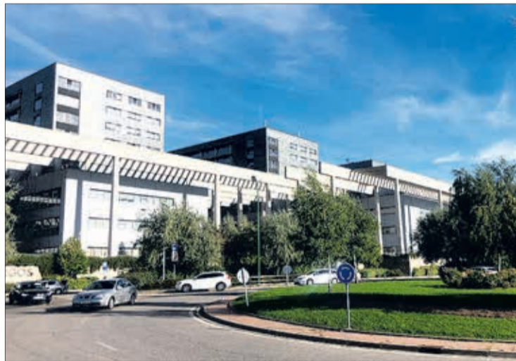
Imagen del Hospital Universitario de Burgos (HUBU).

En este sentido, criticó que el ejecutivo autonómico esté “desnortado” y explicó que a pesar de la “satisfacción” del grupo parlamentario socialista por la