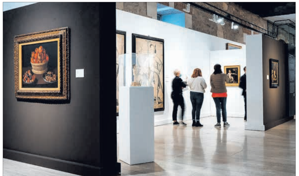
La exposición permanecerá abierta hasta el 30 de enero, en Cultural Córdón.

La muestra se encuentra dividida en cinco secciones: 'Del natural artificio. El bodegón como género pictórico. Imagen y encarnación de una reali-