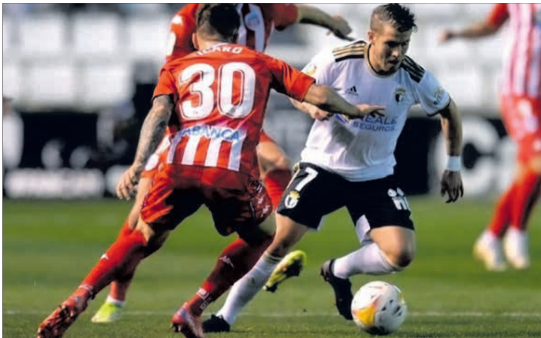
El conjunto burgalés encadena tres jornadas consecutivas sin perder en liga.