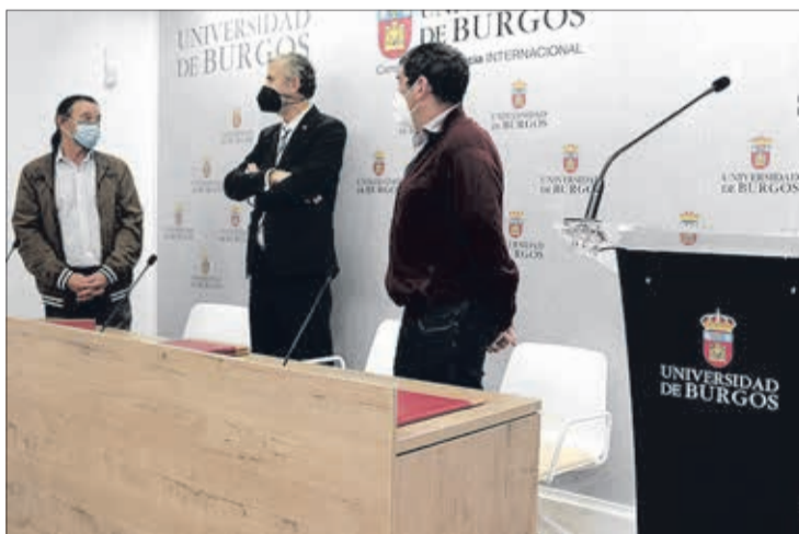
Representantes del convenio suscribió el martes 26, en la UBU.