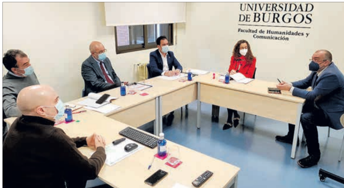
Reunión de trabajo mantenida entre responsables de la Junta y de la Universidad de Burgos, el miércoles 27.

Con el objetivo de que se conozca la historia y no se cometan los mismos errores