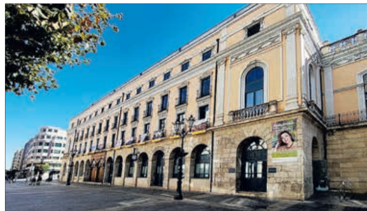
El IMCyT, con sede en el edificio que alberga el Teatro Principal, se constituyó en 1997.

En relación con Fomento, el alcalde señaló que “se integrará en el Ayuntamiento como el resto de