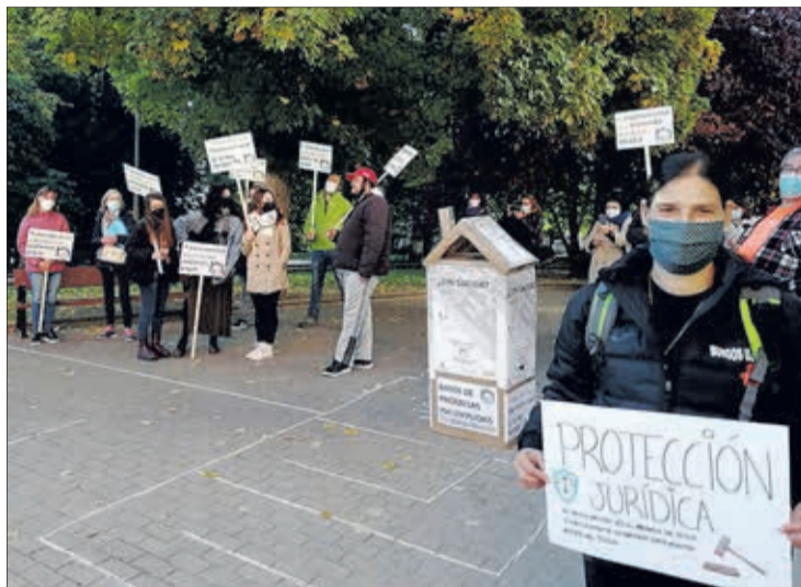
Acto de calle el jueves 28 para visibilizar “el laberinto” al que se enfrentan los que, por carecer de vivienda, están privados de otros derechos.