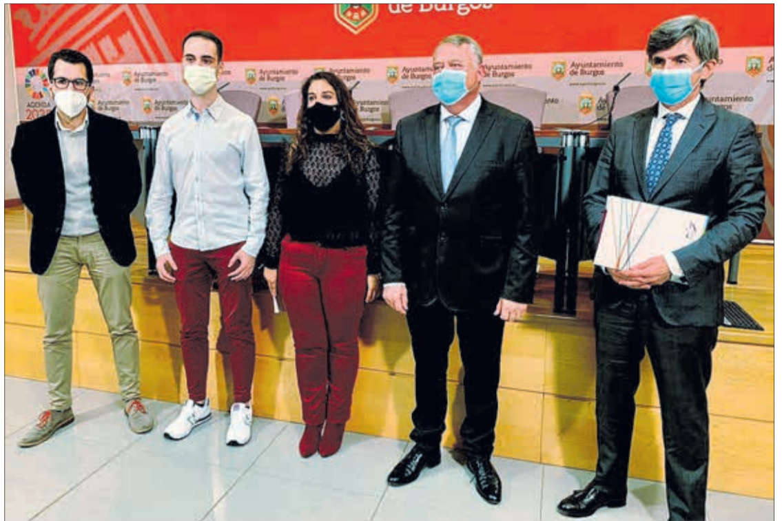
Presentación de los finalistas del Premio Joven Empresario Burgos 2021 el lunes día 25 en la sala de prensa del Ayuntamiento.