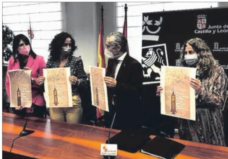
Presentación de la campaña de vacunación contra la gripe, el lunes 25.

En este sentido, Saiz puso de relieve que la “instrumentalización” en esta ocasión será más “complicada” al coincidir la administración de más de una vacuna, por lo que se va a implementar el