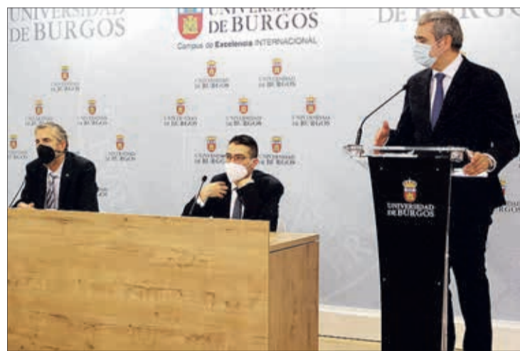
Presentación del convenio entre ambas instituciones el martes 26.