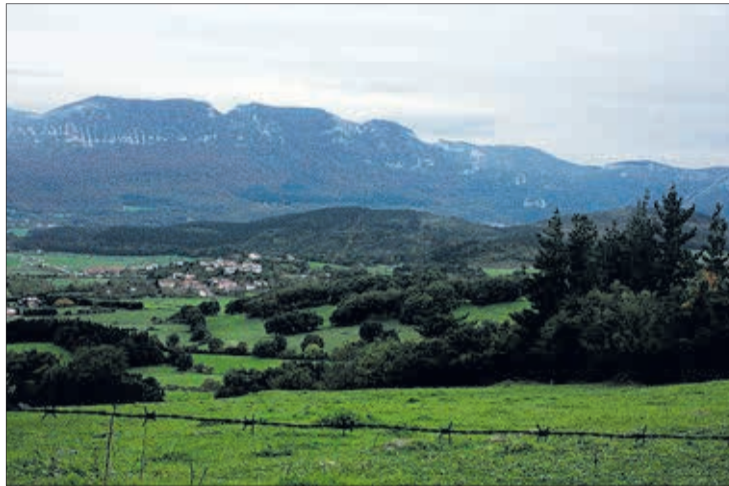
La ruta medioambiental discurrirá por el diapiro del Valle de Mena.

Así, el sábado 30, a partir de las 12.00 horas, tendrá lugar la ruta medioambiental cuyo punto central será el diapiro del Valle de Mena, mientras que por la tarde, a partir de las 18.30 h., el valor gastronómico de las castañas asadas será ensalzado en el magosto o asado popular de castañas que acogerá la plaza de San Antonio