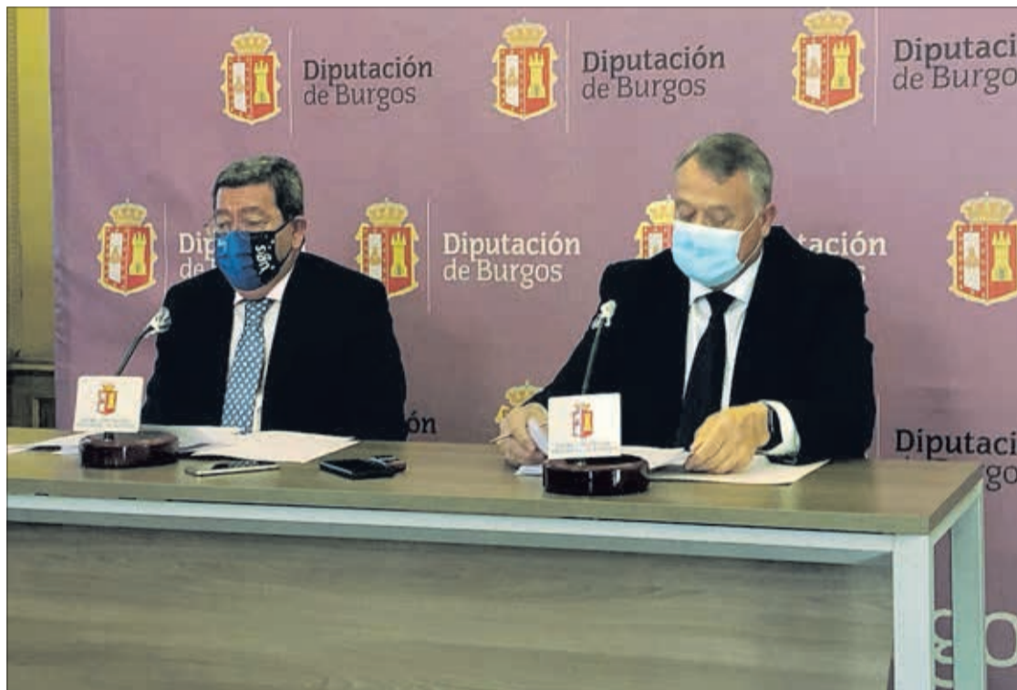
El presidente de la Diputación, César Rico, junto al vicepresidente, Lorenzo Rodríguez, el jueves 28.

Por otro lado, detalló que se recupera el Plan Municipal de Carreteras, a través del que se aportará 1,5 millones de euros a los municipios para mejorar las carreteras de titularidad municipal, a lo que habría que sumar 4 millones de euros para las carreteras de titularidad provincial.