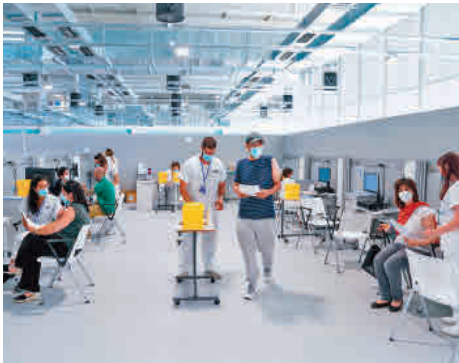
Vacunación en la Comunidad de Madrid