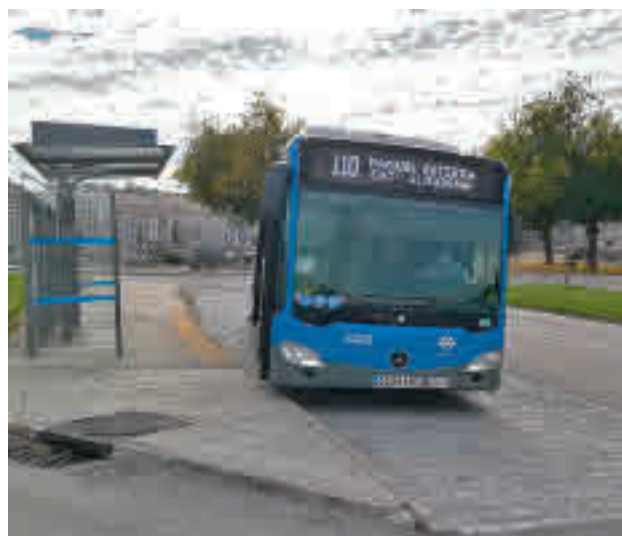
La línea 110 de la EMT, en el cementerio de La Almudena

La Empresa Municipal de Transportes (EMT), como viene siendo habitual en los últimos años, ha reforzado el servicio de ocho líneas que prestan servicio a los distintos cementerios madrileños hasta el martes 2 de noviembre, con motivo del Día de Todos los Santos. Los itinerarios con flota reforzada según el cementerio de destino son: para llegar al cementerio de La Almudena (líneas 106, 110 y 113); para los camposantos Sur y de Carabanchel (líneas 108, 118 y Servicio Especial Plaza Elíptica-Cementerio Sur); para el cementerio de Fuencarral (Servicio Especial