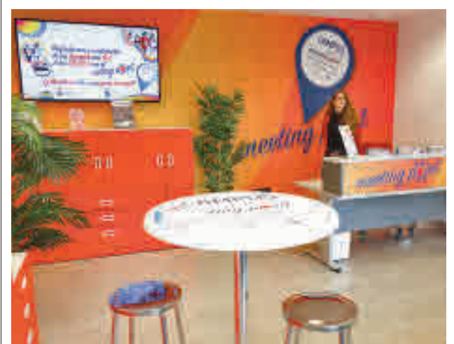
'Meeting Point' de la URJC

Los agentes realizaron registros en cinco domicilios ubicados en Getafe y en Fuenlabrada, que se saldaron con 26 detenidos, 18 adultos y ocho menores imputables. También se hicieron cargo de 37 niños sin responsabilidad penal, ya que no han cumplido los 14 años. También se encontraron dinero en efectivo, varios relojes de alta gama, teléfonos móviles y diversa documentación que está siendo analizada.