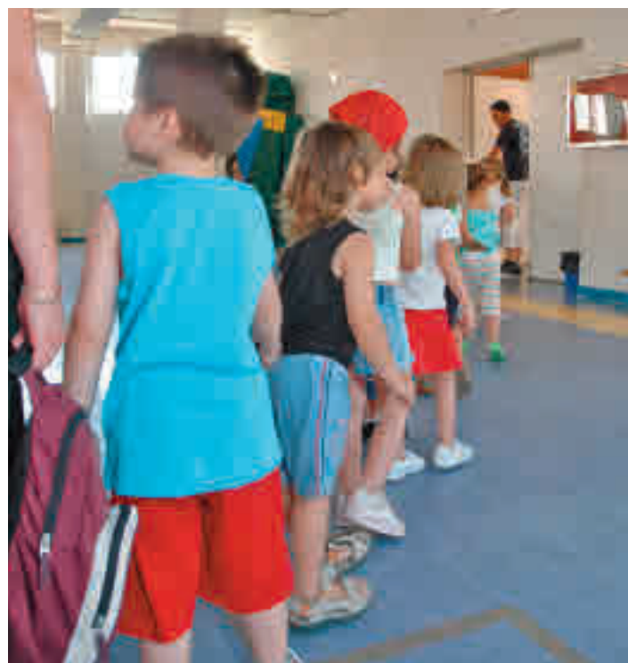
Los niños de Fuenlabrada no pagan las excursiones

El objetivo de este programa es apoyar "la igualdad de