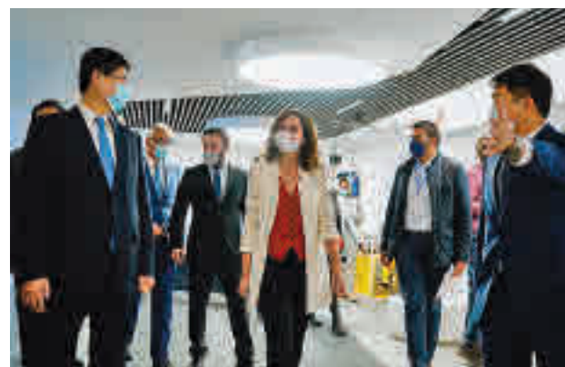
Acto de inauguración

Aprovechando el encuentro, Díaz Ayuso envió un men-