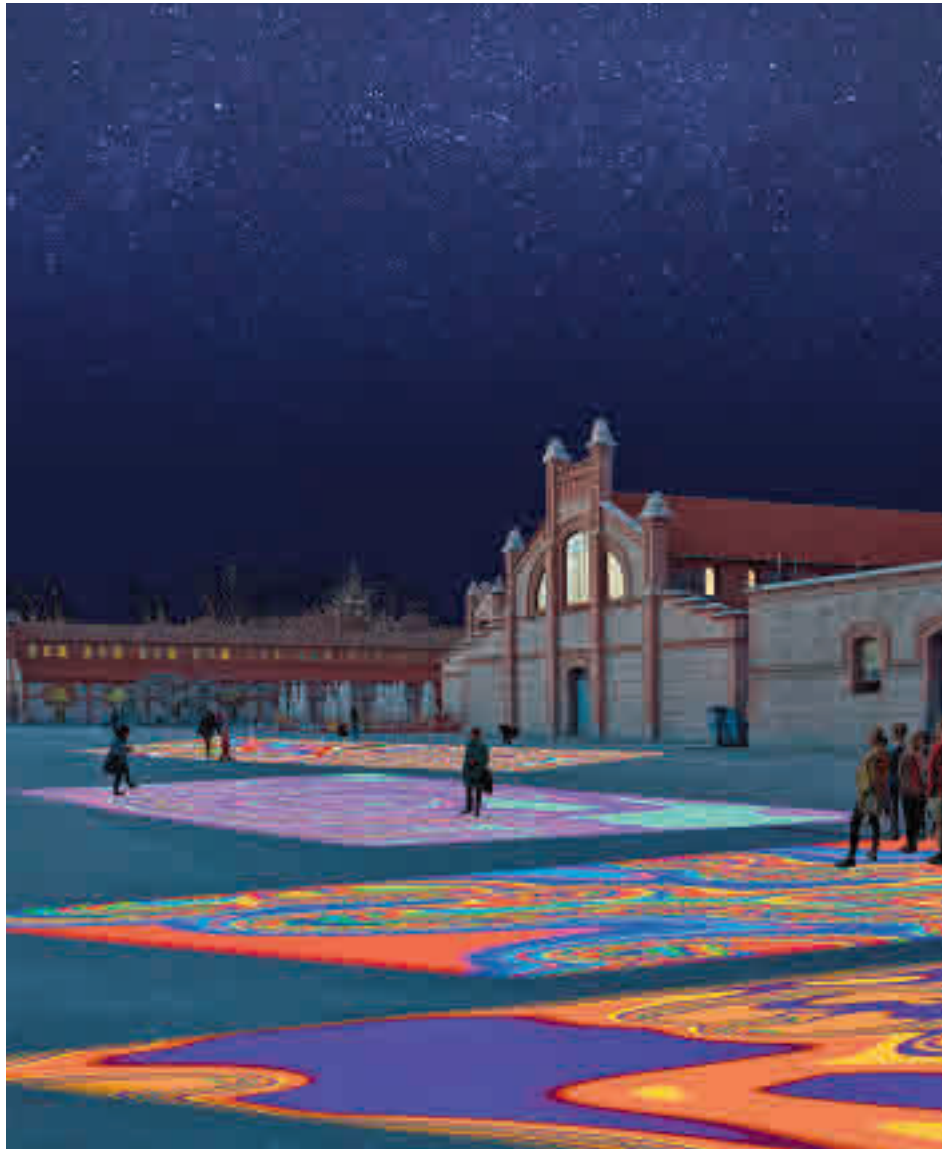
Una simulación de la iluminación en Matadero

Otro de los puntos a tener en cuenta por el visitante será la intervención en la Puerta de Alcalá de Antonio Arola, Premio Nacional de Diseño, en la que se podrán ver animales gigantes y especies desconocidas. Cerca de este emplazamiento, en el parque de El Retiro, en el jardín del Parterre, se podrá contemplar los árboles con proyecciones de luz de formas geométricas a cargo de Javier Riera.