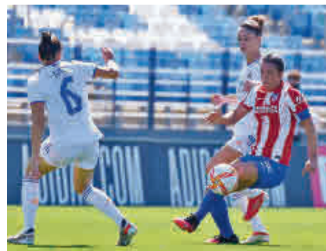
El Real Madrid es cuarto por la cola

A pocos kilómetros de allí, en Matapiñonera, el Madrid CFF, séptimo clasificado, recibe a las 18 horas a un Eibar que es décimo.