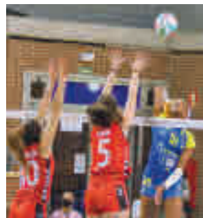
Derrota ante el campeón

Un sufrido triunfo ante el HLA Alicante, prórroga incluida, le valió al Movistar Estudiantes para consolidar su liderato. Este domingo (17 horas), visita a la pista del Juaristi ISB.