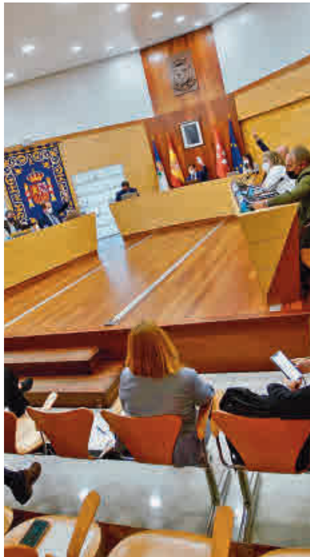
Pleno de Las Rozas

para los vecinos desde el próximo ejercicio”, ha salido adelante gracias a los votos del equipo de Gobierno (PP) y Cs Las Rozas, en la sesión ordinaria del Pleno mes de octubre.