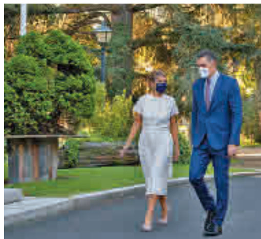
La ministra de Trabajo junto al presidente

EL PERIÓDICO GENTE NO SE RESPONSABILIZA NI SE IDENTIFICA CON LAS OPINIONES QUE SUS LECTORES Y COLABORADORES EXPONGAN EN SUS CARTAS Y ARTÍCULOS