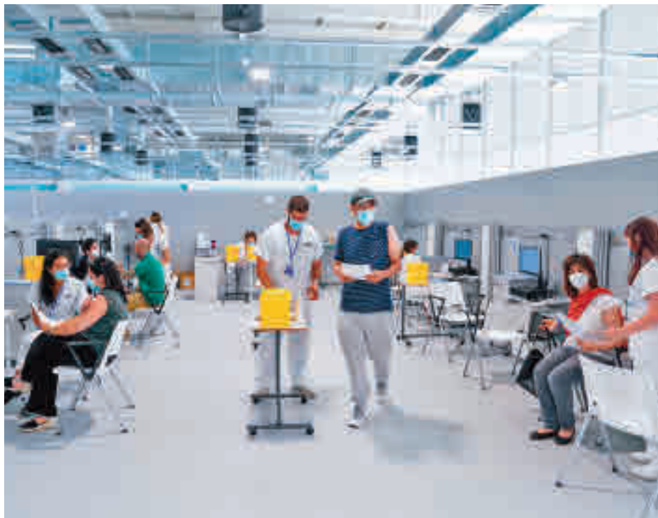
Vacunación en la Comunidad de Madrid