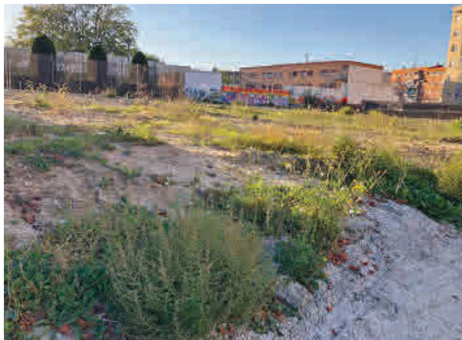
El terreno donde se levantará el futuro equipamiento cultural

“Es alarmante que en una situación pandémica la estación medidora de Plaza Elíptica ya haya superado los 200 microgramos por metro cúbico de dióxido de nitrógeno durante una hora más de las 18 veces que permite la normativa para el conjunto del año”, concluye.