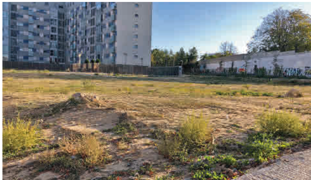
LUCA H. J. / GENTE