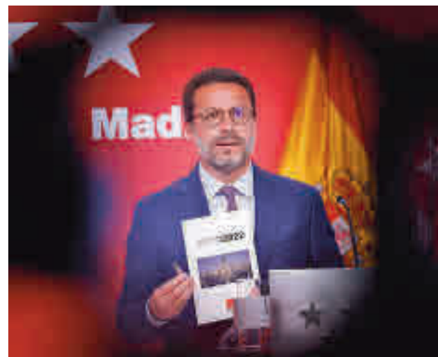
Presentación de los presupuestos