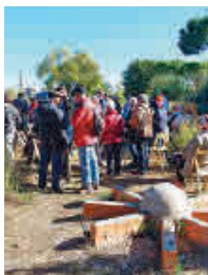
La protesta vecinal

Al día siguiente, a las 12 horas, la Plataforma por un Centro de Memoria en la Cárcel de Carabanchel organizó un acto en el mismo lugar que contó con la presencia