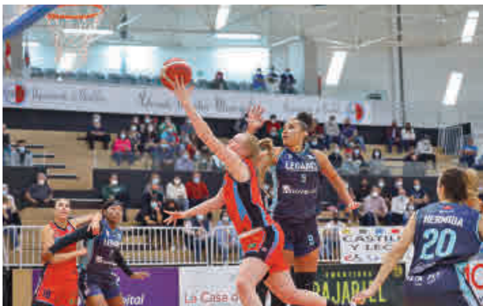
Triunfo importante el que logró el Leganés en Bembibre FEB