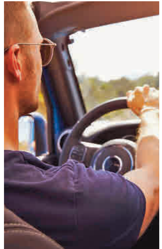
Los jóvenes conducen mejor que antes

los accidentes de tráfico causaban el 31% del total de los fallecimientos entre los jóvenes, mientras que 30 años después (2019) este porcentaje apenas llegaba al 17,7%, un descenso significativo.