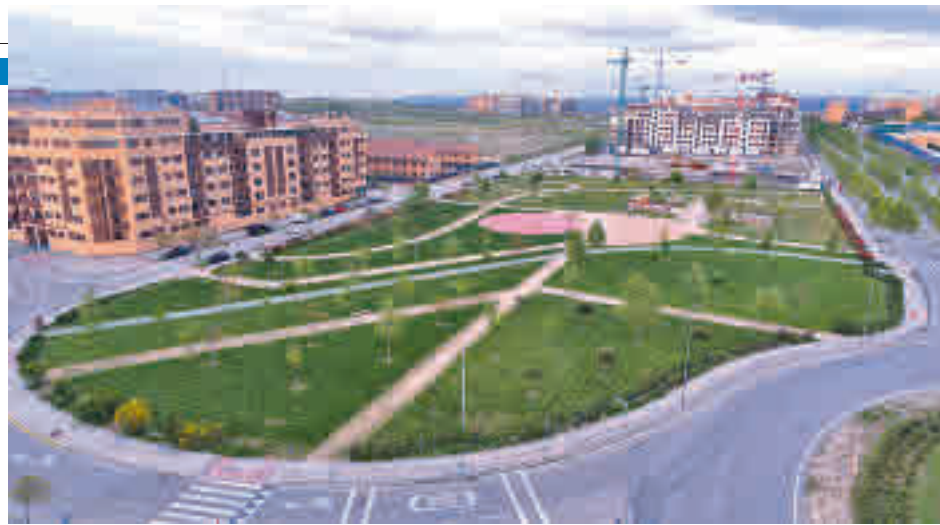
Fue la mayor participación en una consulta de este tipo en la ciudad

El 'sí' ganó con un 82% de los votos en la consulta ciudadana ● Se abre un proceso de escucha, de consultas y participación