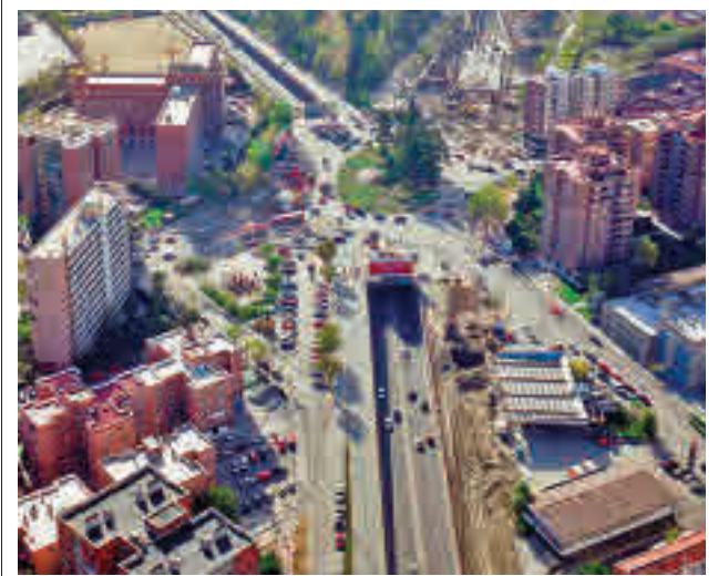
El entorno de la plaza Elíptica

gentedigital.es Toda la actualidad de los distritos de Madrid, en nuestra web