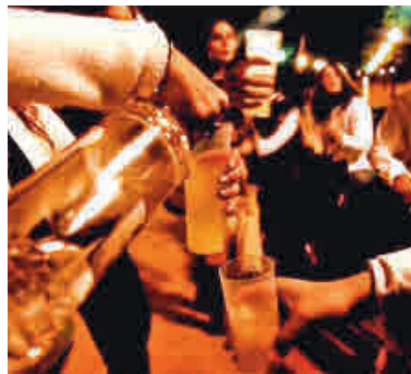
Botellones en Madrid