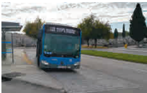
La línea 110 de la EMT, en el cementerio de La Almudena

Los itinerarios con flota reforzada según el cementerio de destino son: para llegar al cementerio de La Almudena (líneas 106, 110 y 113); para los camposantos Sur y de