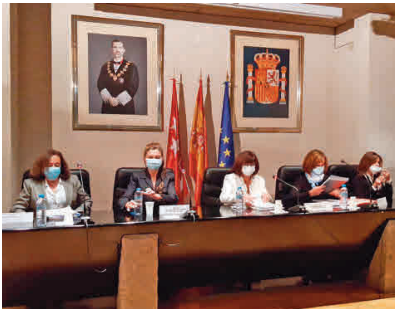
Presentación del informe de 2020 de la Fiscalía de Madrid

Homicidios Se trata de un dato muy similar al del año 2019 (38)