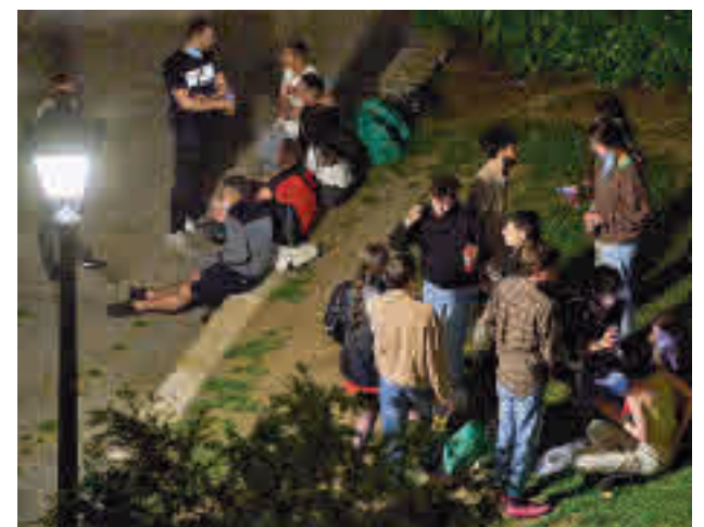
Incidentes en el Parque del Oeste