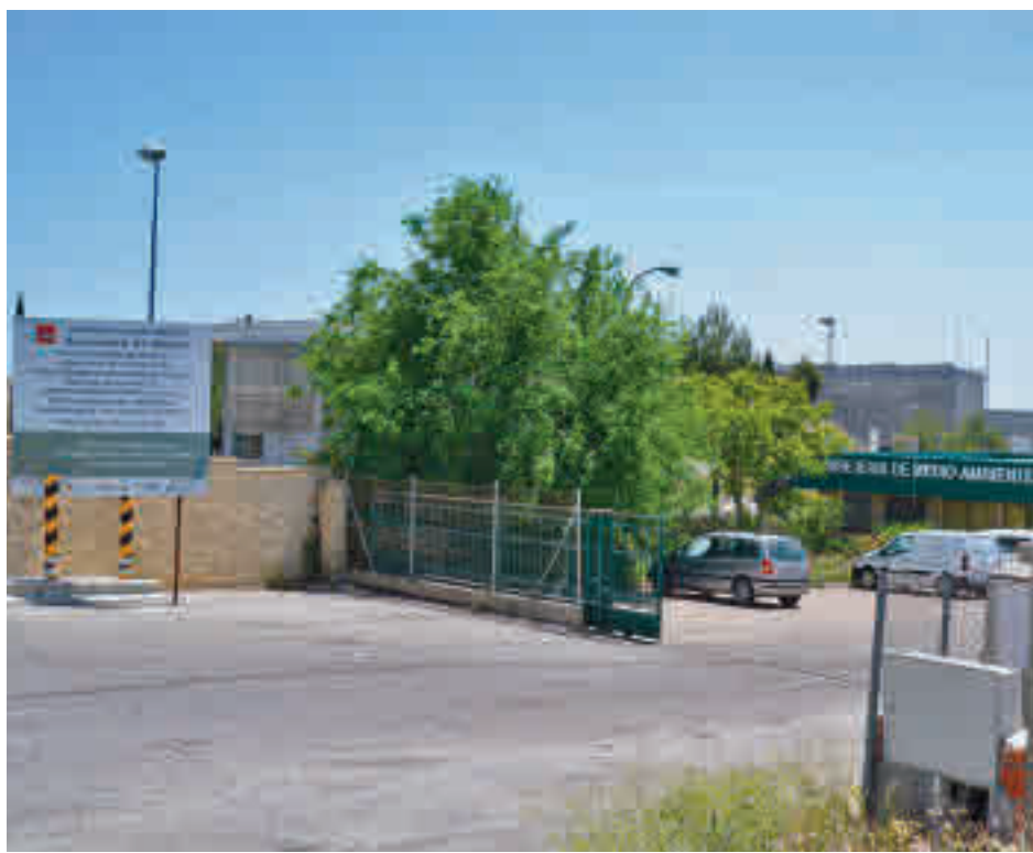
Planta de residuos de Pinto

Otra clave de la futura ley es que "busca generar soluciones innovadoras para disminuir el uso de recursos natu-