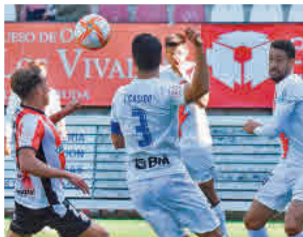
El Rayo Majadahonda es segundo en el Grupo 1

Ese encuentro será uno de los protagonistas del Grupo 2. En el 1, la UD San Sebastián