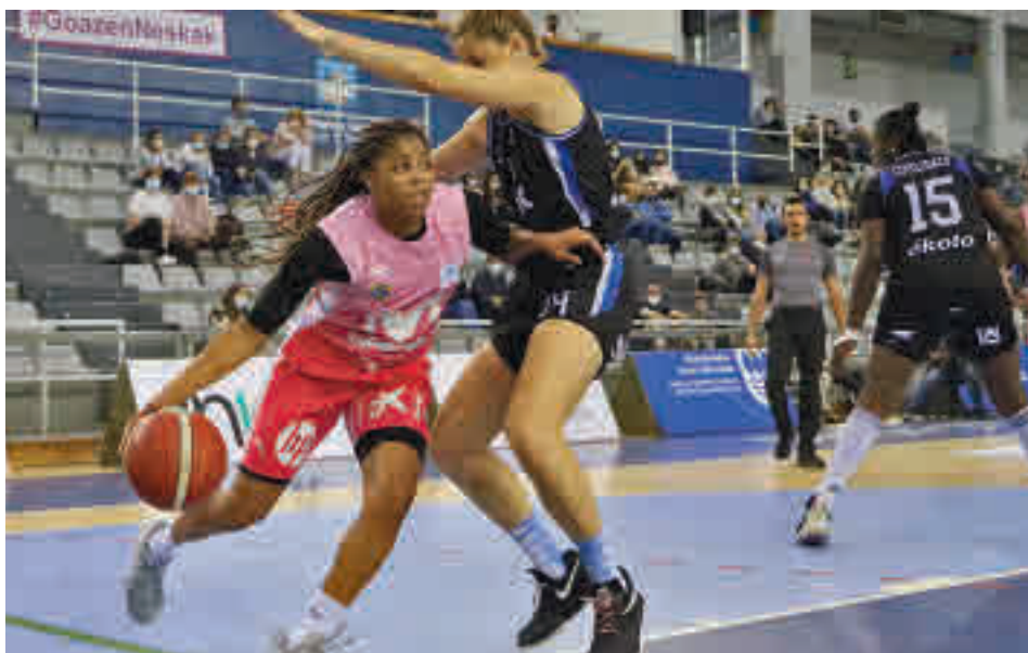
El 'Estu' sumó su tercera derrota de la temporada en la pista del Euskotren FEB