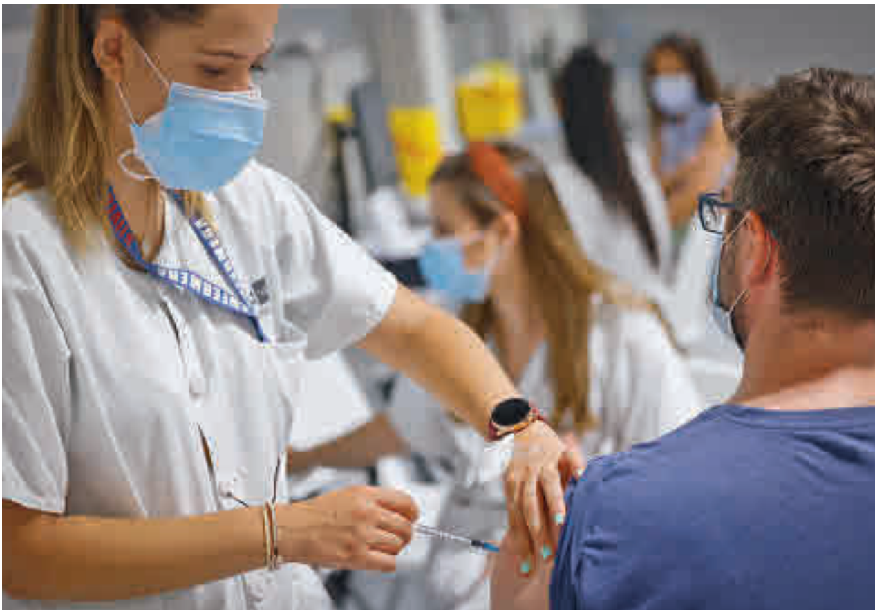
La vacunación ha sido la herramienta más eficaz contra la covid-19