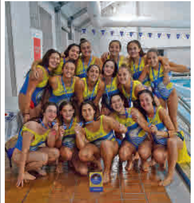
El Boadilla ganó el Campeonato de Madrid