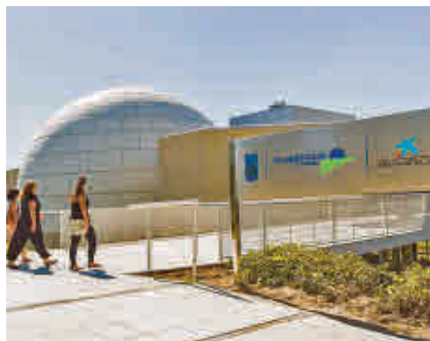
Planetario de Madrid

Organizadas por la Fundación 'la Caixa', estas jornadas se podrán seguir de forma presencial y también a través de 'streaming', gracias al canal de YouTube del Planetario.