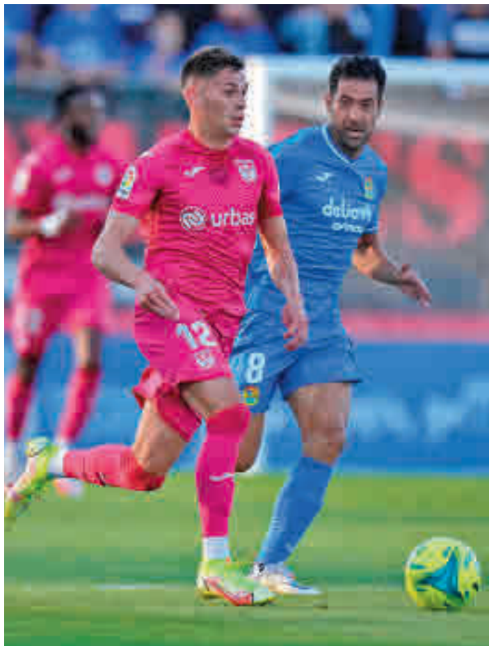
El Leganés cayó ante el Fuenlabrada

UN GOL EN EL 88 CONDENÓ A LOS PEPINEROS EN SU VISITA AL FUENLABRADA