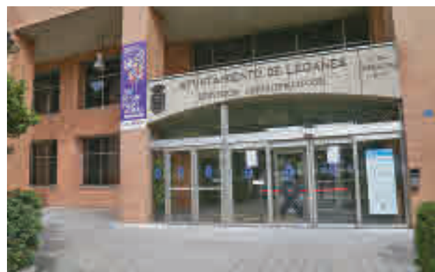
Oficinas del Ayuntamiento de Leganés

La iniciativa, con una duración de nueve meses, ofrece la contratación de 30 personas en un período de práctica profesional y de formación, y va dirigido a desempleados que han acreditado