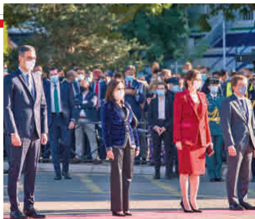
Pedro Sánchez, Margarita Robles, Isabel Díaz Ayuso y José Luis Martínez-Almeida