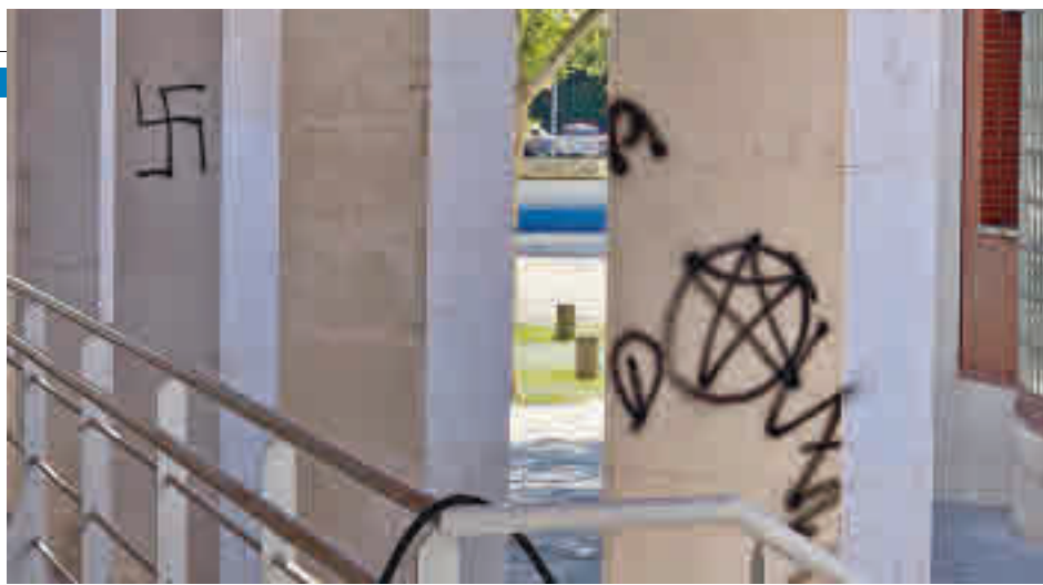
Fachada de la sala Marcos Ana

Allí se ha celebrado la 'Universidad de Otoño' de Podemos • Varios políticos locales han criticado los incidentes