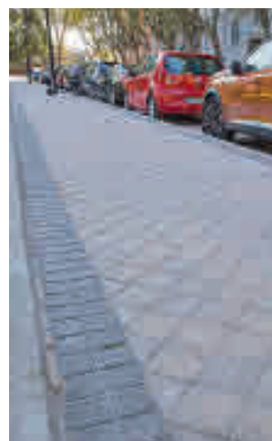
Una de las aceras mejoradas

accesibilidad de una decena de calles de Retiro. Fuentes municipales explican que la primera fase de los trabajos concluirá antes de final de año, mientras que la segunda se extenderá hasta febrero de 2022.