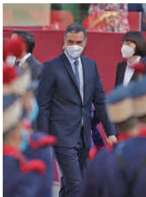
Abucheos a Pedro Sánchez: A pesar de la distancia que había entre la tribuna de las autoridades y el público, los asistentes al desfile militar abuchearon la llegada del presidente del Gobierno, Pedro Sánchez, llegando a pedir su dimisión.

Este martes, gracias a la evolución positiva de las cifras de contagiados, hospitalizados y fallecidos, las tropas volvieron a recorrer las principales vías de la capital con la presencia de un buen número de ciudadanos, tanto madrileños como visitantes que aprovecharon la jornada festiva y la apertura de unas fronteras autonómicas