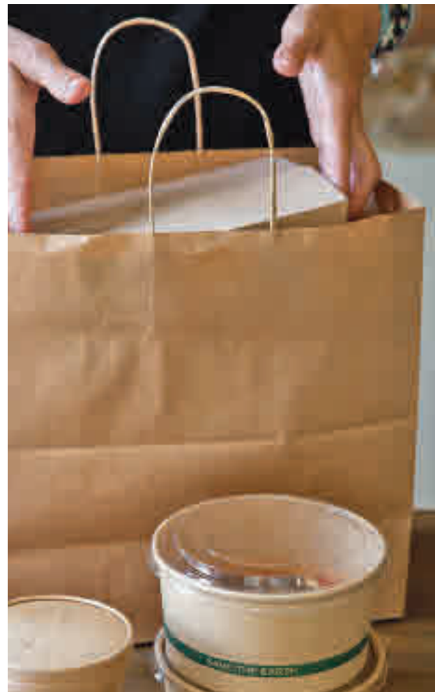
La nueva ley afecta a restaurantes y a tiendas

También se deberá incentivar la venta de alimentos de temporada, de proximidad, ecológicos y ambientalmen-