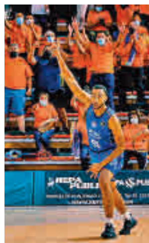
El Urbas es cuarto por la cola

Por su parte, el Feel Volley Alcobendas tratará de dar continuidad a la imagen mostrada en el derbi (triunfo por 3-0) ante el Leganés en la visita que deberá realizar este domingo (17 horas) a la pista del Barça.