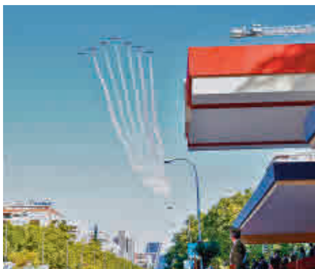
La Patrulla Águila sobrevoló Madrid