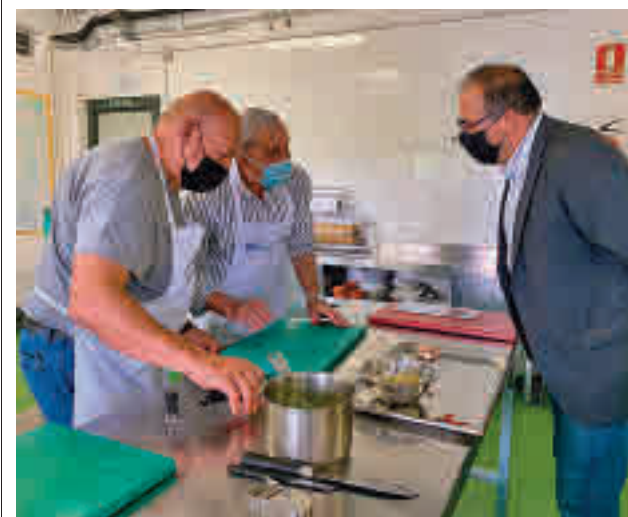
Visita a la Academia Mayorchef

gentedigital.es Toda la actualidad de Leganés en nuestra página web