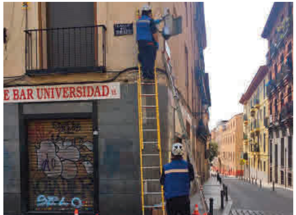
Una de las cámaras de seguridad instaladas en Lavapiés

El contrato, en el que está también incluida la colocación de 23 cámaras en el polígono industrial de Villaverde, supondrá un gasto de 2,4 millones de euros. El mismo incluye el suministro, instalación y configuración de la totalidad de los elementos precisos para conformar los sistemas y su completa conexión con el centro de control de la Policía Municipal (CISE-