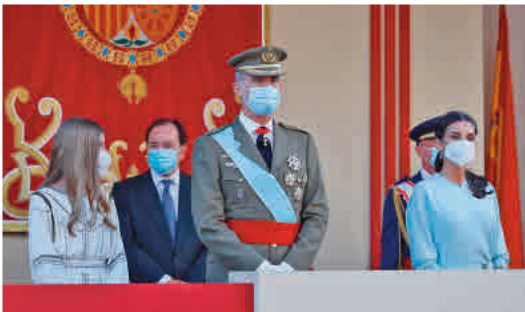
Felipe VI, flanqueado por la Reina Letizia y la Infanta Sofía