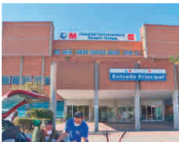
Hospital Severo Ochoa

En concreto, se han registrado 63 casos por cada 100.000 habitantes en los últimos 14 días, respecto a los 57 que se contabilizaron en el informe del pasado 5 de octubre. La Zona Básica de Salud más afectada es la de Mendiughía Carriche, que supera la barrera de los 100 y se sitúa en 110, mientras que la tasa más baja es la de Huerta de los Frailes, que se queda en 5.