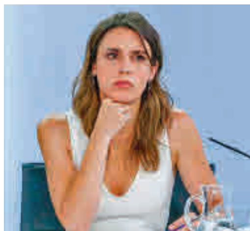
Irene Montero, ministra de Igualdad

EL PERIÓDICO GENTE NO SE RESPONSABILIZA NI SE IDENTIFICA CON LAS OPINIONES QUE SUS LECTORES Y COLABORADORES EXPONGAN EN SUS CARTAS Y ARTÍCULOS