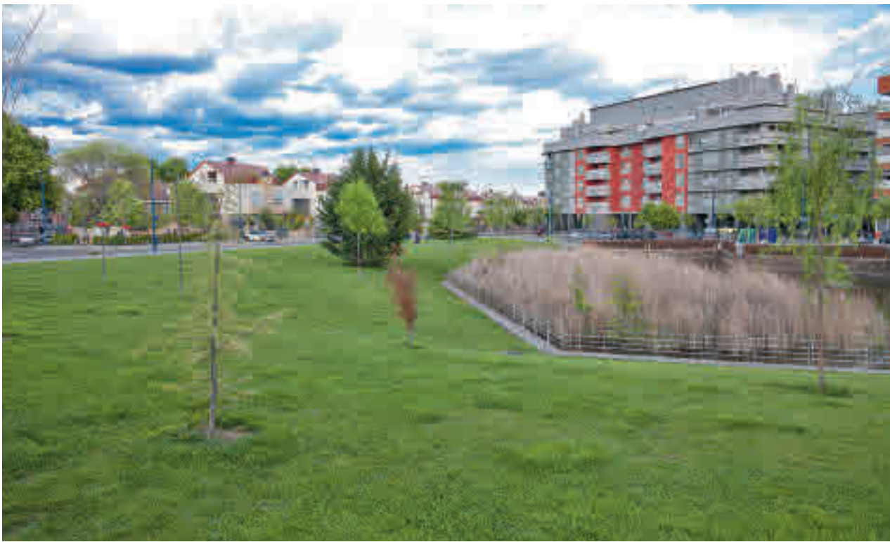
Las calles de Leganés podrían cambiar si llegan los fondos europeos