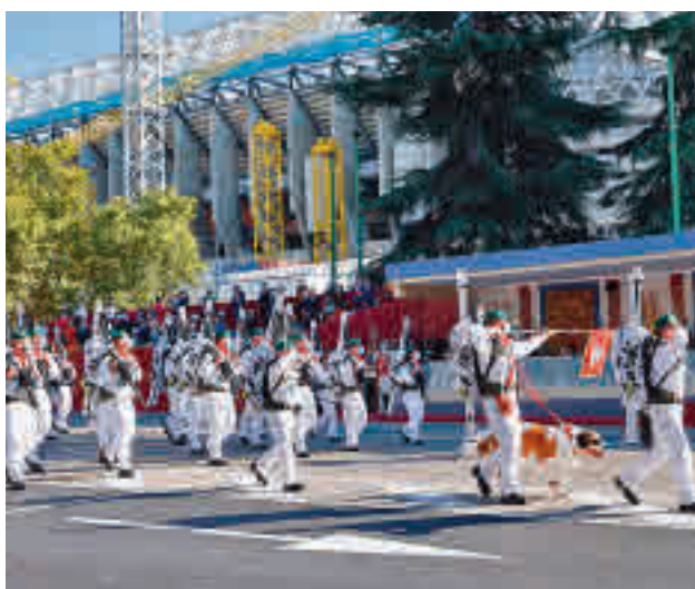
Compañía del Regimiento de Cazadores de Montaña