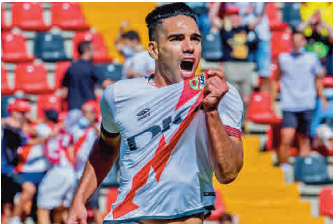
Con sus goles, Falcao ha contribuido que el Rayo llegara al parón instalado en puestos europeos (es sexto con 13 puntos)