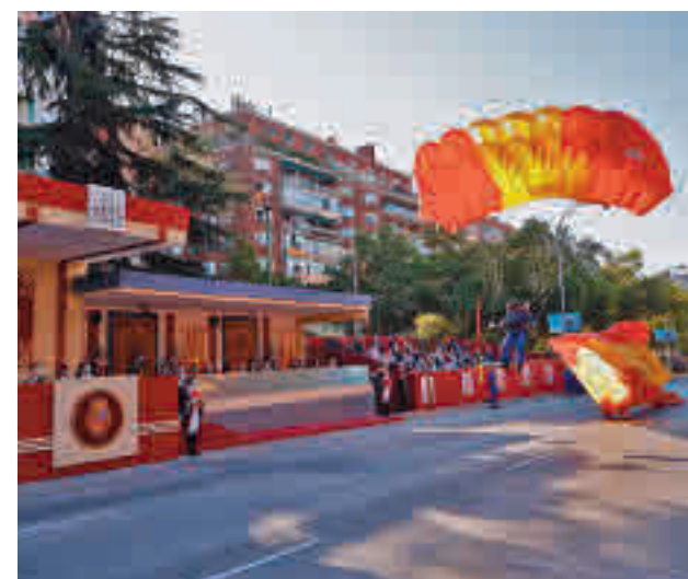
Un paracaidista aterrizó en La Castellana