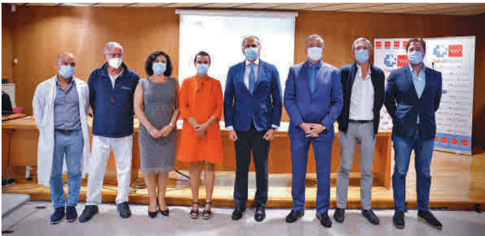
Imagen del encuentro que tuvo lugar en Gran Canaria