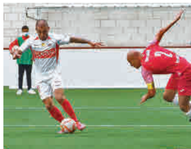
El Sanse es séptimo en la clasificación

De este modo, ambos equipos están separados por 6 puntos y nada menos que diez posi-