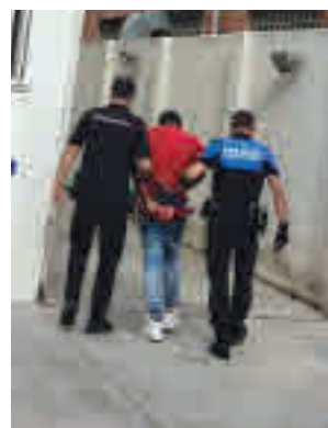
Uno de los detenidos

Durante los días previos se habían producido varias reyertas en las que resultaron heridas levemente tres personas y otras dos sufrieron lesiones graves, en uno de los