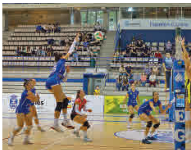
El Leganés no pudo con el Sant Cugat en su debut

Este sábado 9 (19 horas), primera cita del curso en el Luis Buñuel de Alcobendas, donde las locales reciben al Leganés, en un choque inédito hasta la fecha en la máxima categoría nacional.