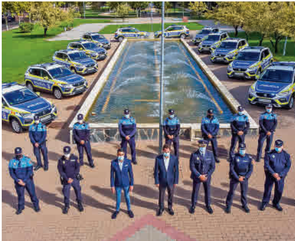
Presentación de los vehículos

Entre las prestaciones del resto de automóviles se encuentran un sistema de iluminación de emergencia delantera, lateral y trasera compuesto por 6 led azules con tecnología Solaris, rotulados con pintura de alta visibilidad según el patrón ‘Battenberg Europeo’ con bandas de color amarillo que evitarán