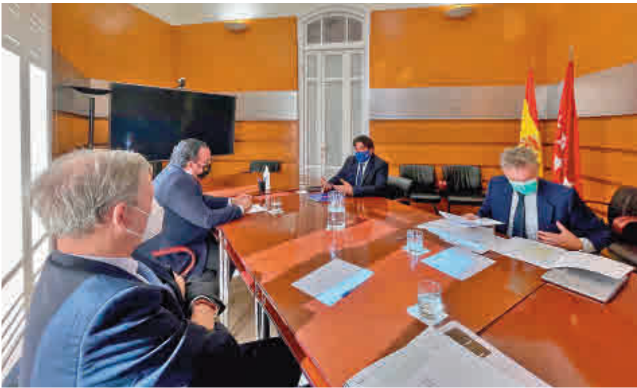
Reunión entre el alcalde de Boadilla y el consejero de Transportes