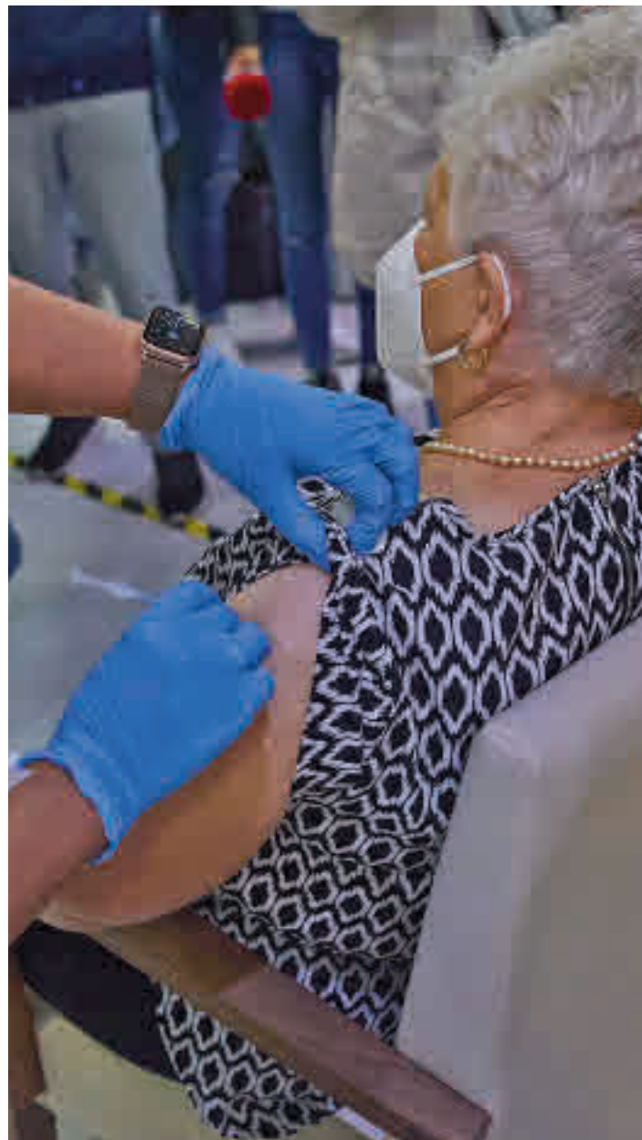
Vacunación con la tercera dosis en Madrid

Así, ha detallado que la campaña de vacunación contra la gripe arrancará previsiblemente la última semana de octubre, con el objetivo de incorporar la administración de esa tercera dosis para "optimizar recursos" al ser la mis-