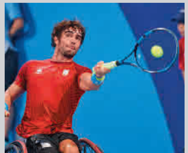
El tenista madrileño es número 12 en el ranking mundial

Con 13 puntos sobre 15 posibles, el Atlético de Madrid femenino recibe este sábado (17 horas) en la Ciudad Deportiva Wanda de Alcalá de Henares al vigente campeón de Europa, el Barcelona.