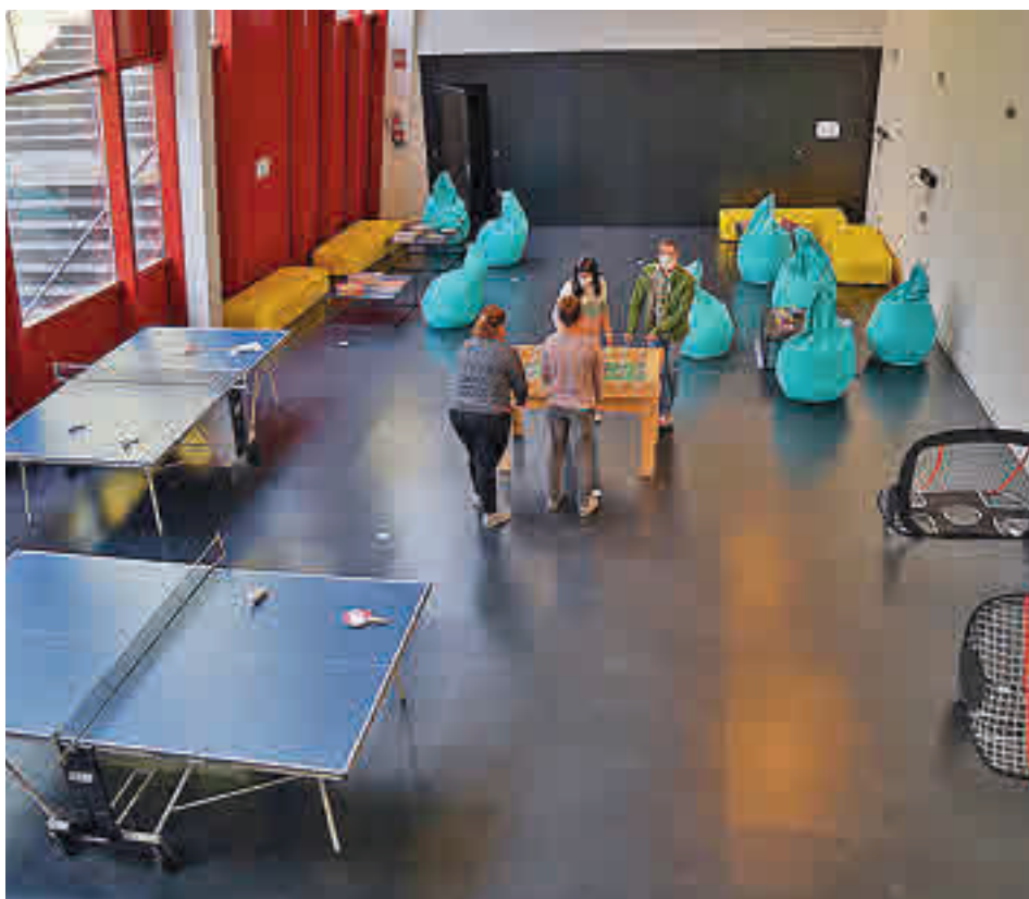
El fútbol y el tenis de mesa serán dos de las propuestas de la programación