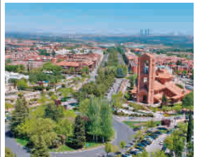
El objetivo es minimizar el impacto del cambio climático

gentedigital.es La actualidad de los municipios del Noroeste, en nuestra web.