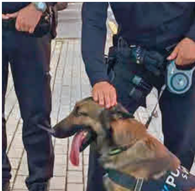
La Unidad Canina, clave en esta campaña

Dar seguridad es uno de los aspectos que, tradicionalmente, más preocupan en lo que se refiere a los centros escolares. En este sentido, la actividad policial no se limita solo a velar por la fluidez del tráfico en las horas de entrada y salida a colegios e institutos. Un buen ejemplo de ello es la gran labor que realiza la Unidad de Tutores de la Policía Local de San Sebastián de los Reyes que en este curso contará con una ayuda tan particular como efectiva: la