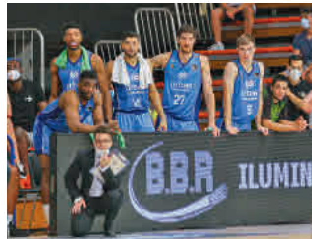
El Urbas cayó derrotado en su debut liguero B. FUENLABRADA

Más lejano aparece en el horizonte el estreno en la Euroliga el jueves 30 (20:45 horas) con el Anadolu Efes, el vigente campeón continental.