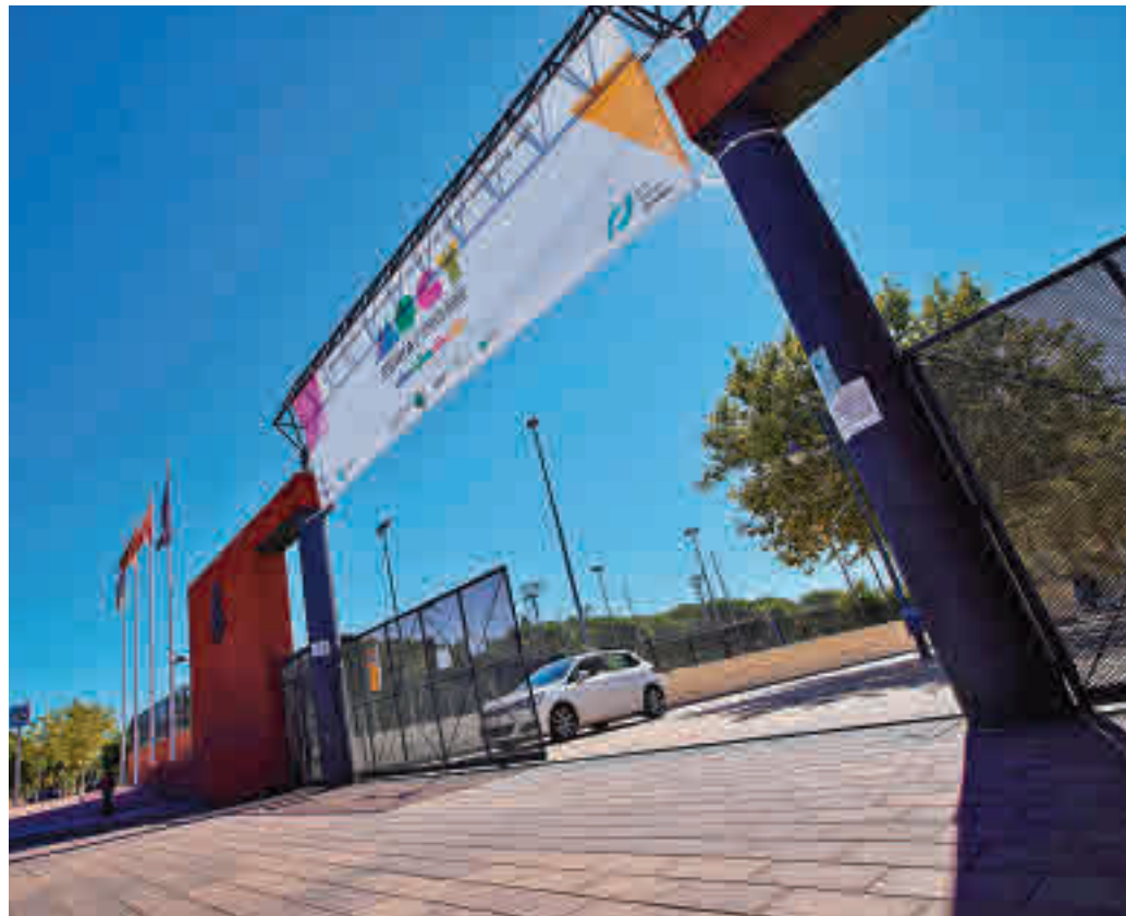
Entrada de la feria Mogy de Las Rozas

En el área Hogar el visitante podrá conocer todos los