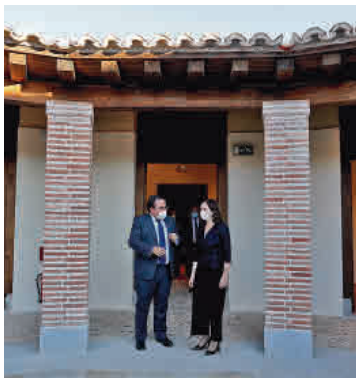
La presidenta madrileña, en el también conocido como Gallinero

UN MUSEO CON CONTENIDO ESPECIAL PARA NIÑOS ABRIRÁ EN POCOS MESES