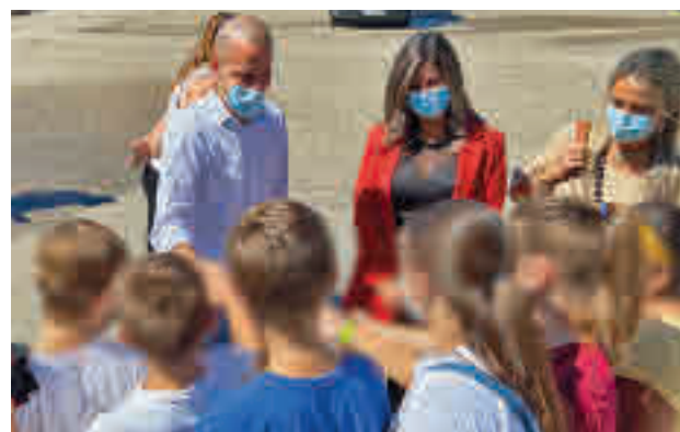
El alcalde charla con los alumnos

de 6º de Primaria del centro comprobaron la importancia de cuidar la limpieza de la ciudad y conocieron de primera mano el funcionamiento de la maquinaria que diariamente limpia las calles. El alcalde, José Luis Álvarez Ustarroz, acompañado de la concejal de Medio Ambiente,