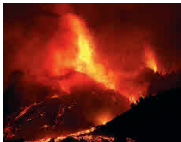
Erupción del volcán de Cumbre Vieja en La Palma