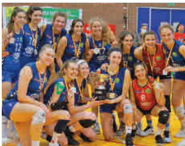
El Feel Volley se desplaza hasta Canarias