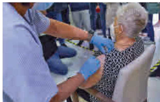
Una residente recibe la tercera dosis

Zapatero apuntó que estar en una residencia de an-