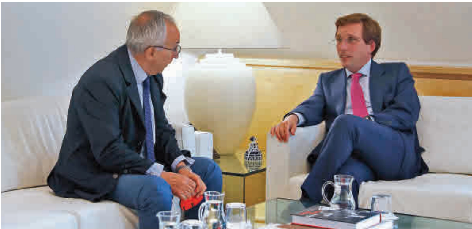
Alejandro Blanco y José Luis Martínez-Almeida se reunieron esta semana