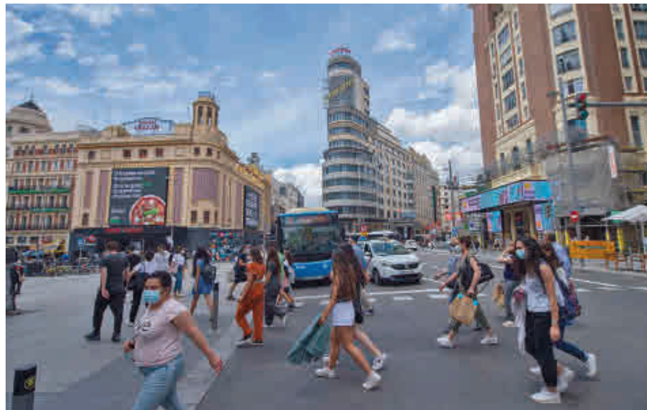
Los vehículos sin distintivo ambiental no podrán entrar a la mayor parte de la zona restringida

Las cámaras de la Zona de Bajas Emisiones de distrito Centro comenzarán a grabar el próximo 11 de octubre. Durante dos meses el control telemático estará en periodo de pruebas para garantizar su correcto funcionamiento. En este periodo, el Ayuntamiento no emitirá sanción a los vehículos y enviará una comunicación de carácter informativo.