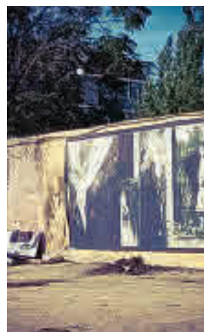
La lona, tras el incendio