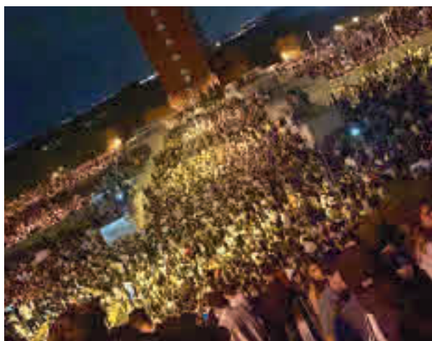
Macrobotellón en Ciudad Universitaria

Todas las administraciones han coincidido en que estas imágenes no pueden volver a producirse por el riesgo sanitario que suponen.