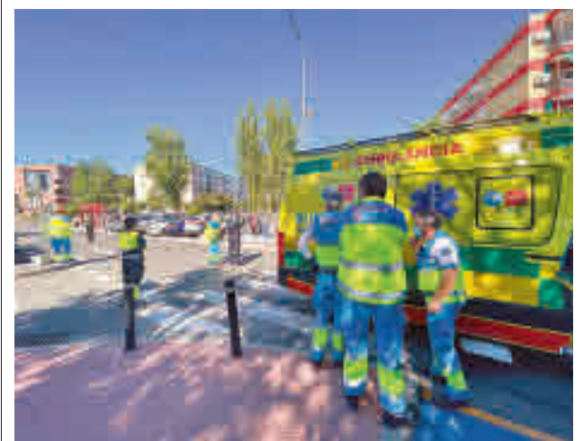
Lugar donde se produjo el accidente

A cambio de estos 'juegos' les prometía regalos o recompensas y en otras ocasiones les daba pequeñas cantidades de dinero. También les pedía que guardasen el secreto y no lo contaran.