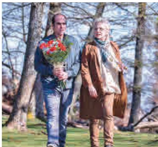
Fotograma de la película 'Maixabel'

EL PERIÓDICO GENTE NO SE RESPONSABILIZA NI SE IDENTIFICA CON LAS OPINIONES QUE SUS LECTORES Y COLABORADORES EXPONGAN EN SUS CARTAS Y ARTÍCULOS