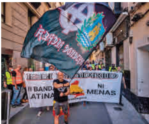
Manifestación neonazi en Chueca