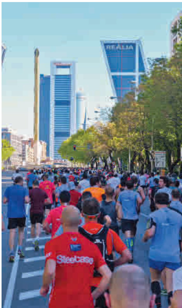
La salida estará ubicada en el paseo de la Castellana

Entre las novedades que ha dejado la aparición de la pandemia está el traslado de fechas. Una de las citas más destacadas del calendario de la capital abandona el mes de mayo para instalarse en estos primeros compases del otoño, una circunstancia que