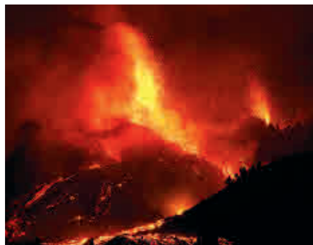
Erupción del volcán de Cumbre Vieja en La Palma