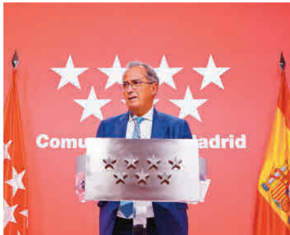
El calendario se aprobó en el Consejo de Gobierno

SE CONSULTA CON EL RESTO DE GRUPOS, LA IGLESIA Y LOS EMPRESARIOS