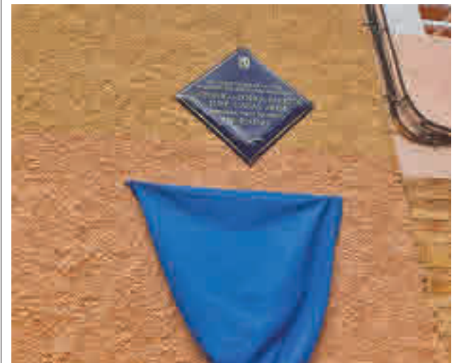
La placa que recuerda a la formación musical