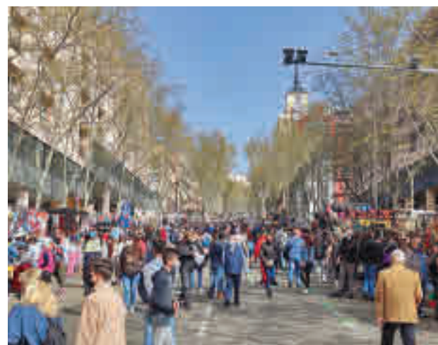
El tradicional mercadillo de la capital

En cuanto a los vendedores, podrán instalar sus puestos aquellos que se encuentren al corriente de pago de la tasa de ocupación de dominio público de 2019, ya que en 2020 y 2021 ese canon fue suspendido por el Ayuntamiento como medida de apoyo a comerciantes y hostele-