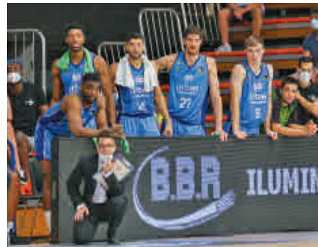
El Urbas cayó derrotado en su debut liguero B. FUENLABRADA

Más lejano aparece en el horizonte el estreno en la Euroliga el jueves 30 (20:45 horas) con el Anadolu Efes, el vigente campeón continental.