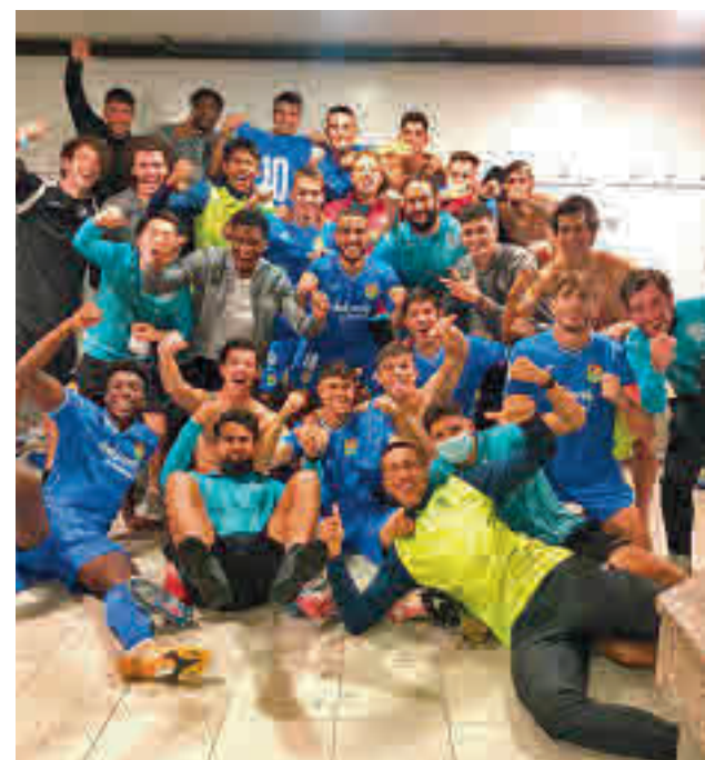
El Fuenlabrada Promesas, una de las sensaciones

Estos cambios también serán palpables en la carrera del domingo. Se han espaciado las pruebas aún más y las salidas se realizarán por varios bloques para tratar de garantizar, en la medida de lo posible, la distancia de seguridad. Así, el 10k arrancará a las 7:45, el maratón a las 8:45 y, por último, el medio maratón se iniciará a las 11.