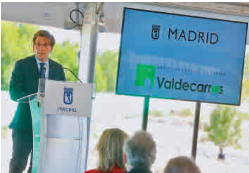
Un momento de la intervención del alcalde