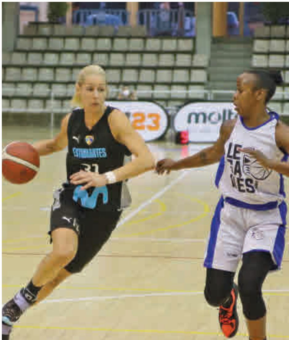
El Innova-tsn Leganés se impuso al Movistar Estudiantes en el Memorial J. M. Caño FBM

El deseo de repetir al menos el papel del curso anterior del Movistar Estudiantes contrasta con la ilusión de un debutante. El Innova-tsn Leganés se estrenará en la máxima ca-