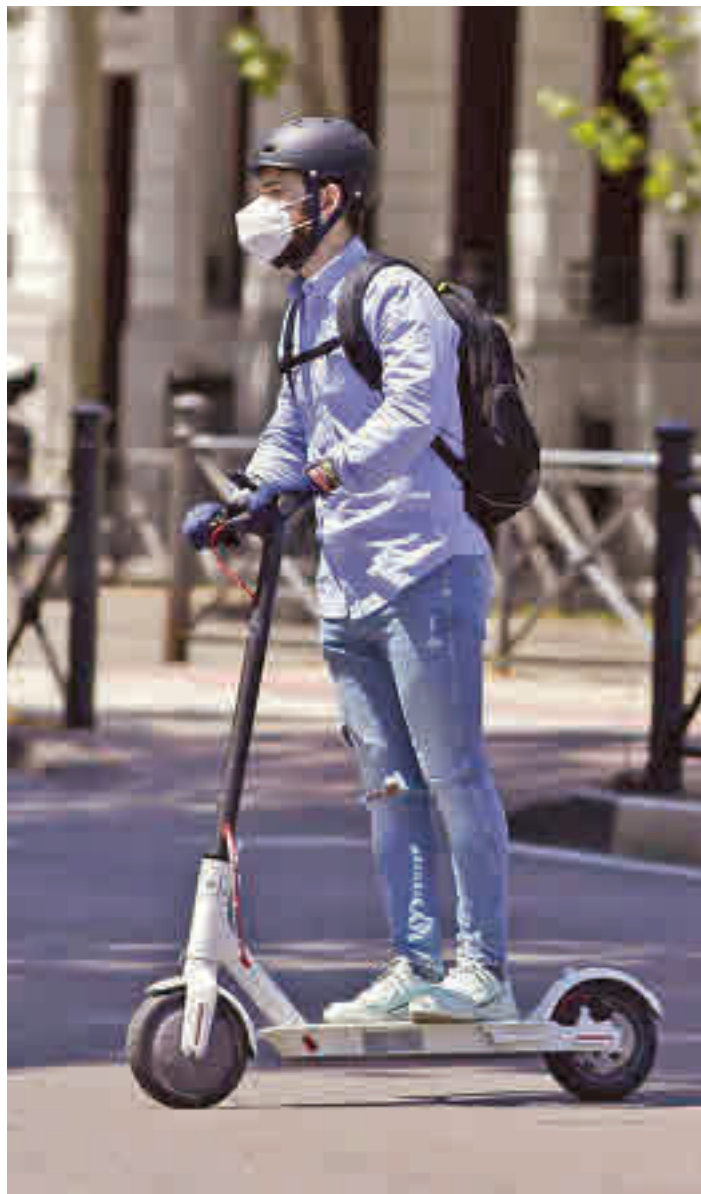
La movilidad eléctrica va en aumento

Por otro lado, un 76% de la población encuestada querría un sistema tarifario integrado conjunto de transporte público que incluyera los servicios de micromovilidad compartida. Una demanda que obtiene un mayor respaldo en concreto entre los sevillanos (82%), los malagueños (80%) y los zaragozanos (81%). Para Brunelleschi, estos datos demuestran "la falacia de que las opciones de movilidad compartida son una amenaza para el uso del transporte público y no una opción com-