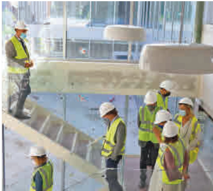
El alcalde recorrió las diferentes dependencias

Los vecinos del barrio de Zofío (Usera) parece que están cada vez más cerca de hacer realidad una de sus reivindicaciones más recurrentes en los últimos años e incluso comprometidas en legislaturas anteriores, la de contar con un centro juvenil. Su construcción finalizará a comienzos de 2022, si se cumplen los plazos previstos por el Ayuntamiento de Madrid.