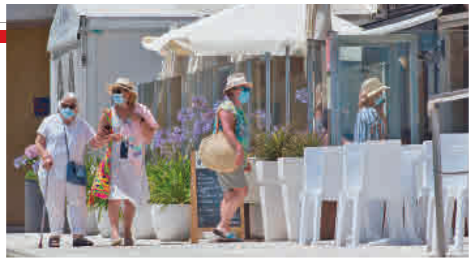
El gasto vacacional ha aumentado en este verano

madrileños fue sensiblemente superior a la media nacional. El Observatorio Cetelem señala que los españoles se gastaron 942 euros en sus pasadas vacaciones de verano, un 42% más que en las del año 2020.