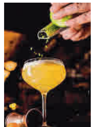
Cita con los mejores cócteles

La semana contará como principal atracción con la ruta de locales a la que se han sumado más de 80 coctelerías. Cada uno de ellos creará una carta de ocho cocktails. En total, habrá más de 500 propuestas creadas especialmente para este evento que, ade-