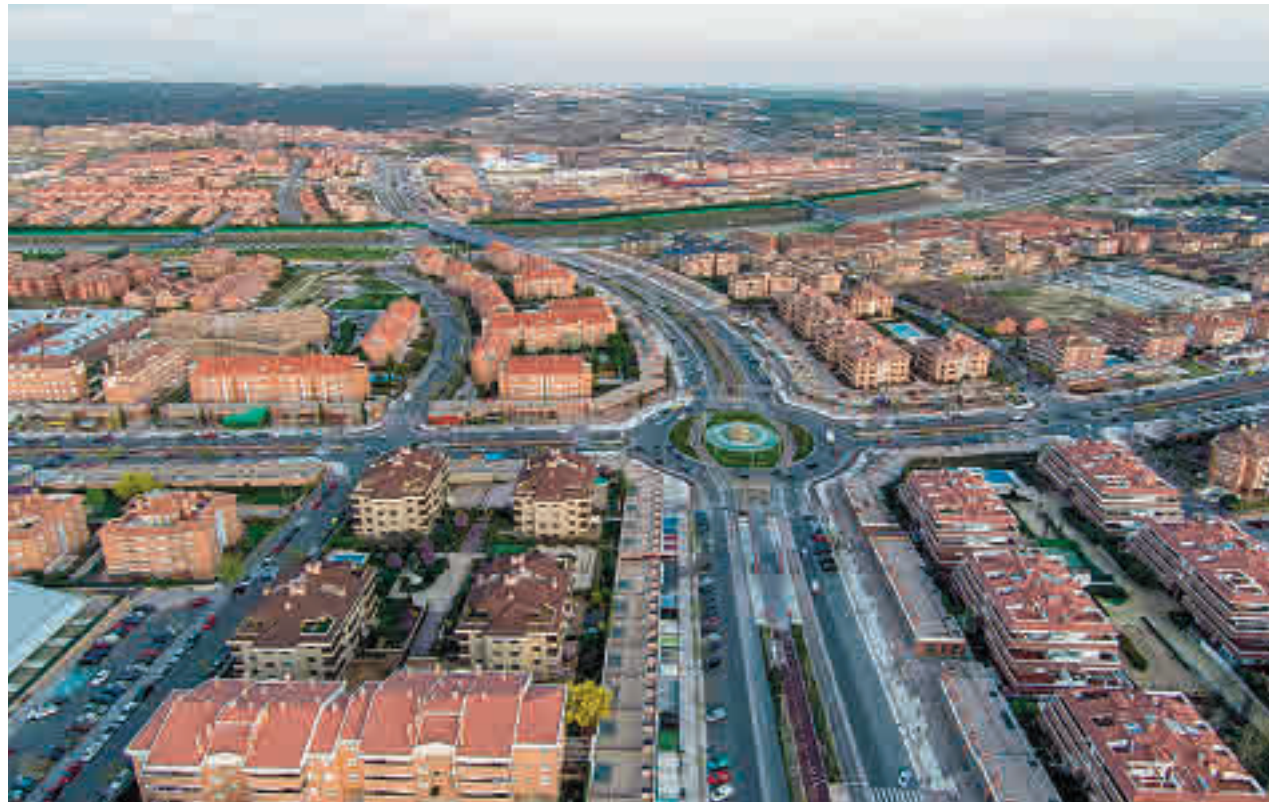
Vista aérea del casco urbano de Boadilla del Monte

Para las encuestas se solicitan datos relativos a la edad, sexo y zona de residencia así como las razones por las que se desplaza a través de ese medio concreto y en qué casos lo haría de otra manera. También se piden propuestas de mejora dirigidas a las distintas administraciones, sugerencias y peticiones al Ayuntamiento.