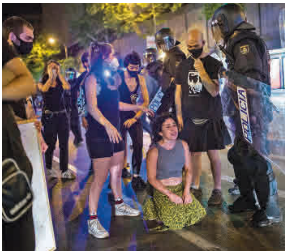
Cargas policiales tras la manifestación en Madrid