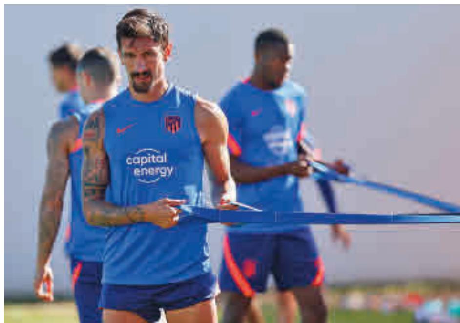
Valdebebas y Majadahonda acogieron los primeros entrenos de Real Madrid y Atlético

jugará su primer amistoso en Escocia ante Rangers de Steven Gerrard.