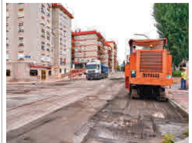
Máquinas actuando sobre el firme de Móstoles