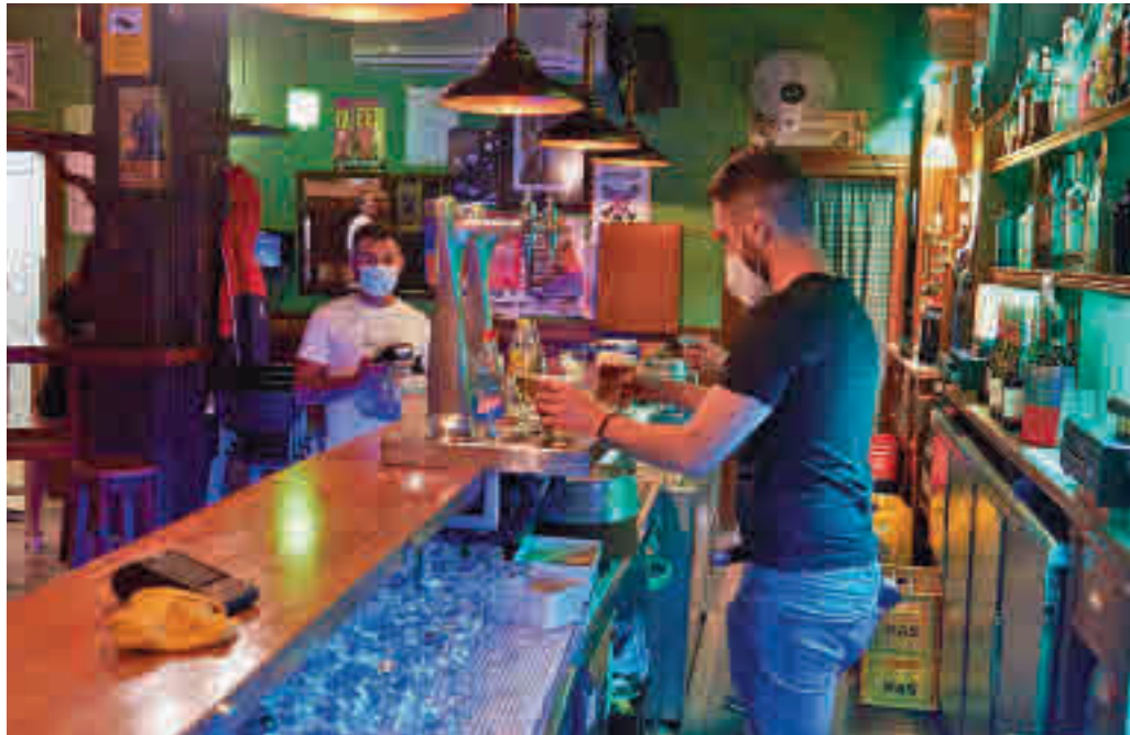
La Comunidad no se plantea el cierre del ocio nocturno

Ossorio insistió en que "la subida de contagios que exis-