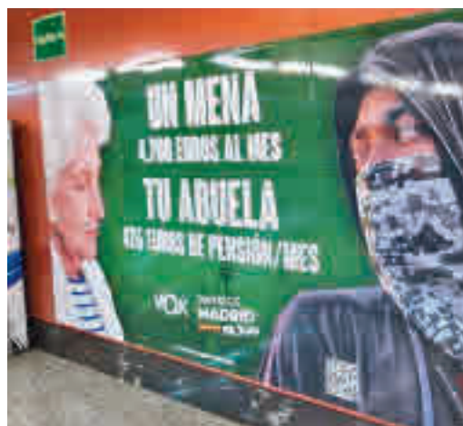
El polémico cartel electoral de Vox

EL PERIÓDICO GENTE NO SE RESPONSABILIZA NI SE IDENTIFICA CON LAS OPINIONES QUE SUS LECTORES Y COLABORADORES EXPONGAN EN SUS CARTAS Y ARTÍCULOS