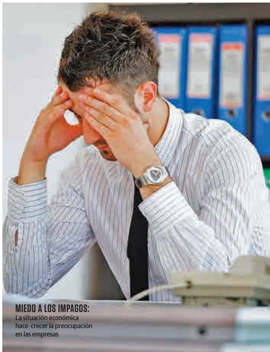
MIEDO A LOS IMPAGOS: La situación económica hace crecer la preocupación en las empresas

Si se analizan los datos recabados en España en comparación con los del resto del Viejo Continente se obtiene que nuestro país está entre los cinco donde más compañías creen que aumentará el