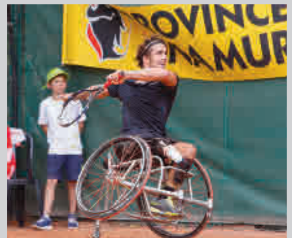
El jugador madrileño es uno de los favoritos