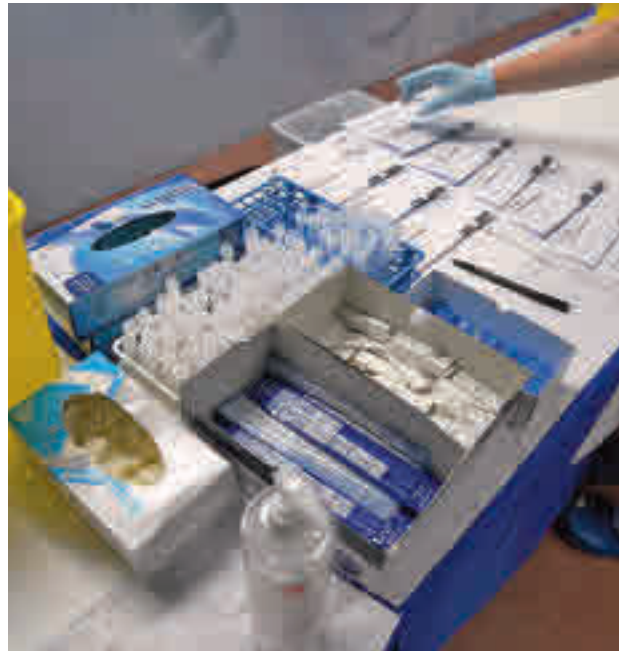
La incidencia se mantiene en el Sur

Entrando en los detalles, la población con una incidencia acumulada más elevada en estos momentos es Parla, que registra 88 casos por cada 100.000 vecinos en los últimos 14 días, en los que ha habido 118 positivos. A continuación aparece Leganés con una tasa de 87 y 167 contagios, mientras que en cifras similares se mueven otras ciudades como Pinto (82, 5 y 44),