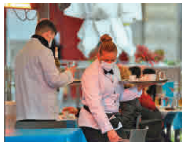
Los camareros, uno de los perfiles más demandados

En este sentido los perfiles más demandados serán los de camarero, cocinero, dependiente, cajero, mozo, preparador de pedidos y carretillero. Asimismo, se abre la puerta a profesionales derivados de la situación de pan-