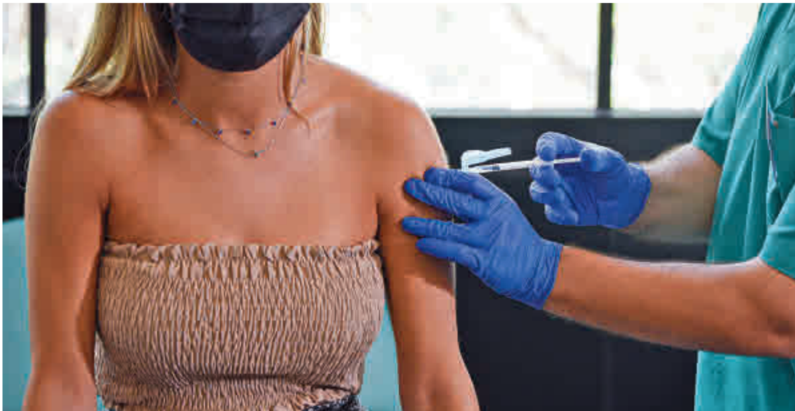
La vacunación continúa a buen ritmo en la Comunidad de Madrid