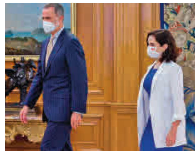
Felipe VI e Isabel Díaz Ayuso

Este viernes 9 de julio, la presidenta madrileña mantendrá su primer encuentro con el presidente del Gobierno, Pedro Sánchez, en La Moncloa. Será su primera reunión tras la que mantuvieron en el año 2020.