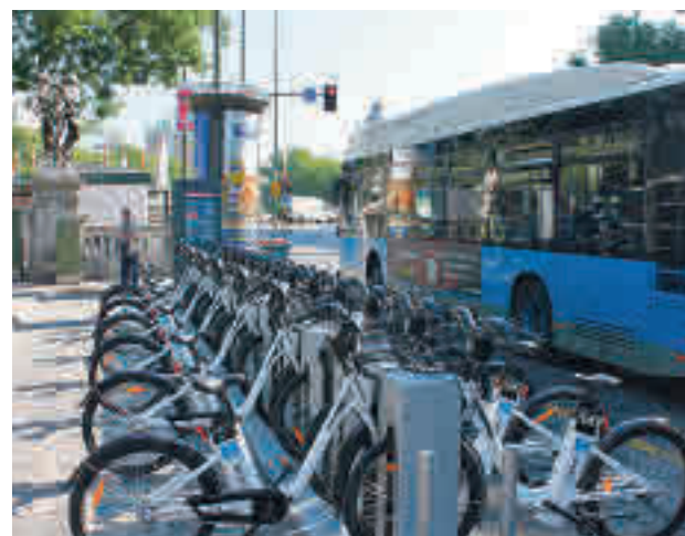
Una de las bases del servicio municipal de alquiler

Además, se van a instalar cámaras en las 258 estaciones de la red. Cibeles prevé tener operativas 50 en las bases calificadas como más problemáticas (distritos de Centro, Salamanca, Chamartín, Chamberí, Retiro y Arganzuela) antes de final de año y continuará con el proceso de implantación a lo largo del próximo año 2022.