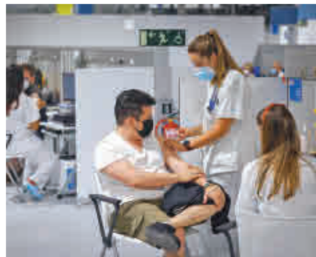
Llega el turno de vacunación de los más jóvenes