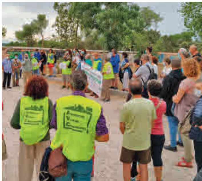
La protesta concluyó con la lectura de un manifiesto AV CAMPAMENTO

‘Basta de contaminación, ruido y peligro de accidentes’ fue el lema de la manifestación que recorrió Campamento (Latina) en la tarde del 6 de julio. La marcha, organizada por la asociación vecinal del barrio y apoyada por los grupos de la oposición y colectivos ecologistas, cortó la carretera de Boadilla del Monte para reclamar al Ayuntamiento que limite la velocidad del tráfico a 30 kilómetros por hora. ‘Seguimos reclamando un barrio más saludable que piense en las personas’, dijeron los residentes.