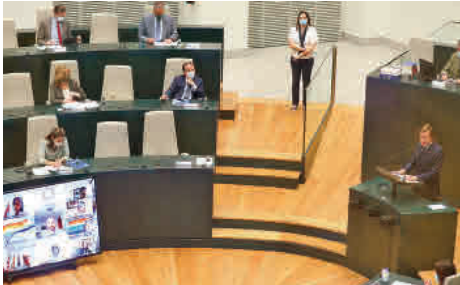
La intervención del alcalde en el Palacio de Cibeles

Las obras para la completa peatonalización de la Puerta del Sol y el desmontaje del scalextric de Puente de Vallecas arrancarán antes de fin de año y el Ayuntamiento instalará 23 cámaras de vigilancia en el polígono de Marconi en 2023 y se reforzarán las de la Puerta de Sol y Antón Martín. Estos fueron algunos de los importantes anuncios que realizó el alcalde de Madrid, José Luis Martínez-Almeida, en el Ple-