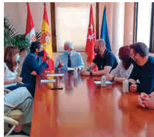
Reunión de las partes implicadas

Hay que recordar que los trabajadores, a través de un comunicado, aseguraban que esta huelga se debía a que la nueva empresa adjudicataria se negaba a aplicar las tablas salariales que establece