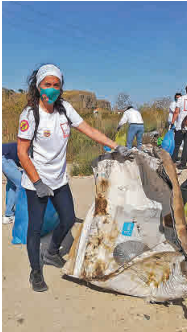
Labor de los voluntarios de SEO BirdLife