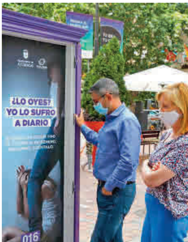
La puerta que está en la Plaza del Pueblo

fro a diario'. La iniciativa, que lleva por lema 'De puertas para dentro', pertenece a las actividades programadas en el Pacto de Estado contra la Violencia de Género y surge de la idea de mostrar a los vecinos el drama que sufren las mujeres víctimas, poniendo también el foco en sus agresores, su entorno, la sociedad y todos los medios que pretenden erradicar esta lacra. La puerta, con apertura por ambos lados, está acompañada del sonido de una locución que simula una esce-