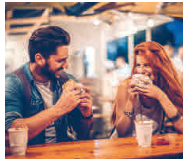
Una pareja conversa