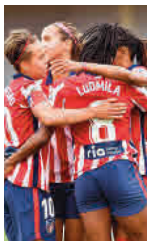
El Atlético es quinto

única incógnita de saber quién acompañará a EDF Logroño, Espanyol y Santa Teresa en el amargo viaje a Segunda División. Afortunada-