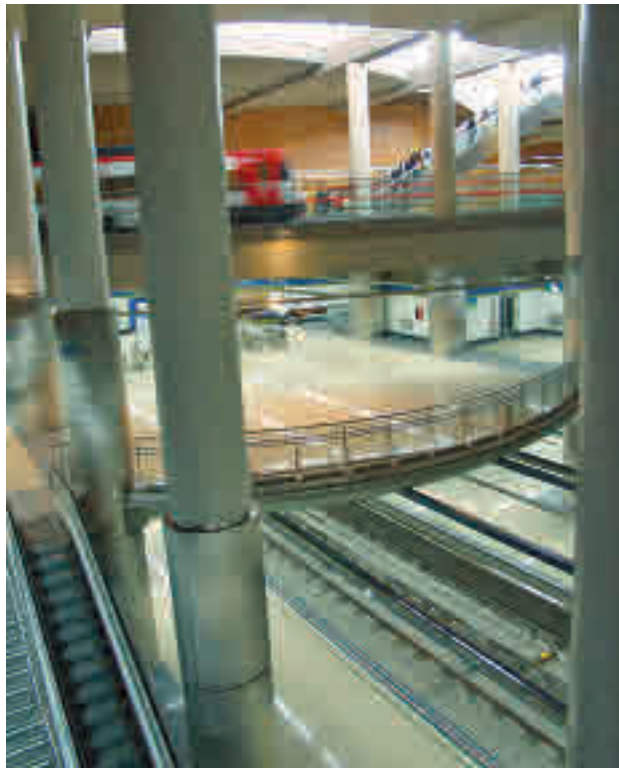
MetroSur se vuelve a cortar por obras

En esta ocasión, el corte comenzará el próximo lunes 21 de junio y afectará a nueve estaciones: Hospital de Móstoles y Manuela Malasaña (Móstoles); Loranca, Hospital de Fuenlabrada, Parque Europa, Fuenlabrada Central y Parque de los Estados (Fuenlabrada); Arroyo Culebro y Conservatorio (Getafe). Según prevé la Consejería de Transportes, el cierre se prolongará al menos hasta el pró-