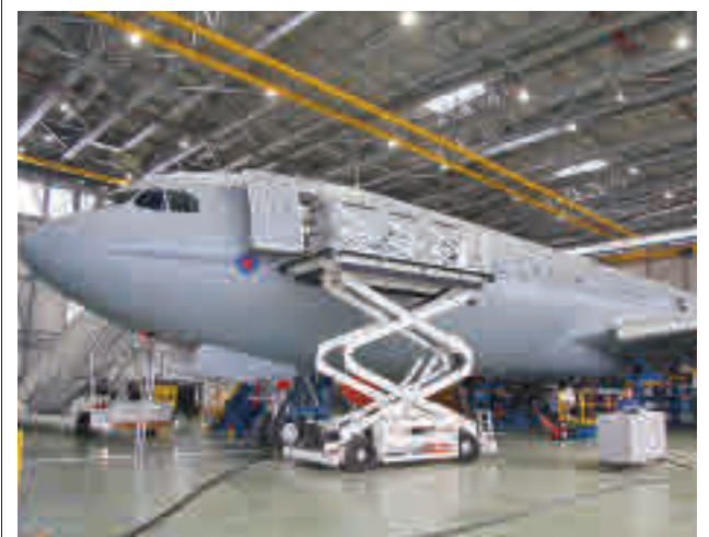
Fábrica aeronáutica en Getafe

Por su parte, Ecologistas en Acción Comunidad de Madrid ha apuntado en su perfil de Twitter que "otra vez el vertido de lodos de depuradora en Pinto causa un grave problema de malos olores", por lo que se han preguntado si nadie "va a poner coto a este problema".