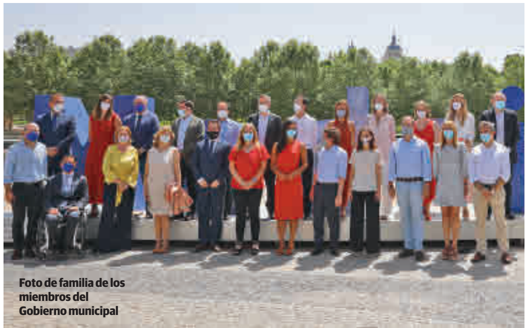
Foto de familia de los miembros del Gobierno municipal

Además, aludieron al refuerzo de los medios de la Policía Municipal; al desbloqueo de la Operación Chamartín y los desarrollos del sureste; a los apoyos a autónomos y pymes “a través de una bajada de impuestos histórica, además de la apertura de una nueva línea de ayu-