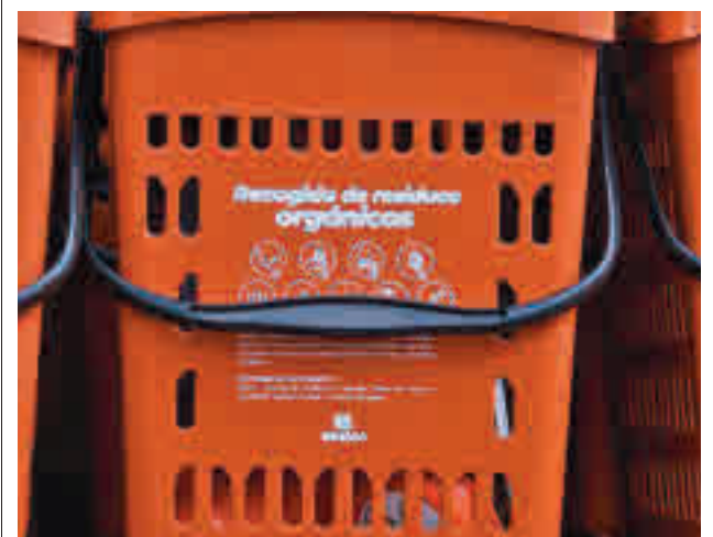
Cubos entregados a las familias

El Ayuntamiento de Valdemoro ha aprobado la licencia para que la Comunidad construya el nuevo centro de educación especial en la ciudad.