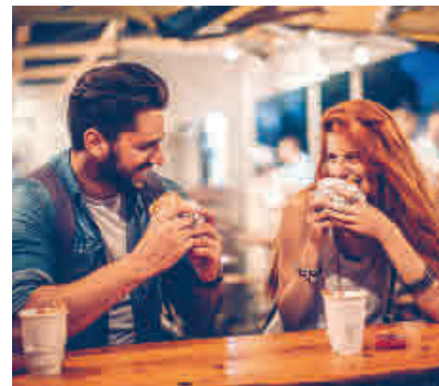
Una pareja conversa