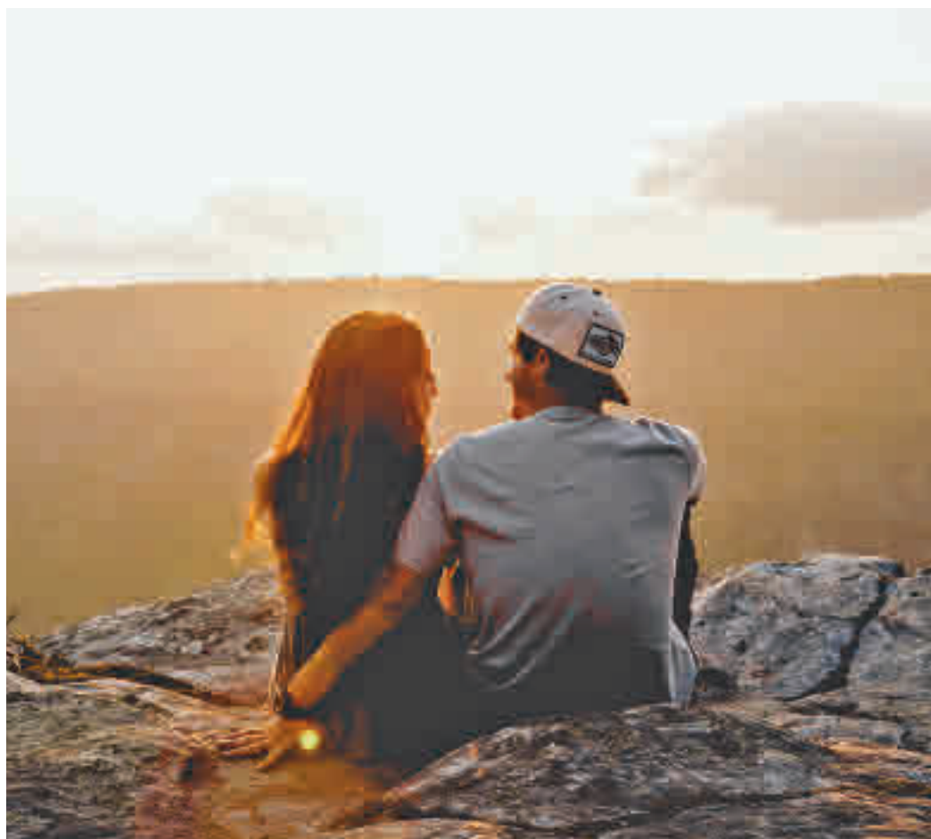
En busca de la pareja ideal

En lo referente a las cualidades que encarna esa pareja ideal, gran parte de los solteros coinciden en que lo que cuenta es lo que hay en el interior.