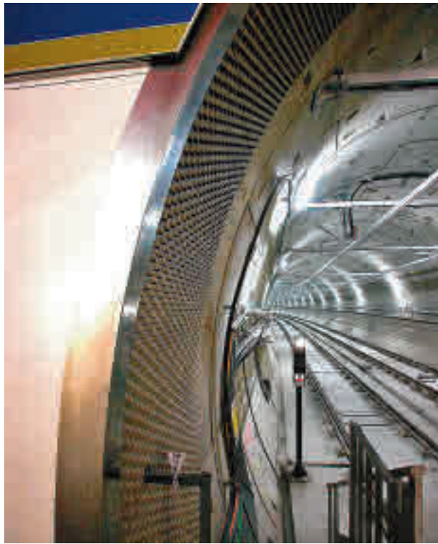
MetroSur se vuelve a cortar por obras

En esta ocasión, el corte comenzará el próximo lunes 21 de junio y afectará a nueve estaciones: Hospital de Móstoles y Manuela Malasaña (Móstoles); Loranca, Hospital de Fuenlabrada, Parque Europa, Fuenlabrada Central y Parque de los Estados (Fuenlabrada); Arroyo Culebro y Conservatorio (Getafe). Según prevé la Consejería de Transportes, el cierre se prolongará al menos hasta el pró-