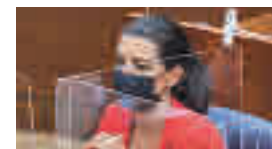
Rocío Monasterio: VOX