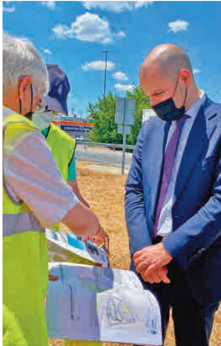
El alcalde majariego visitó los trabajos este lunes 7 de junio

Según fuentes municipales, la conexión peatonal desde Roza Martín se llevará a