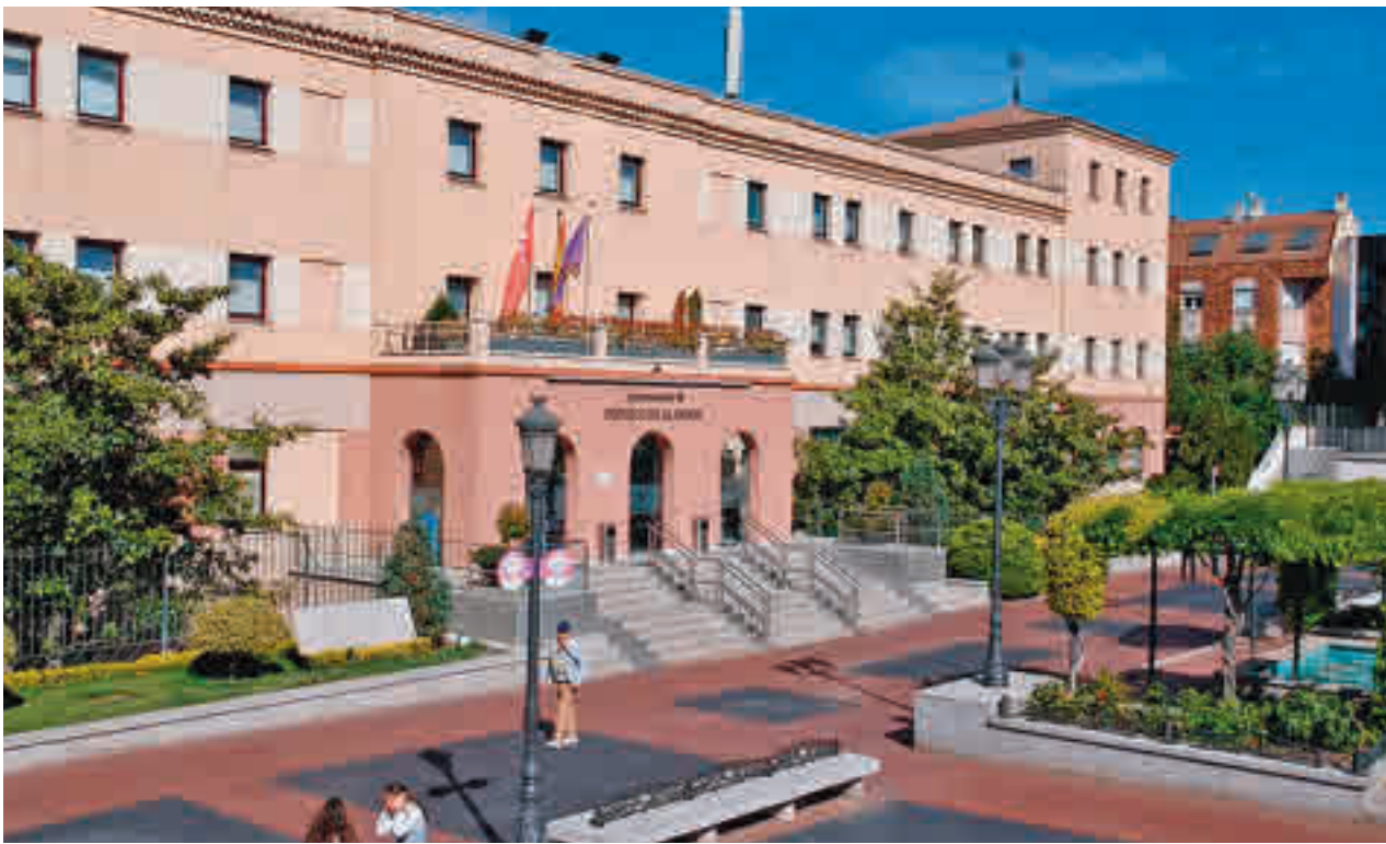
El Ayuntamiento decretó un día de luto oficial