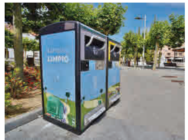
Dos de las nuevas papeleras inteligentes

El área de Medio Ambiente ha alcanzado un acuerdo para instalar 20 unidades de estas nuevas papeleras en todo el municipio, priorizando las cercanías de áreas de juegos infantiles, colegios, zonas comerciales y vías públicas especialmente concurridas. El proyecto se desarrollará a lo largo de un año.