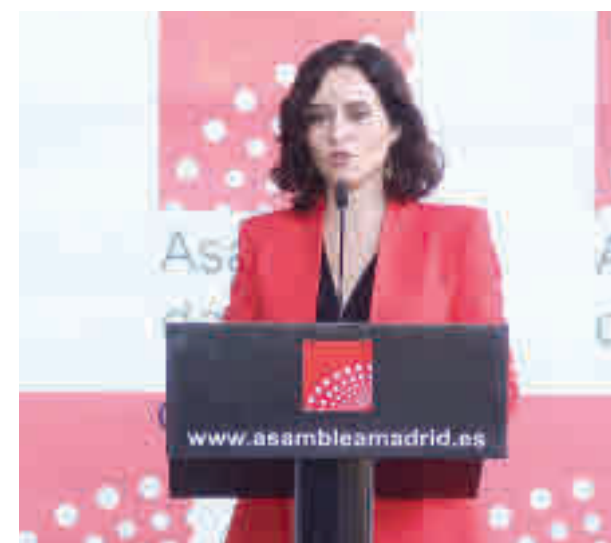
Isabel Díaz Ayuso

Desde el Partido Popular apuntan a que el objetivo es que el debate de investidura se realice la semana que viene. La primera sesión, con el discurso de Díaz Ayuso y la intervención de los portavoces, sería el jueves 17. Para el viernes 18 se dejaría la votación, en la que la popular no debería tener ningún problema. En caso de lograr la mayoría absoluta (más de la mitad de los votos favorables), el sábado 19 podría tomar posesión de un cargo que ya obtuvo hace menos de dos años.