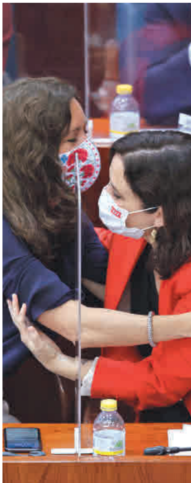
Eugenia Carballero es la nueva presidenta de la Asamblea

La unidad que demostraron el PP y Vox para elegir a los miembros de la Mesa de Asamblea se sustenta en el acuerdo al que han llegado ambas formaciones para reducir el número de diputados de esta cámara casi a la mitad: de 136 a 69. Para lograrlo será necesaria una reforma del Estatuto de Autonomía, algo para lo que se necesitan dos tercios de los votos de la Asamblea. Las formaciones de derecha necesitan el apoyo de la izquierda para sacar adelante la medida.