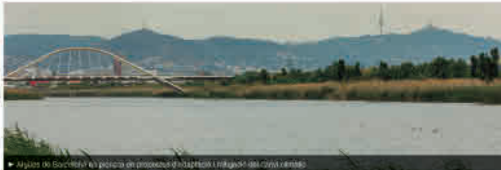
Aigües de Barcelona en procés d'adaptació i mitigació del canvi climàtic

L'aigua, clau davant l'emergència climàtica. Aigües de Barcelona compromet amb la preservació de l'entorn i els