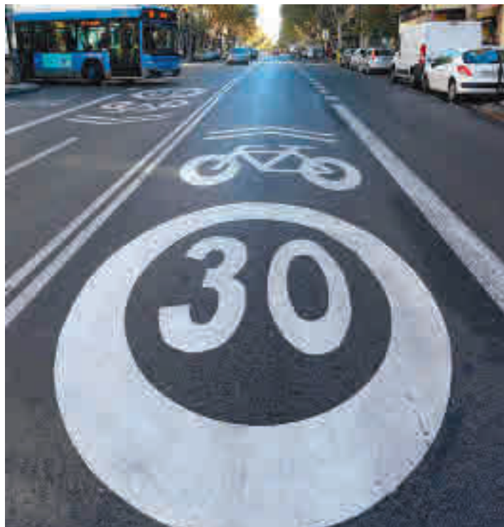
Los seguros también se verán afectados

“El cambio nos dará más tiempo para reaccionar y acabará evitando muchos accidentes a largo plazo, algo todavía más importante si tenemos en cuenta que las dis-