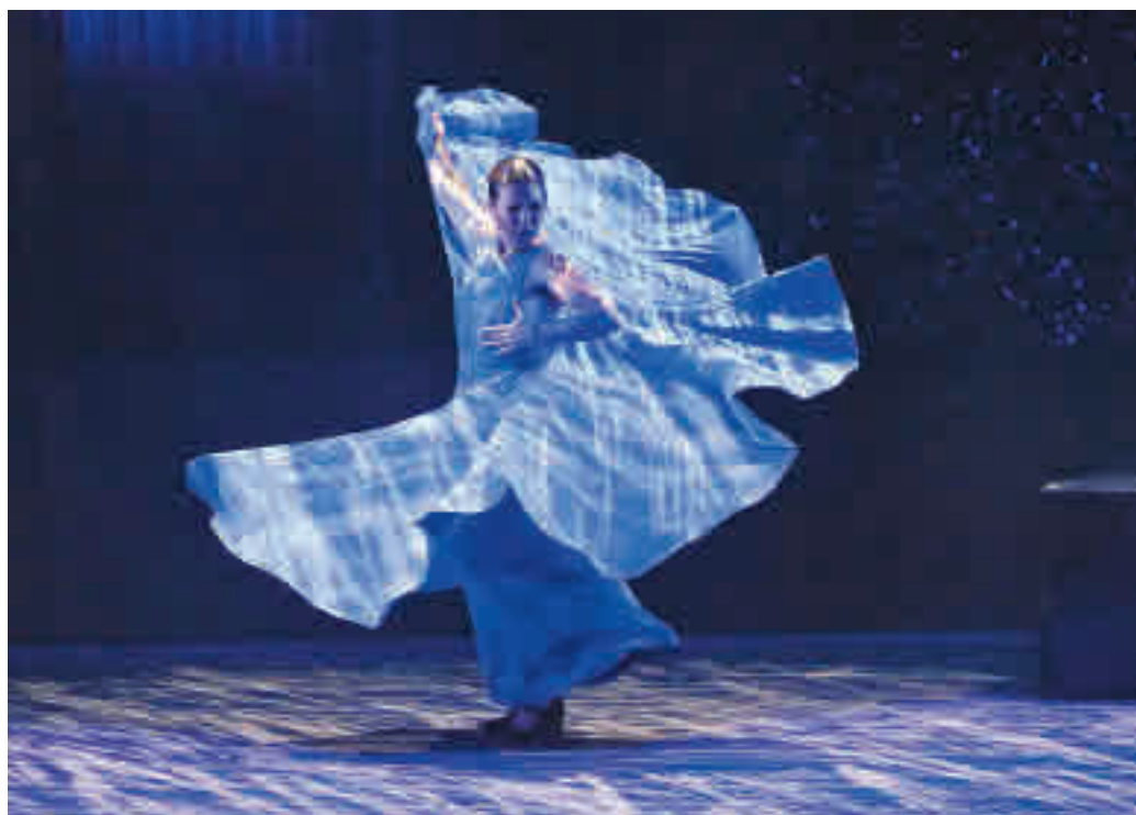
El certamen recupera un aforament proper als 2.000 espectadors.

LA BALLARINA HA PRESENTAT EL SEU NOU ESPECTACLE, 'MOMENTOS'