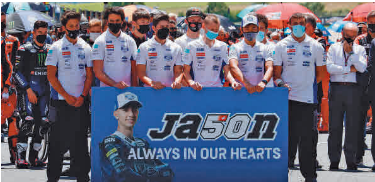
Un momento del homenaje al piloto Jason Dupasquier