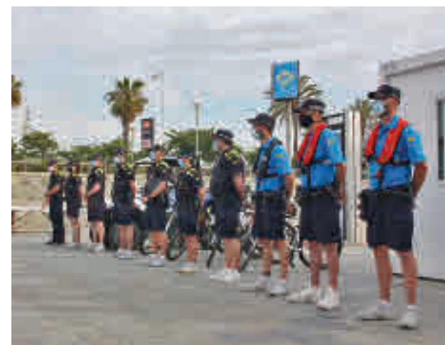
Agents del Grup de Platges.

Com es feia abans de la pandèmia els agents de la Guàrdia Urbana, els Mossos i la Policia Portuària treballaran amb altres dispositius municipals per buidar les platges a les sis del matí.