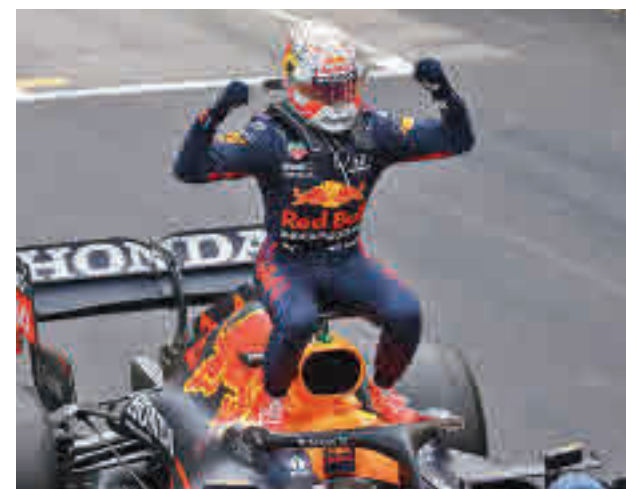
Verstappen es líder tras su triunfo en Mónaco

Atendiendo a los precedentes, el de Bakú se presenta como un trazado más favorable a las condiciones de los Mercedes. De las tres veces que se ha corrido en este circuito, dos acabaron con triunfos de Bottas y Hamilton.