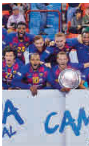
El Barça, otra vez favorito

gue gobernando con puño de hierro el Barcelona. Los azulgranas volvieron a entonar el alirón con un pleno de triunfos, lo que no impide que se