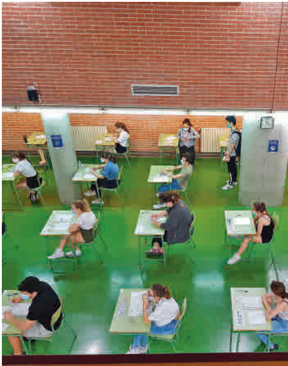
Estudiantes realizan la EBAU

En lo que respecta a la convocatoria extraordinaria, queda abierta la puerta a que esta pueda realizarse en junio, julio o en septiembre. Así las cosas, Navarra, Castilla-La Mancha y Murcia serán las que más prisa se den, mientras que Cataluña se queda