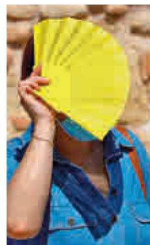
Una mujer se protege del sol