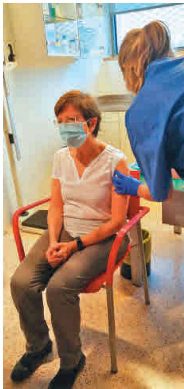
Els nascuts a partir de 1976 ja poden vacunar-se.

La Comissió de Salut Pública va avalar també que aquest grup pogués rebre la vacuna de Janssen, que se suma a la de Pfizer i Moderna. A més, alguns col·lectius essencials que no van poder