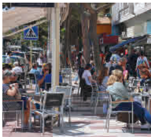
Una terraza aquest diumenge passat.

EL PERIÓDICO GENTE NO SE RESPONSABILIZA NI SE IDENTIFICA CON LAS OPINIONES QUE SUS LECTORES Y COLABORADORES EXPONGAN EN SUS CARTAS Y ARTÍCULOS