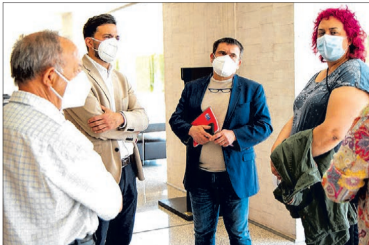
Reunión con plataformas por la sanidad pública, el día 3.