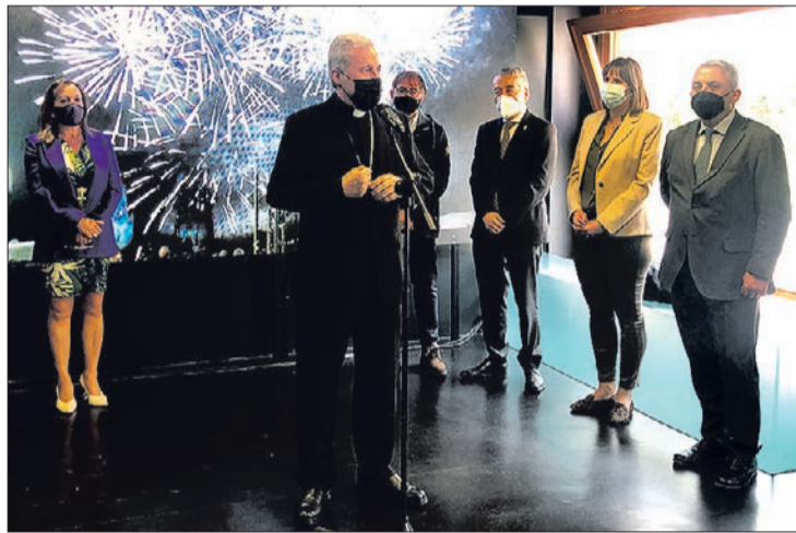
Acto inaugural del nuevo centro en la calle Asunción de Nuestra Señora.

El centro estará abierto de manera ininterrumpida desde las 9.00 horas hasta las 19.30 h. y generará tres puestos de trabajo, permitiendo vincular además dos