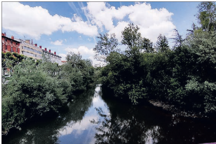
El objetivo es concienciar sobre la importancia de cuidar las zonas verdes.