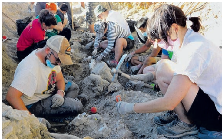
La campaña de excavaciones se desarrollará en la segunda quincena de julio.

La campaña prevista para este año, la XVIII, se desarrollará en la segunda quincena de julio, con la participación de 15 personas trabajando directamente en el yacimiento frente a las 20-22 de otras campañas, según ha informado el Colectivo Arqueológico y Paleontológico de Salas de los Infantes en