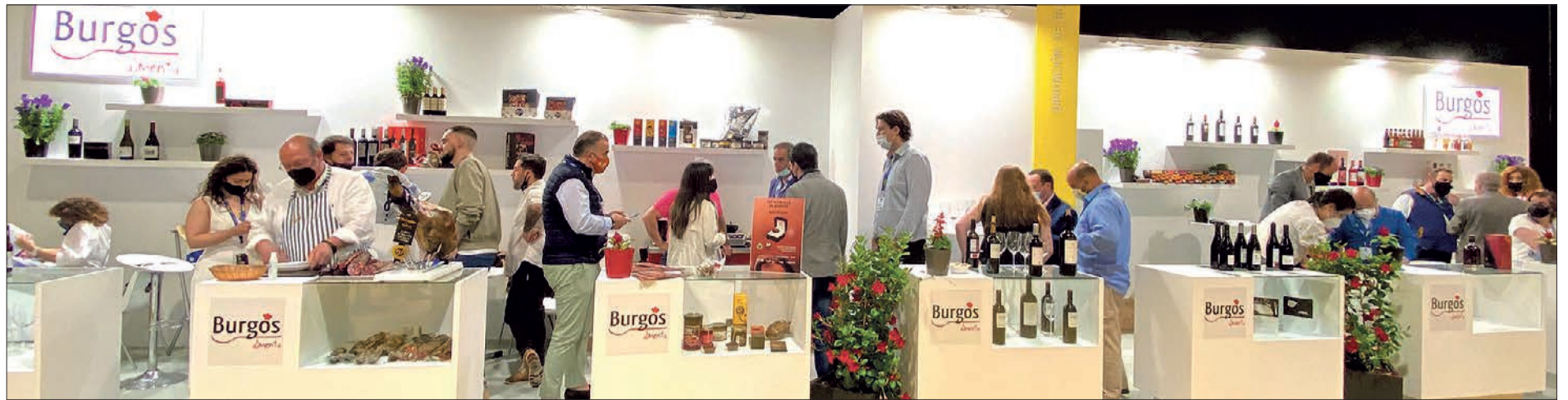
El stand de Burgos Alimenta ha duplicado su espacio expositivo en la edición de este año de Madrid Fusión Alimentos de España, donde han participado veinte productores de la provincia.